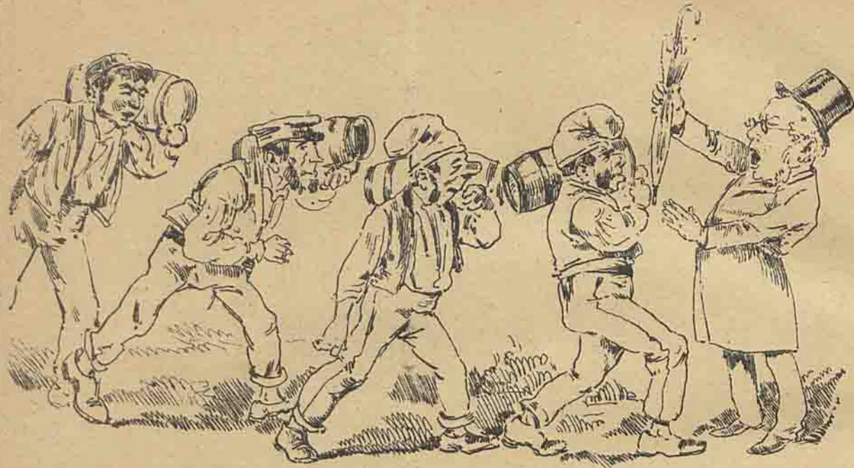
A nova companhia das aguas. Esta, ao menos, dá excellente dividendo.