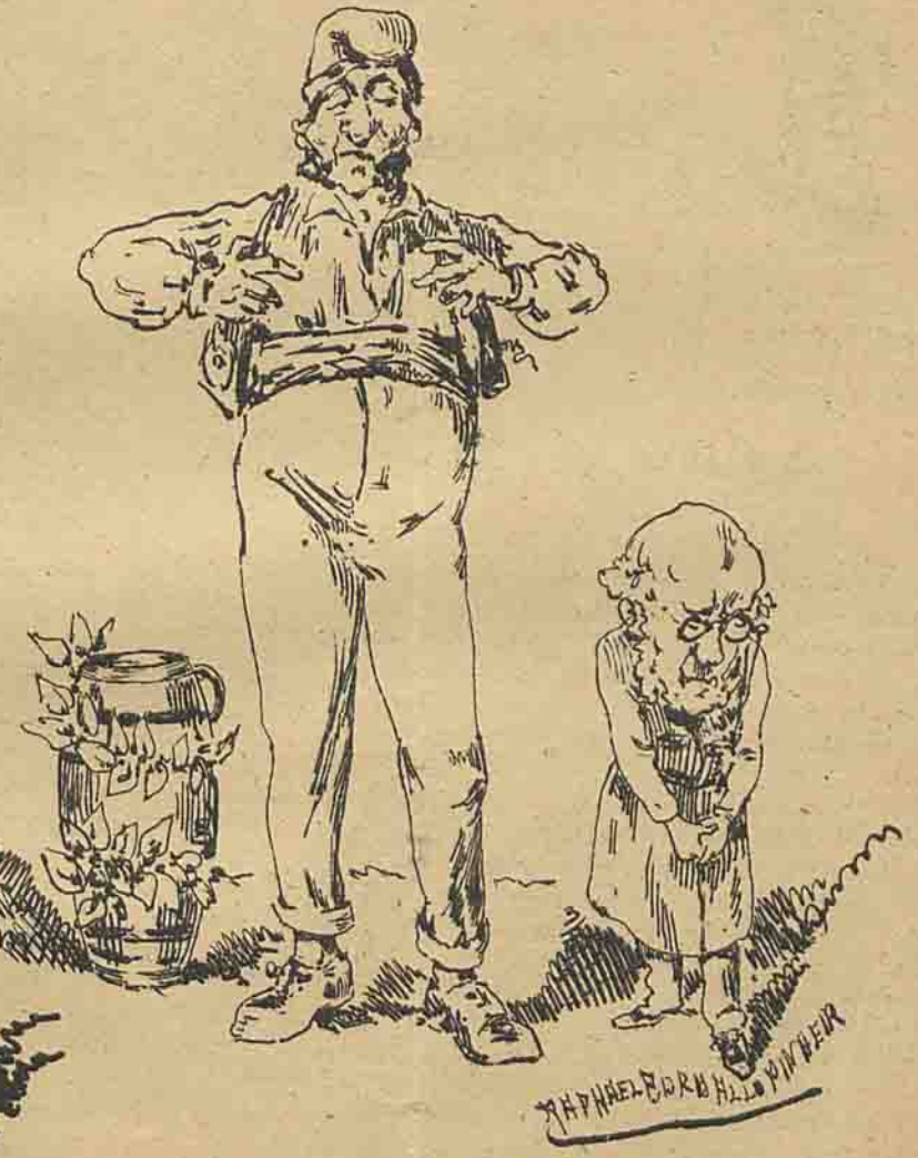
— Atraz de mim birá quem bom me fará