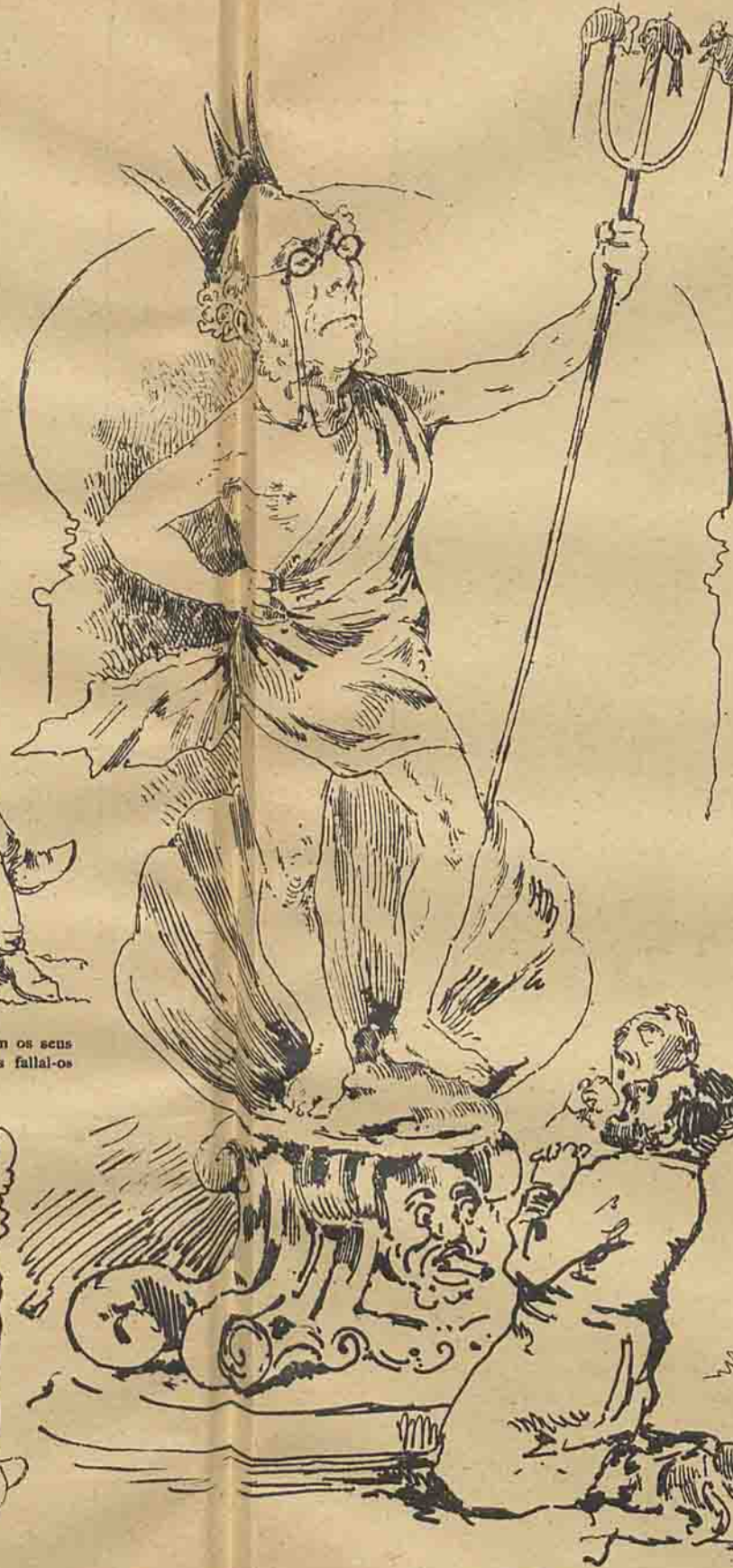
Verdadeiro retrato do visconde do Rio... Secco.