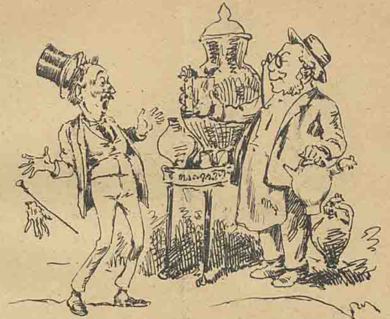
— A dois tostões cada metro cubico de ratazanas mortas, fóra o aluguer do contador — e é só quando me der na gana