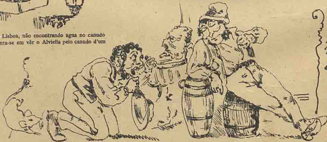
Zé Povinho, namorando o gallego, canta, com musica das Trez cidras do amor: —Dá-me agua, senão morro...