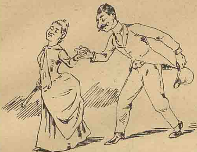
1.ª marca. En avant quatre. Ainda não disse nada.