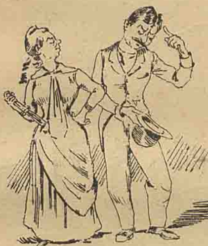
— E' preciso dizer uma coisa muito espirituosa...

Elle: — Esteve hoje uma tarde muito fresquinha. Ella: — Não achei. Elle: — Terá v. ex.ª razão. E' talvez por não trazer a minha camisolinha de flanela.