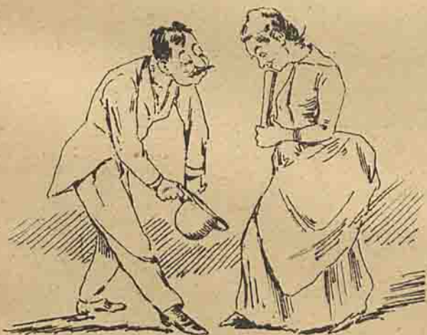
Volta da 2.ª marca. Salut.