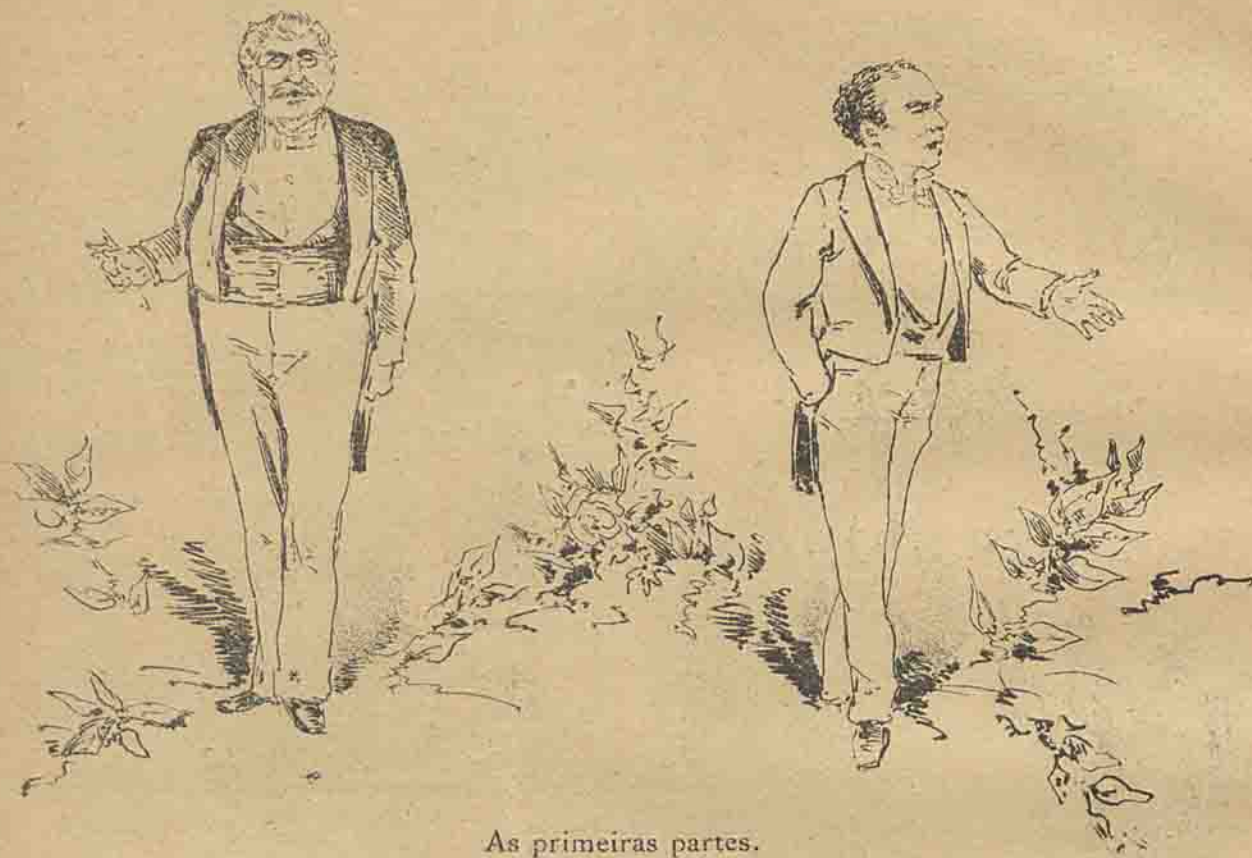
As primeiras partes.