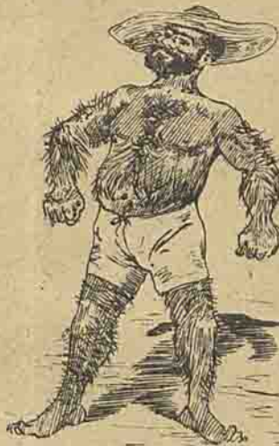
Vae assirn para poder ter os movimentos livres. Diz elle que os cabellos são um signal de força.