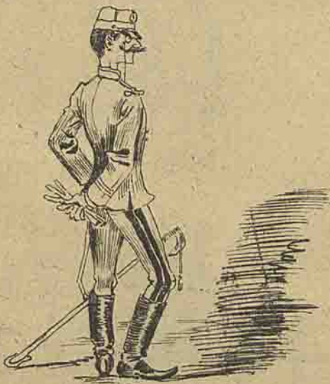
Não toma banho para não perder o prestigio do uniforme.