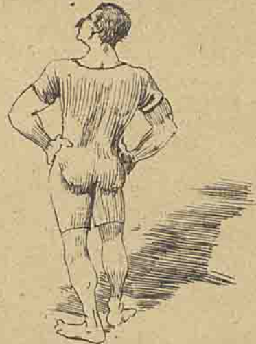
Passeia na praia para dar tempo a que o admirem.