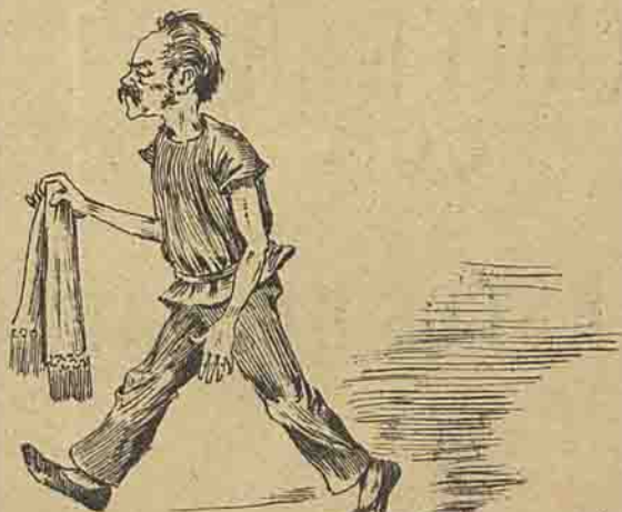
Toma banho contra vontade. Tem medo da agua, mas vac porque mandou o medico.