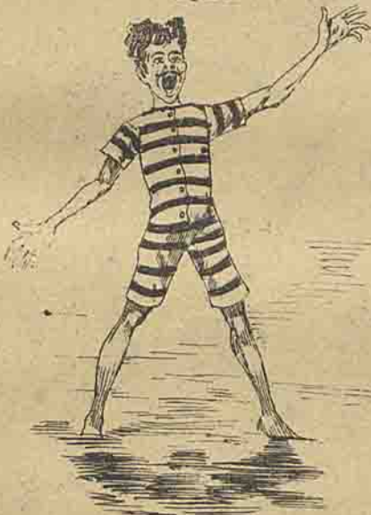
Toma banho para divertir os outros.