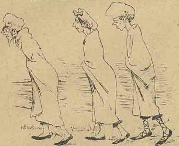
Qual d'ellas irá primeiro?