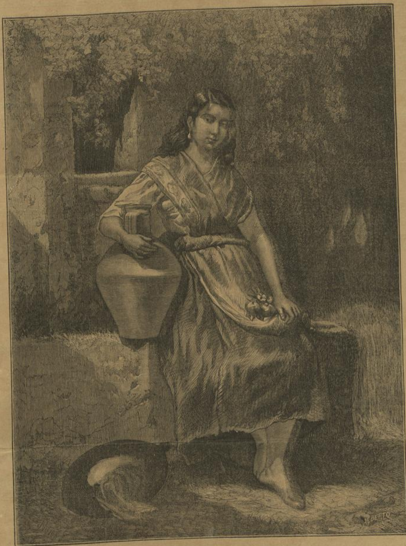
ALDEA DOS SUBURBIOS DE COIMBRA