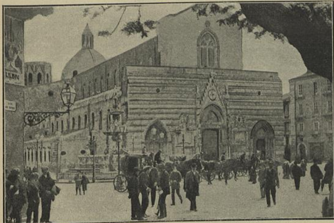
A CATEDRAL DE MESSINA

Fala-se ahi com muita afeição e devoção de Pinheiro Chagas, um dos vultos mais distinctos e sympathicos do nosso meio literario no ultimo quartel do seculo passado, e que deixando de si duradoura e aureolada nomeada, muito maior a legaria á posteridade, se os apertos da vida mais pausada e sazoadamente o deixassem trabalhar, e a morte o não houvesse colhido tão prematuramente.