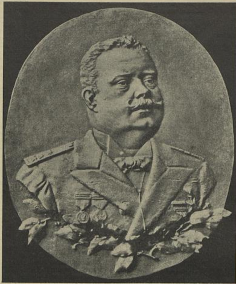
EL-REI D. CARLOS I

Sendo isto para mim predicado que em muito recommenda seu trabalho, pois que bem me merecem as obras em cuja factura entra, tem e occupa parte assignalada a personalidade de quem as traça e executa, ressumbrando atravez seu desdobramento, acresce-lhe em valor a narração de factos quasi desconhecidos, ou sendo-o bem pouco, aliás interessantissimos para o estudo e comprehensão de muitos