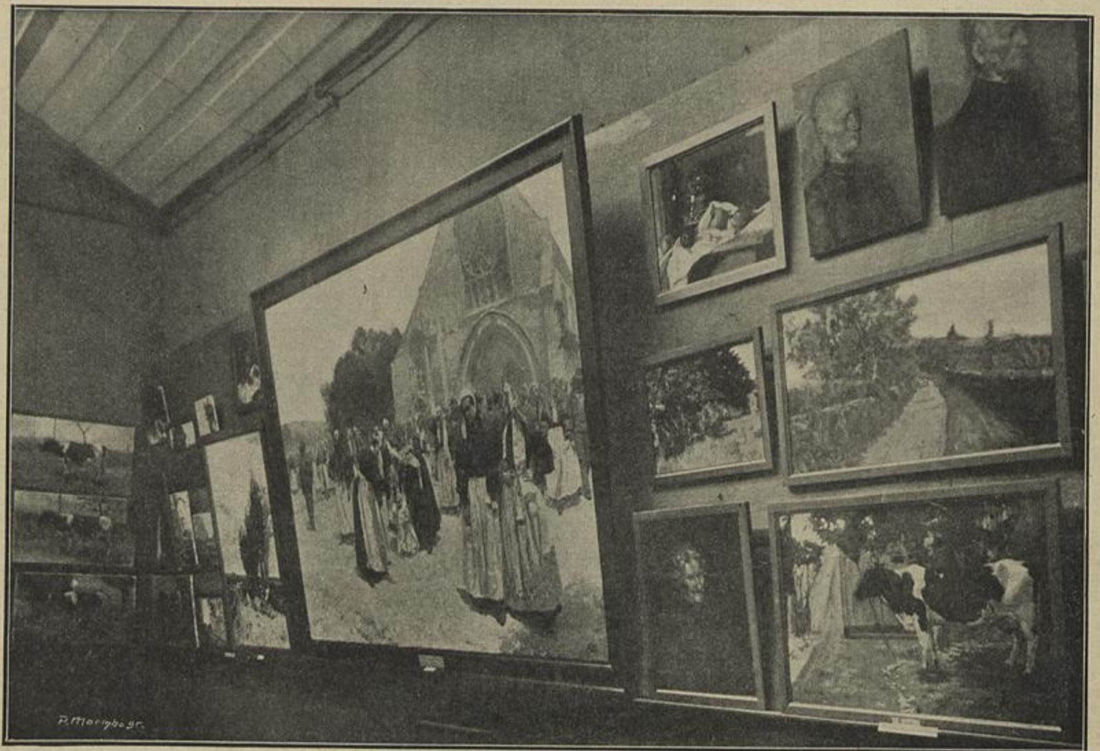
EXPOSIÇÃO DOS TRABALHOS DOS ALUNOS DA ACADEMIA DE BELAS-ARTES DE LISBOA E PENSIONISTAS NO ESTRANGEIRO, INAUGURADA EM 23 DO CORRENTE