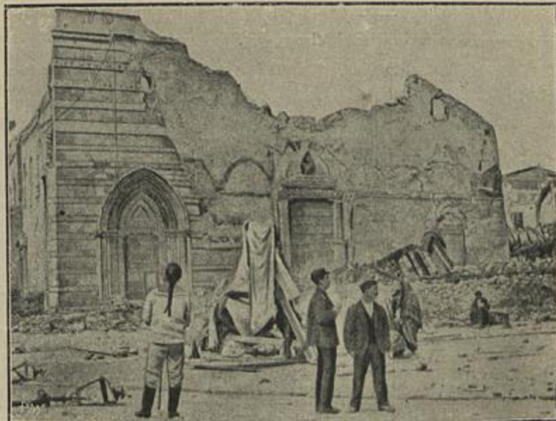
ESTADO DE RUINA EM QUE FICARAM OS DOIS MONUMENTOS, DEPOIS DO TERREMOTO — (De fotografias)