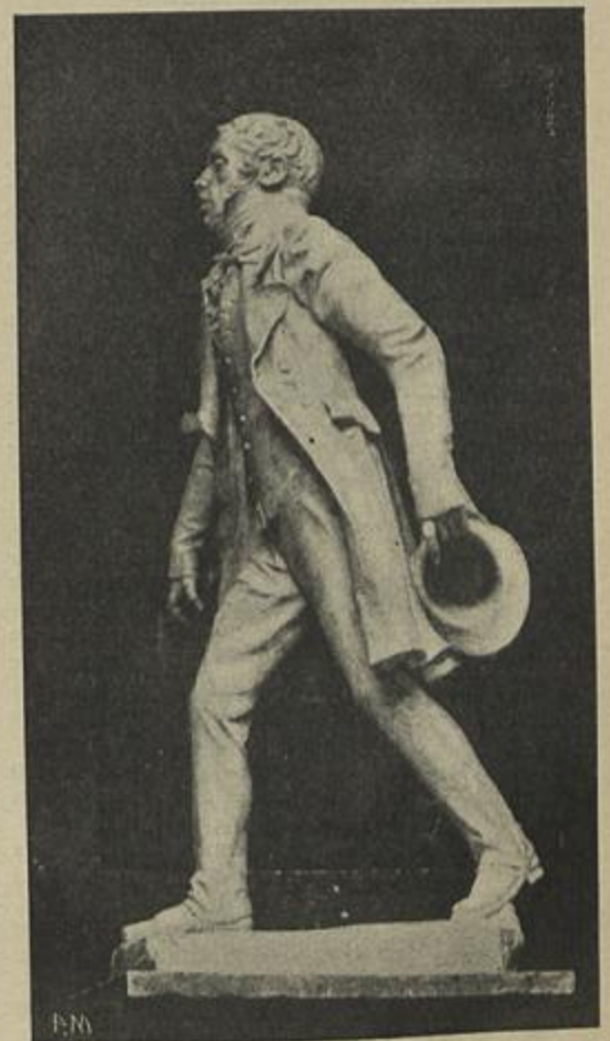
ASPETO DA MESMA ESTATUA DE PERFIL

A preocupação da velocidade, caracteristica do genio inventivo do seculo XIX, no qual se adiantaram invenções verdadeiramente revolucionarias dos nossos habitos e ideias, adquire já neste prin-