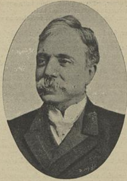
CAMPOS HENRIQUES Presidente do Conselho e ministro do Reino