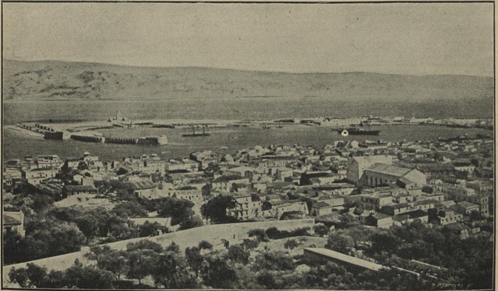
VISTA GERAL DE MESSINA, QUE FICOU ARRASADA PELO TERRAMOTO DE 28 DE DEZEMBRO (De fotografias)