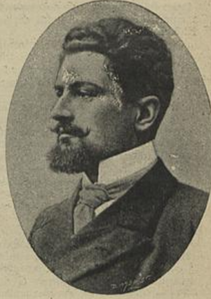
D. LUIZ DE CASTRO Ministro das Obras Publicas