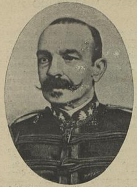
GENERAL SEBASTIÃO TELLES Ministro da Guerra