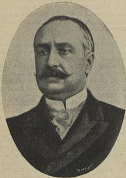
WENCZLAU DE LIMA Ministro dos Estrangeiros