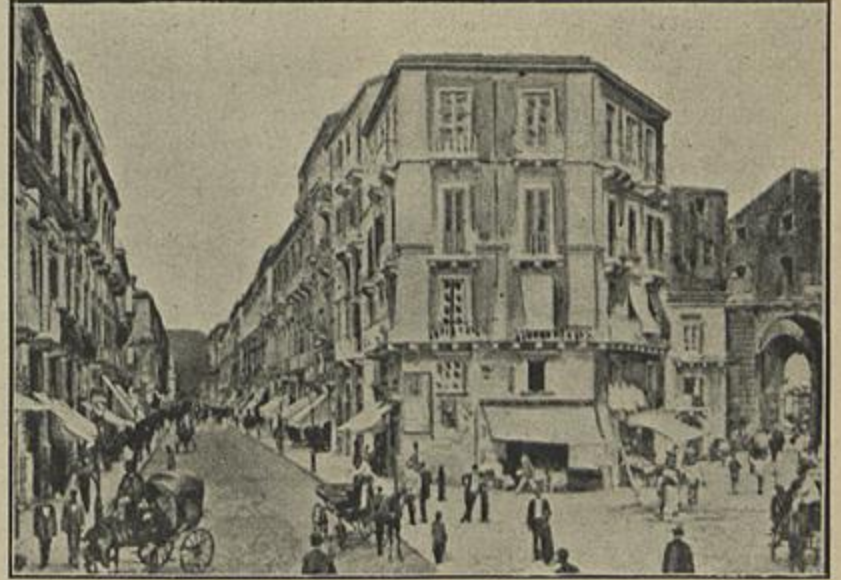
MESSINA — CORSO VICTOR EMMANUEL E ESTATUA DE NEPTUNO — VIA GARIBALDI E PORTA MARINA