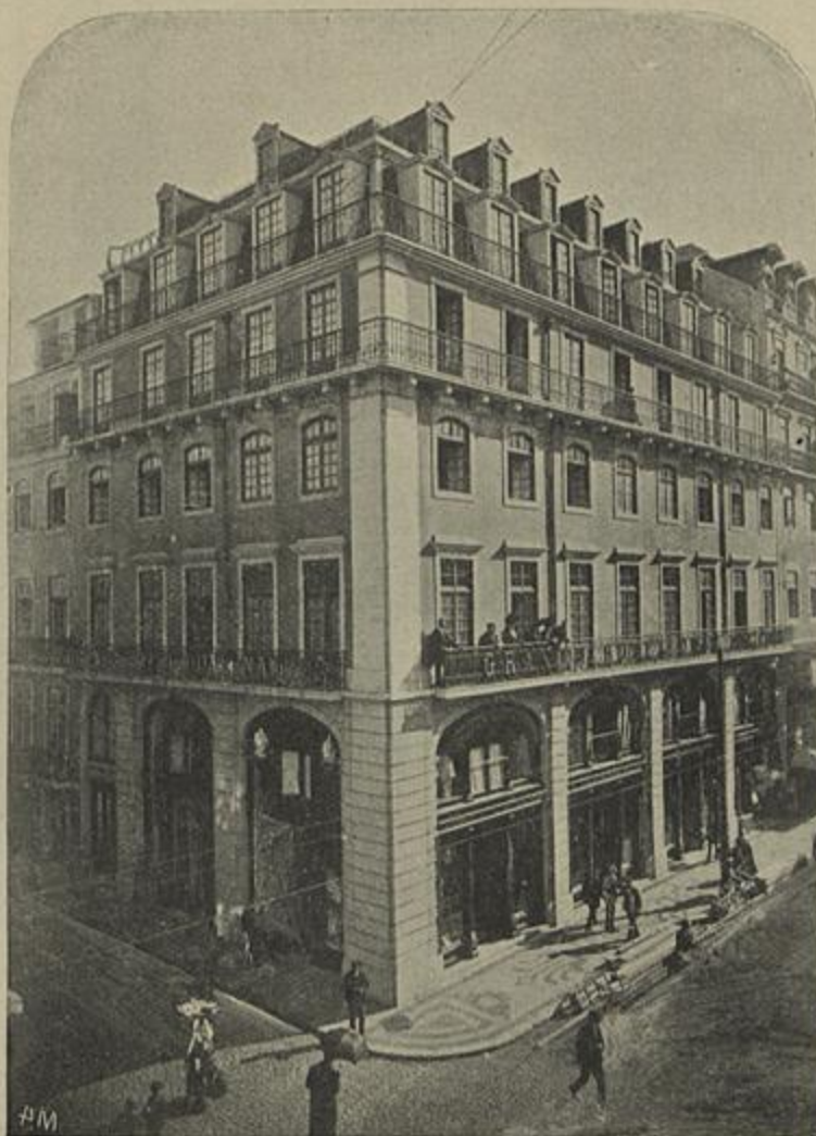
VISTA EXTERIOR DO GRANDE HOTEL DUAS NAÇÕES NA RUA AUGUSTA E RUA DA VICTORIA

A situação do GRANDE HOTEL DUAS NAÇÕES é das