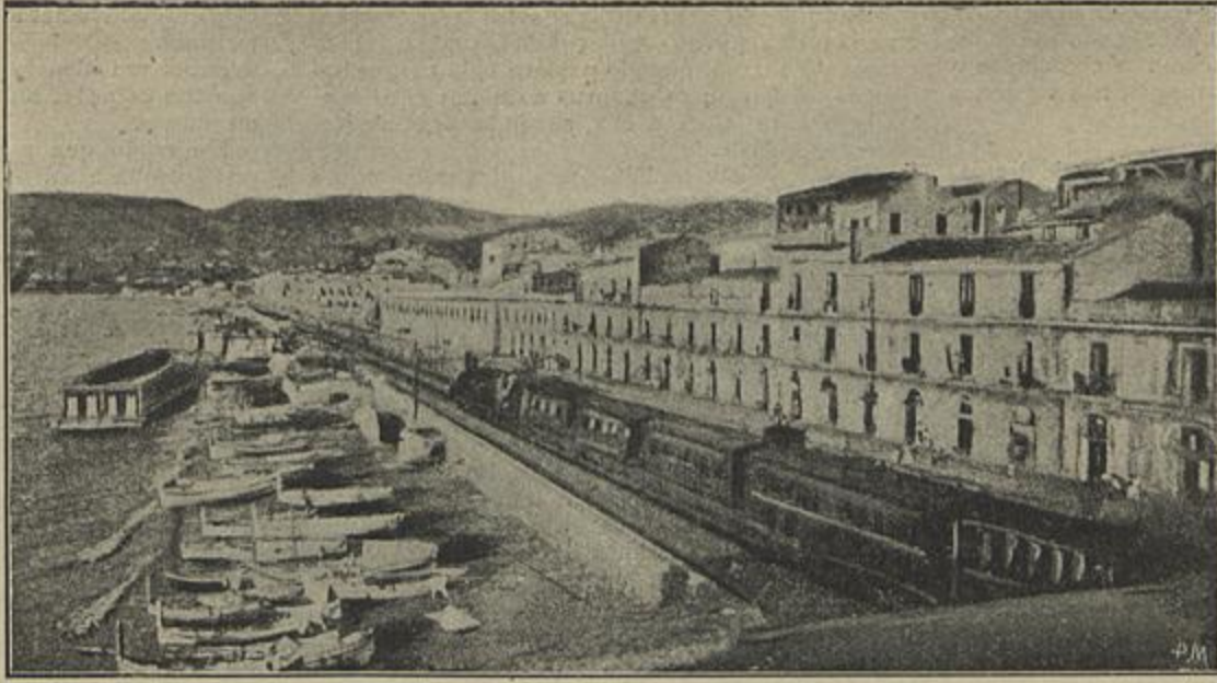
REGGIO DA CALABRIA, DESTRUÍDO PELO TERRAMOTO