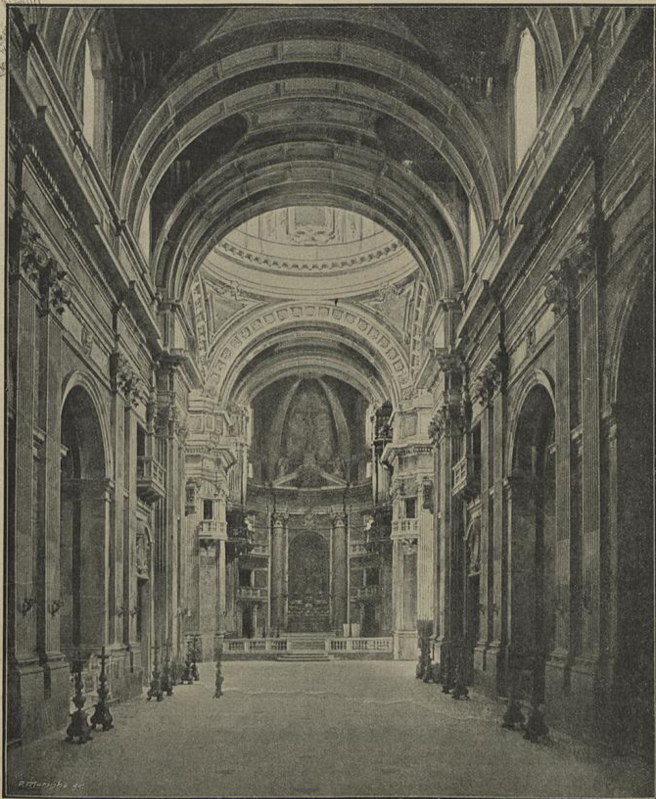
MOSTEIRO DE MAFRA — VISTA INTERIOR DA EGREJA (De fotografia)