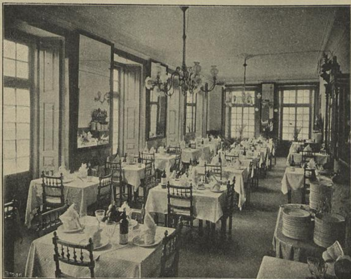
A SALA DE JANTAR DO GRANDE HOTEL DUAS NAÇÕES