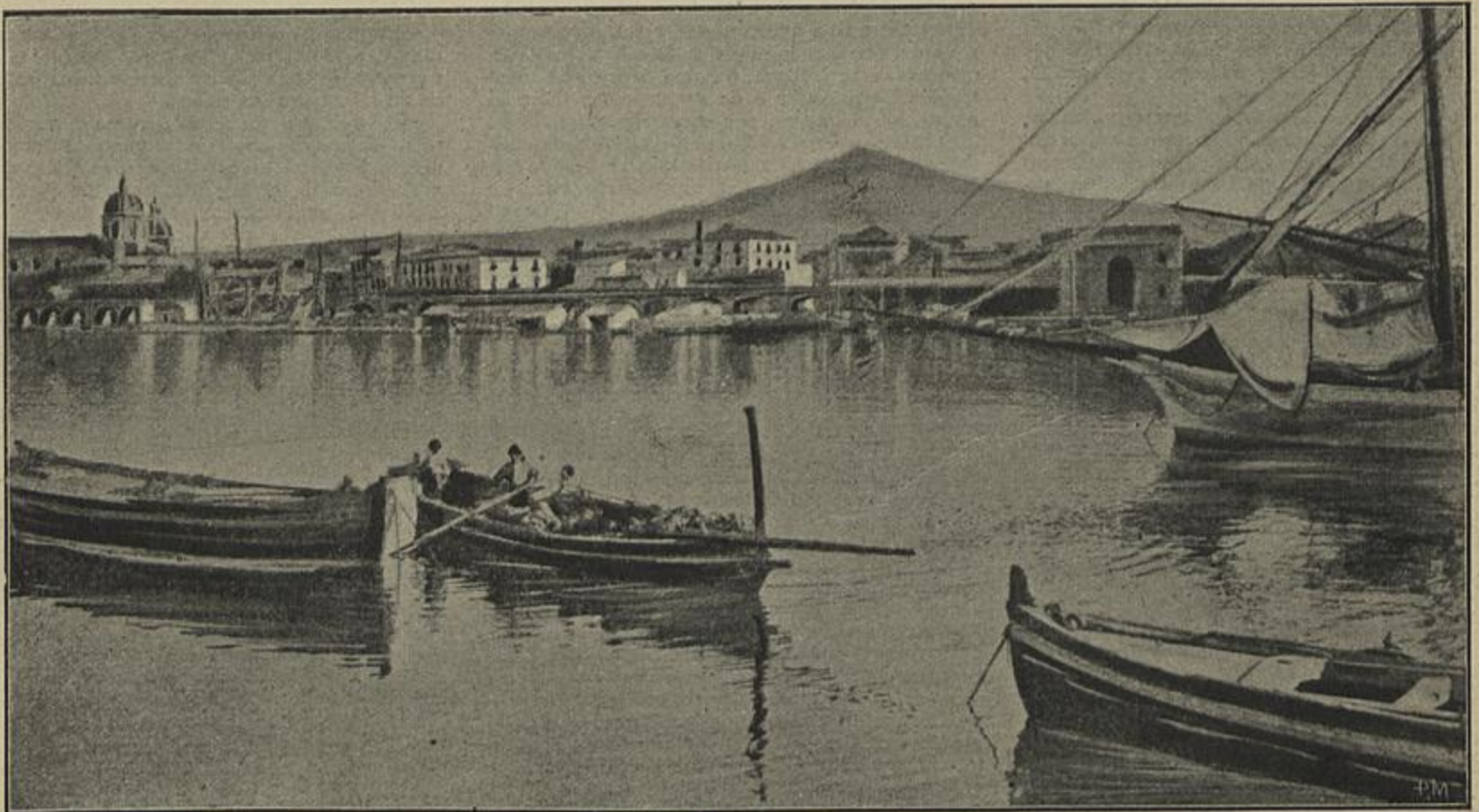
O PORTO DE CATANIA ONDE O MAR SE LEVANTOU INVADINDO A CIDADE