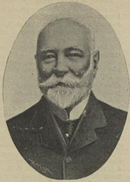
MANUEL AFFONSO ESPREGUEIRA Ministro da Fazenda