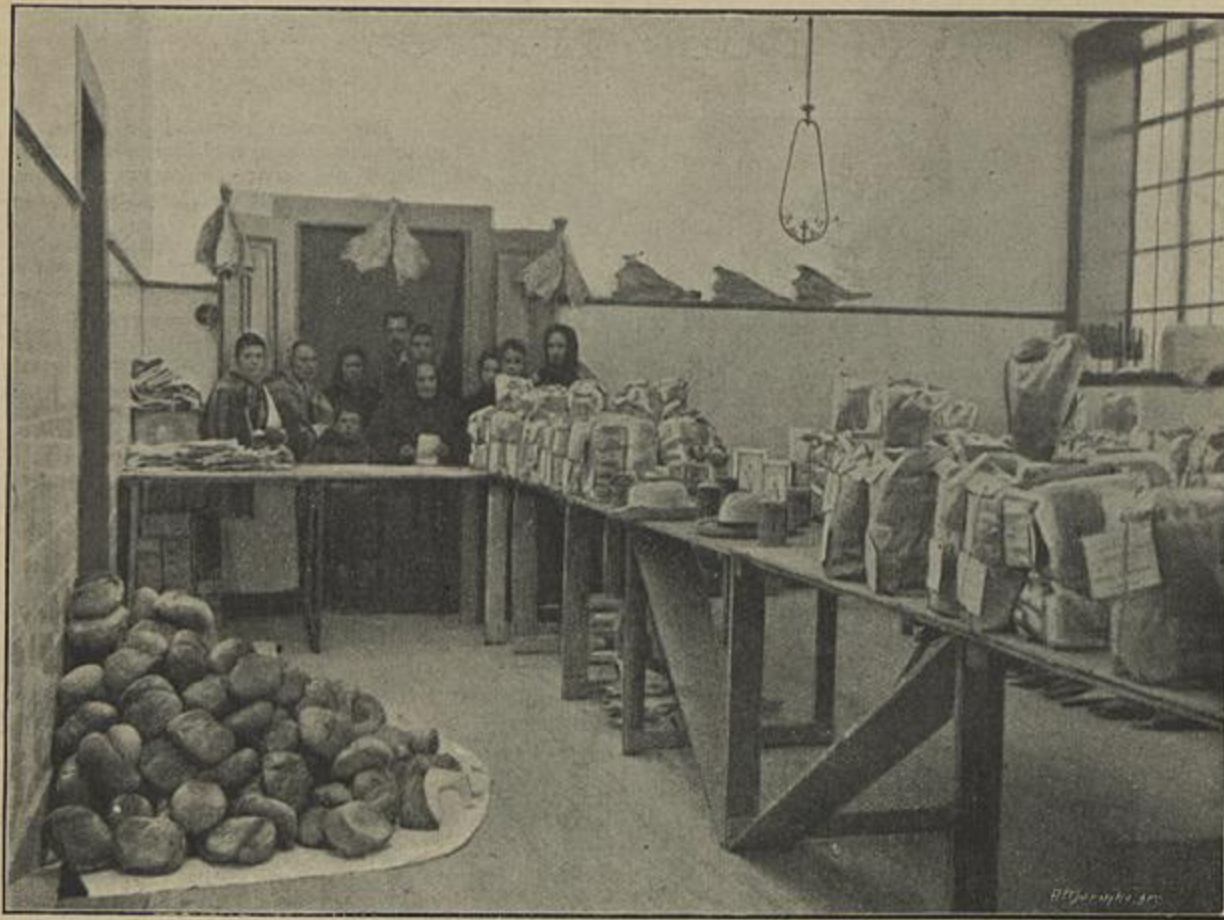
UM ASPECTO DA GRANDE SALA ONDE É FEITA A DISTRIBUIÇÃO DE GENEROS AOS POBRES PROTEGIDOS DO «DIARIO DE NOTICIAS»

Na historia da assistencia publica apraz-nos registrar um facto, que vem de longa data, qual é o da Caixa de Esmolas que o Diario de Noticias estabeleceu, quasi da sua fundação em 1864.