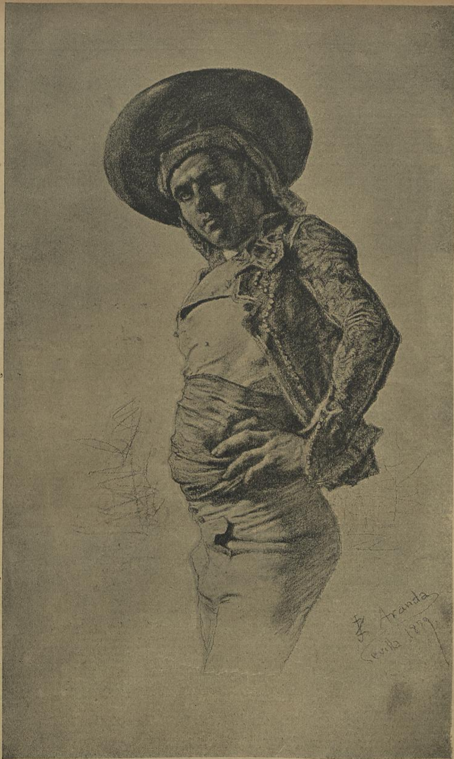
UM CIGANO — DESENHO DE ARANDA