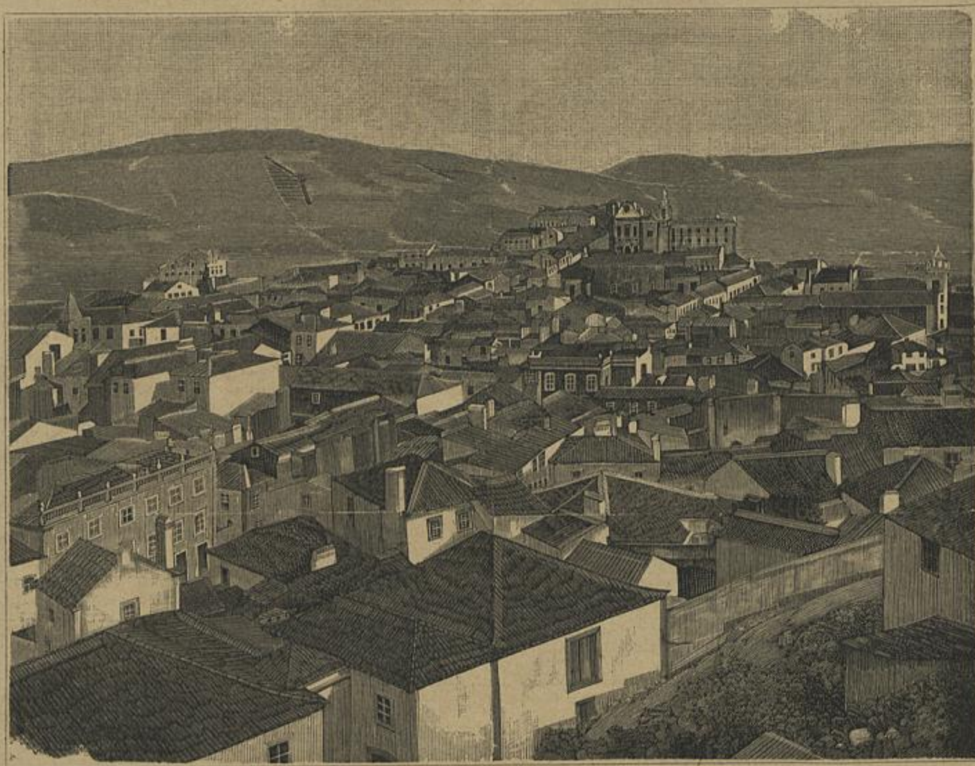
VILLA DE TORRES VEDRAS

E sabido que, ainda em nossos dias, não sómente italianos e francezes mas tambem outros povos de raça latina, consideram a hora de jantar como a mais aprazivel do dia, e que se esta refeição representa para elles um meio de alimentarem o physico, a não apreciam menos como agradavel diversão espirital e a prolongam