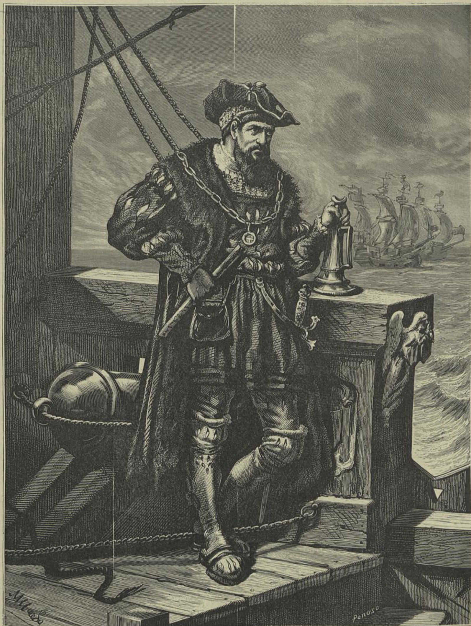
VASCO DA GAMA A BORDO DA NAU S. GABRIEL — DESENHO ORIGINAL DO SR. MANUEL DE MACEDO