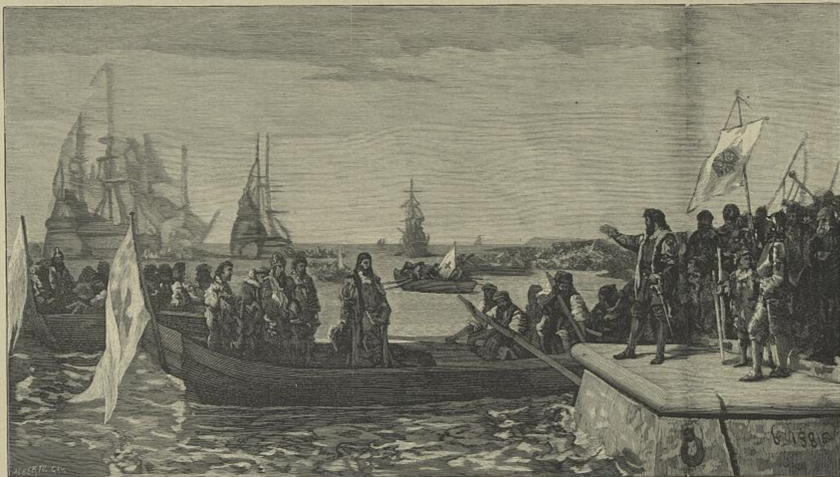
A PARTIDA DE VASCO DA GAMA PARA A INDIA — QUADRO DO FALLECIDO PINTOR MIGUEL ANGELO LUI