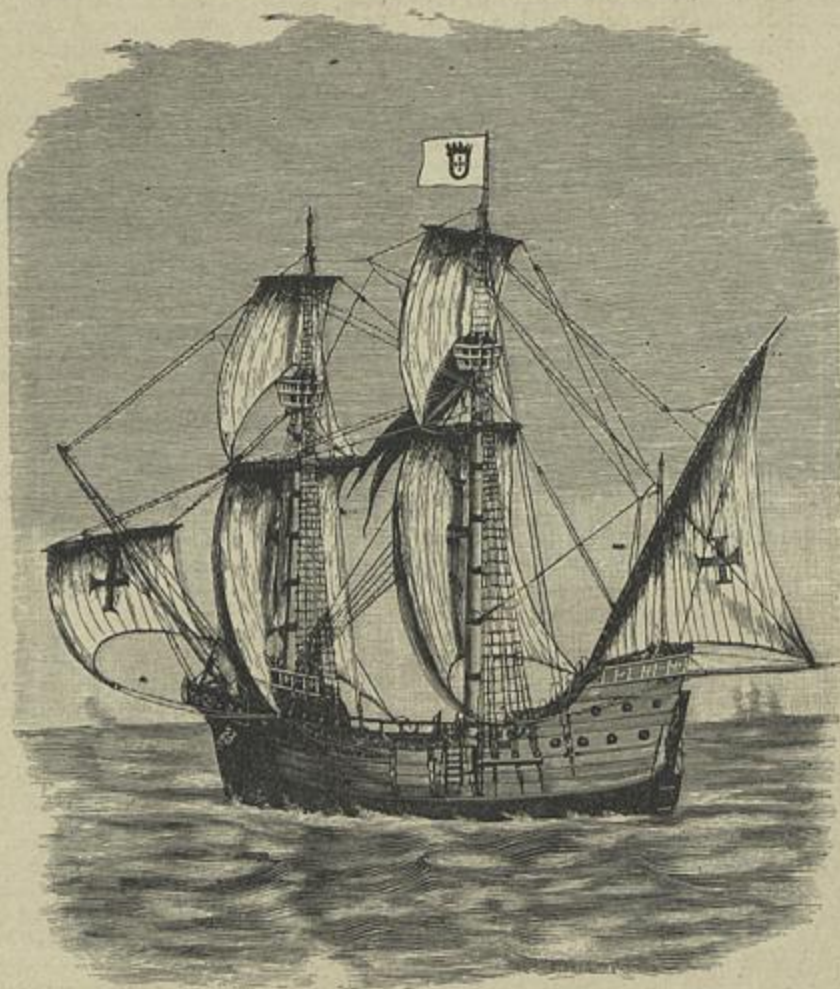
A NAU S. RAPHAEL QUE FEZ PARTE DA ARMADA EM QUE VASCO DA GAMA FOI Á INDIA

digenas e oitenta indios, como os quaes me dirigi para Charcas. Meu amo tambem para ali foi.