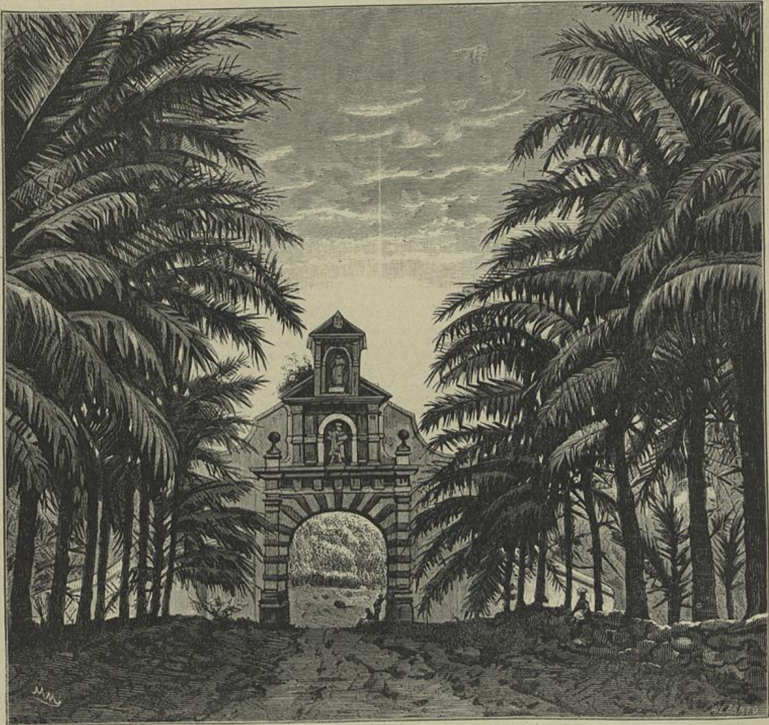
MONUMENTO A VASCO DA GAMA, EM GOA

CENTENARIO DA PARTIDA DE VASCO DA GAMA PARA A INDIA