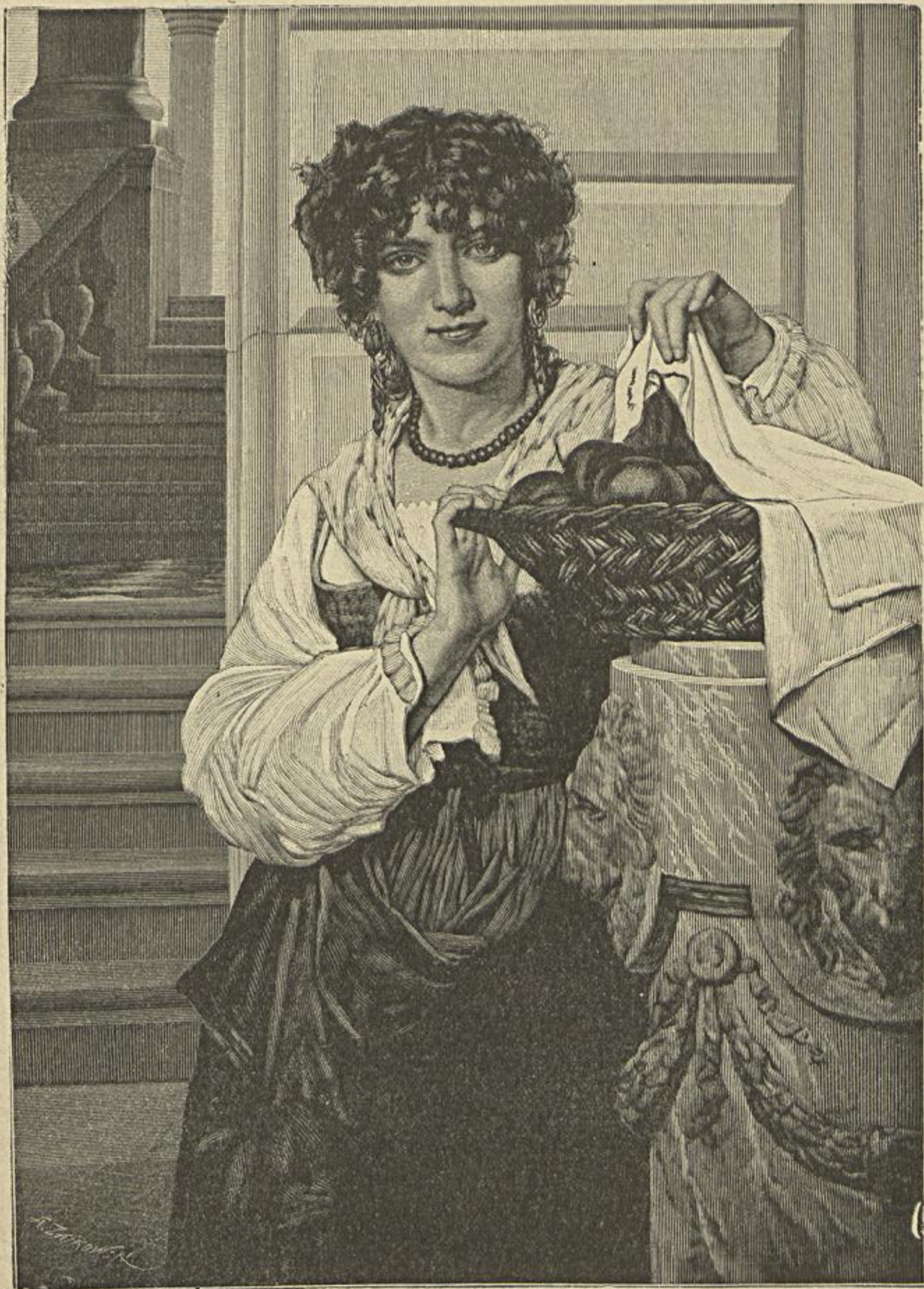
UMA VENDEDEIRA DE LARANJAS, EM NAPOLES