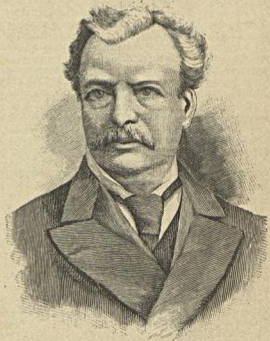
CONDE DE LINHARES

e idolatrado pela sua familia de que era chefe exemplarissimo.