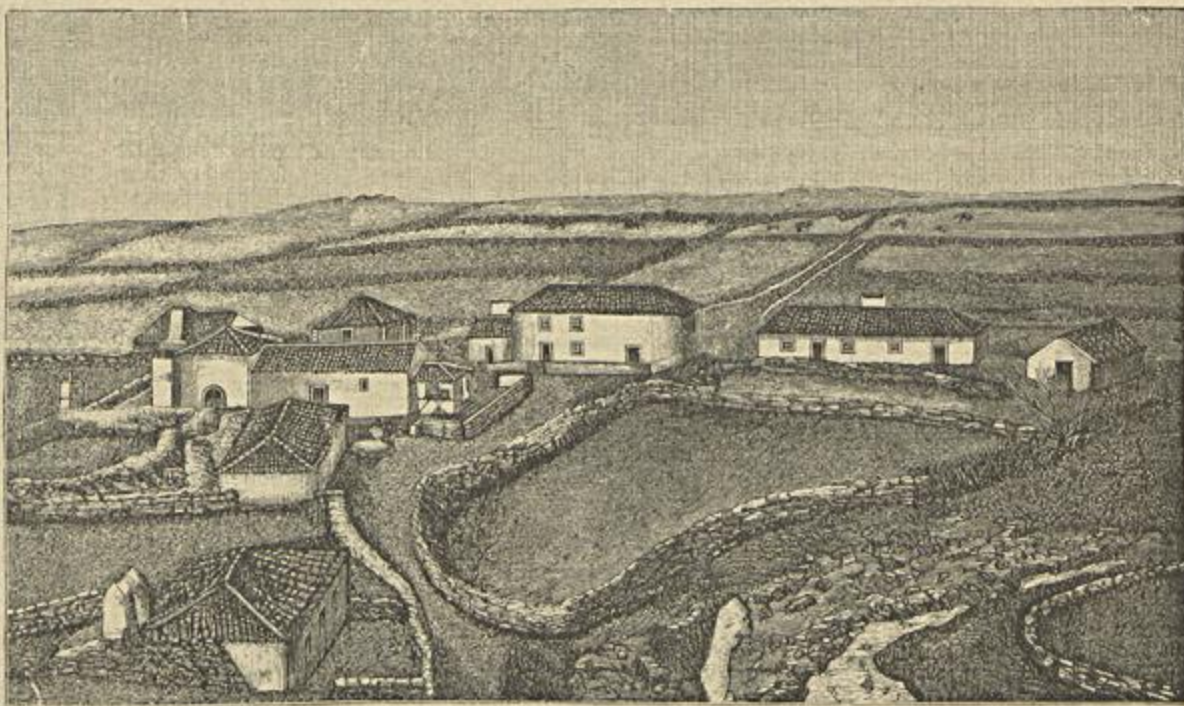
ILHA DE SANTA MARIA — LOGAR DOS ANJOS ONDE ESTÁ A ERMIDA A QUE OS TRIPULANTES DOS NAVIOS DE COLOMBO, DE VOLTA DA DESCOBERTA DO NOVO MUNDO, FORAM EM PROCISSÃO