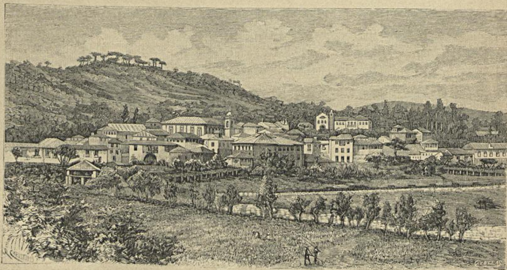
A VILLA DE S. PEDRO DO SUL.

Assim dispostas as coisas, os emigrados saltaram para canoas, e outros deitaram-se a nado, indo para bordo de pequenos vapores que os con-