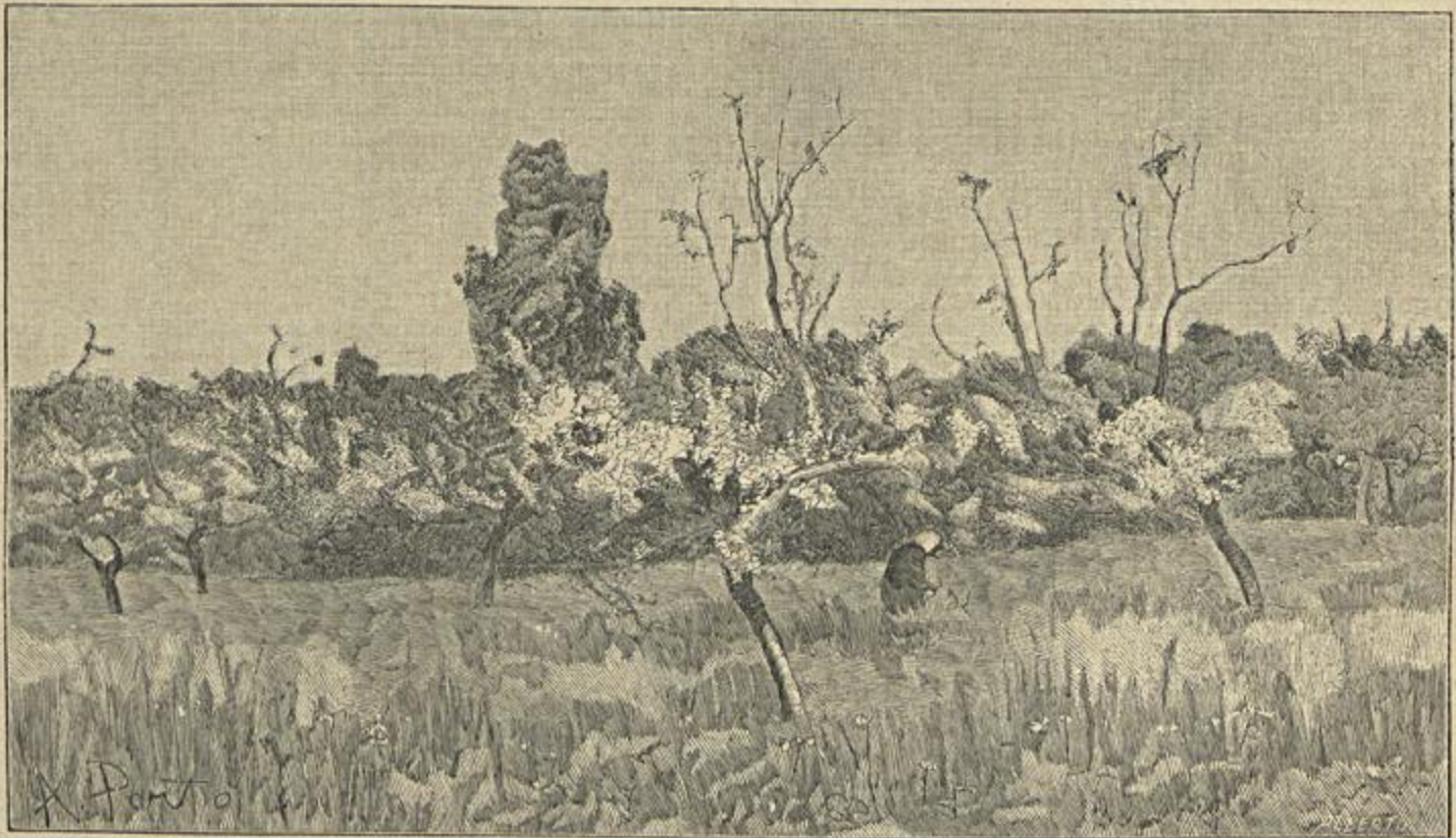
MACIEIRAS EM FLOR — QUADRO DE SILVA PORTO