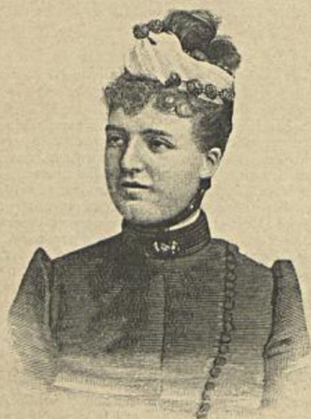
S. M. A RAINHA D. AMELIA