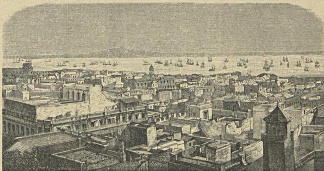
CIDADE E PORTO DE MONTEVIDEU

O vapor Pedro Tercero que conduziu o resto dos emigrados