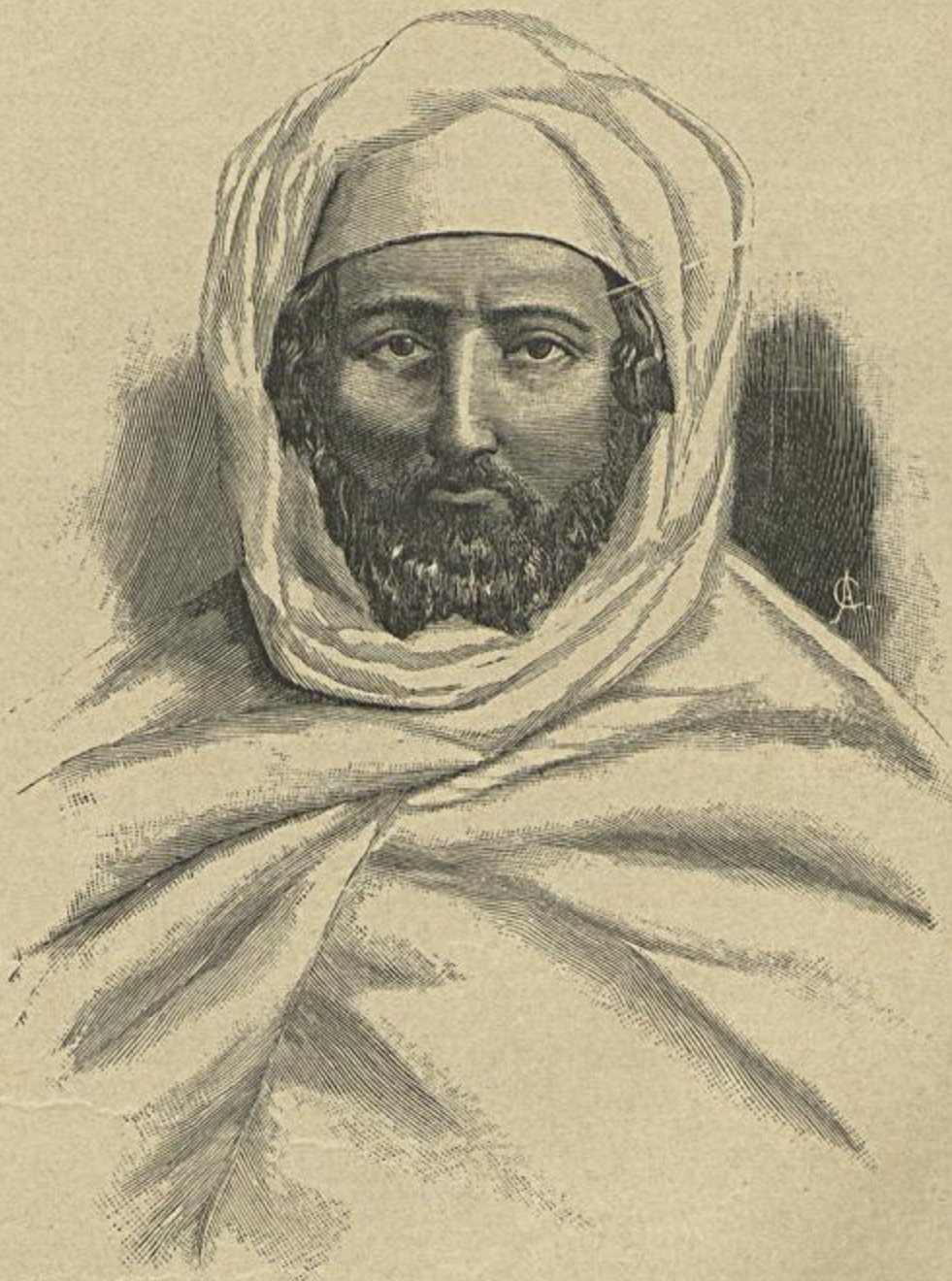
O SULTÃO DE MARROCOS, SIDI MULEY HASSAN