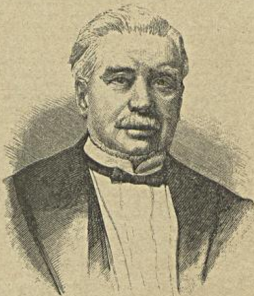
CONSELHEIRO JOSÉ DE MELLO GOUVEIA

Em homenagem aos muitos serviços prestados pelo barão Howorth e muito especialmente á classe operaria da sua fabrica, que perdeu n'elle um bom chefe e amigo, a camara municipal approvou que seja dado á rua dos Serralheiros, em Sacavem, o nome da rua do Barão Howorth de Sacavem .