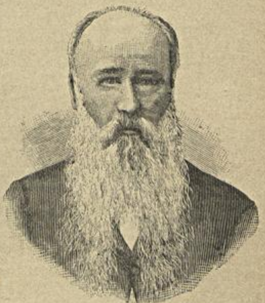
BARÃO DE HOWORTH DE SACAVEM