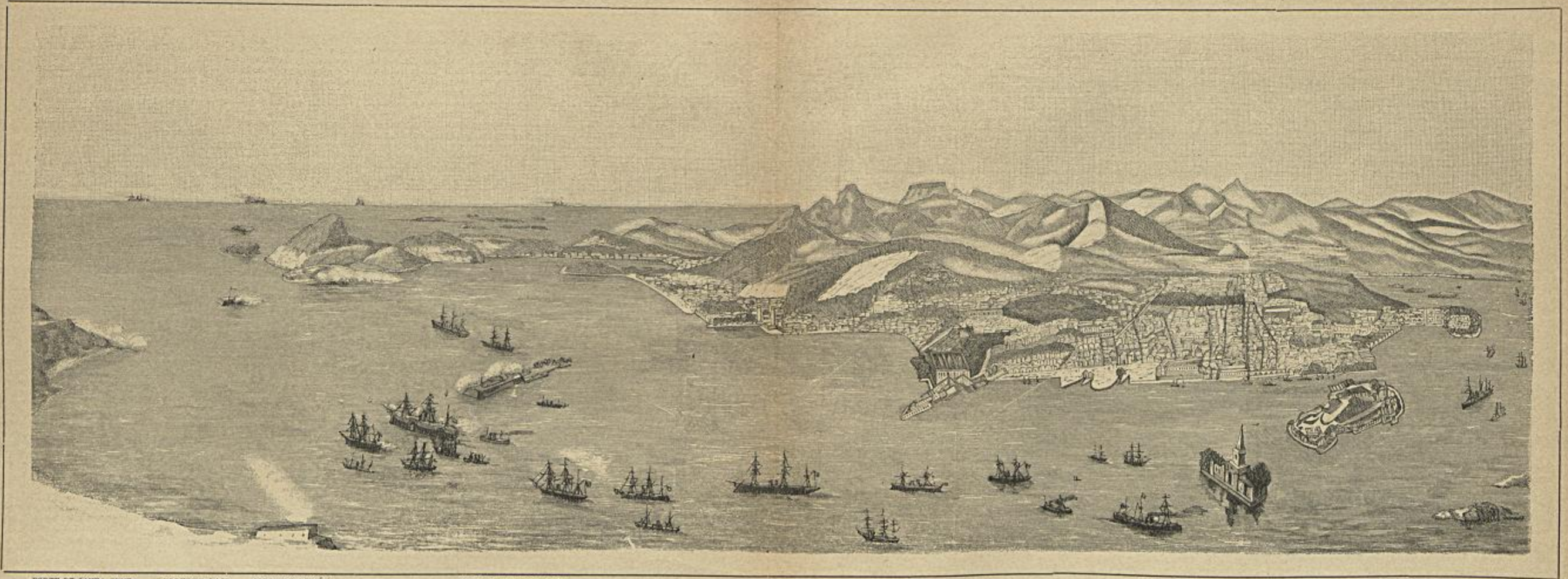
FORTE DE SANTA CRUZ