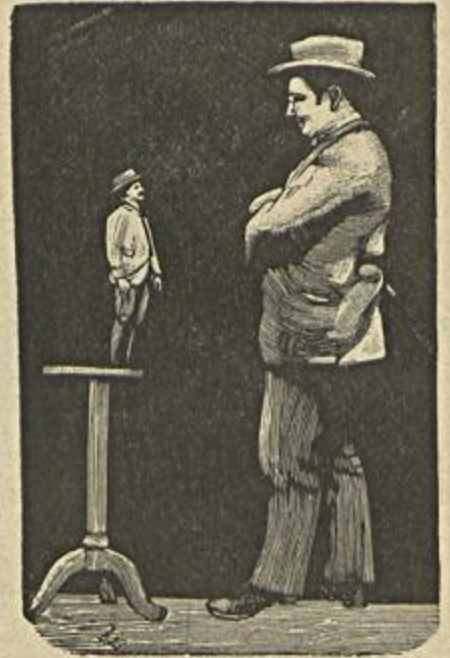
A PROPRIA FIGURA EM PONTO PEQUENO