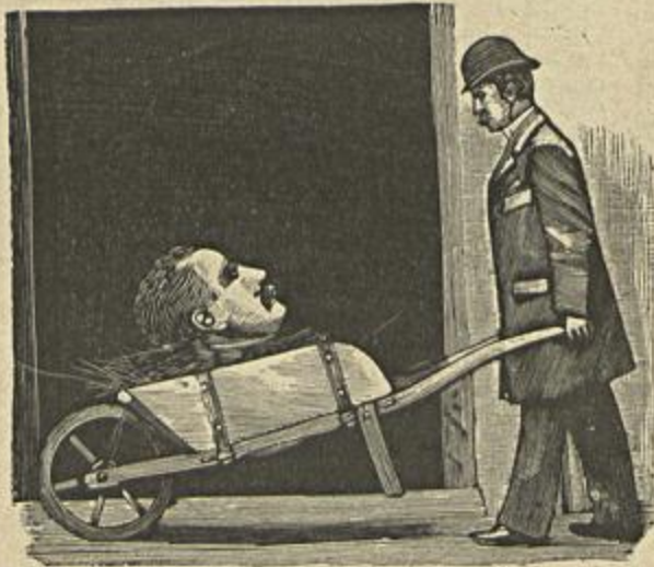
LEVANDO A PROPRIA CABEÇA EM UM CARRINHO DE MÃO