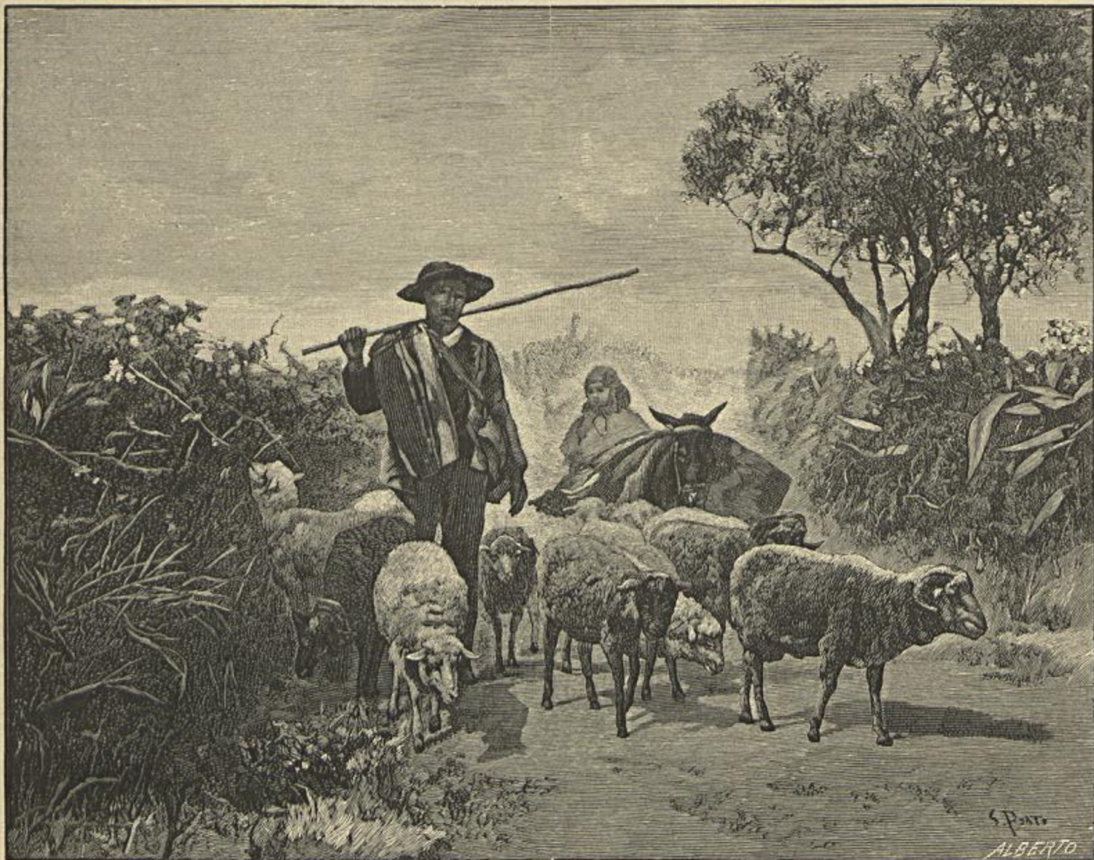
CONDUZINDO O REBANHO — QUADRO DE SILVA PORTO