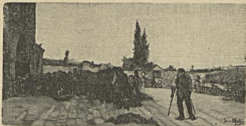
A' MISSA DAS SEIS — QUADRO DE MALHÔA

Alguns cem metros depois vem a estação de Benespera, passada a qual a linha teve que ven-