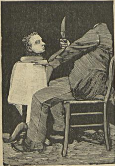
A PROPRIA CABEÇA EM UM PRATO