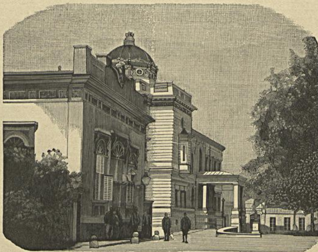
PALACIO REAL DE BELGRADO

ONDE O REI ALEXANDRE I PUBLICOU O GOLPE DE ESTADO PRENDENDO OS REGENTES