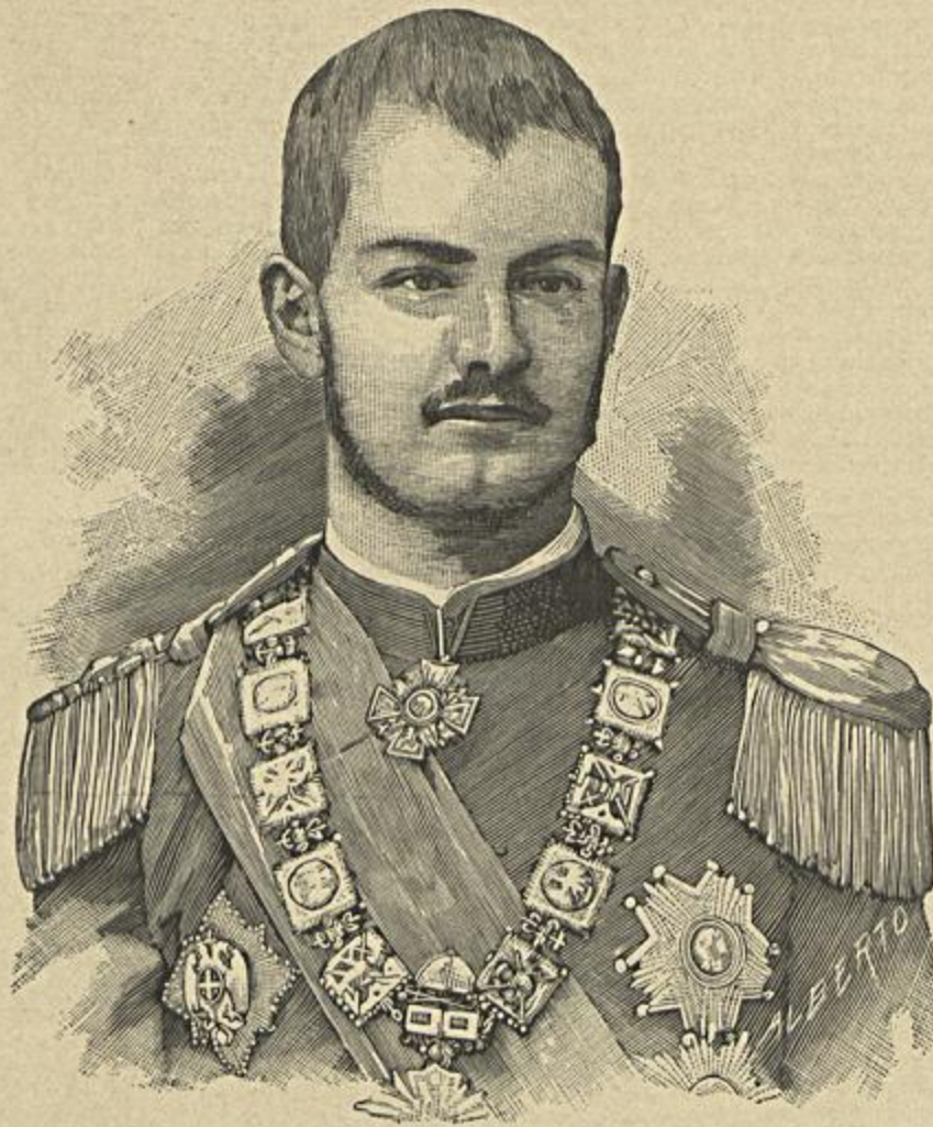
S. M. O REI ALEXANDRE I

A belleza do sitio, a que prestava majestade o caudaloso Rhodano, em cuja margem fica Beaucaire, a visinhança do rio da sua puericia, do formoso Gard, que mais tarde havia de comparar ao nosso Mondego, e que d'ali perto com o Rhodano conflue, os mysterios da solidão, os horisontes illimitados e brilhantes da mocidade (e quem os não tem por mais desambicioso que seja?), o mundo que se lhe ia gradualmente descobrindo atravez das suas illusões côr de rosa, os cabedades scientificos de dia e de noite enthesourados, pois os dias e as noites dispendia em adquiril-os, tudo lhe tornou