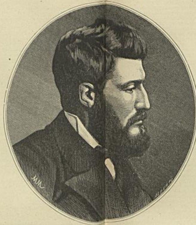
JOAQUIM PEDRO OLIVEIRA MARTINS Ministro da Fazenda