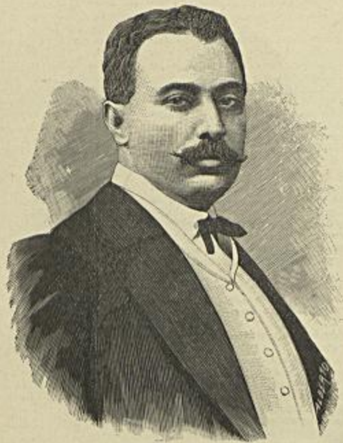
DR. ANTONIO DE SOUZA SILVA COSTA LOBO Ministro dos Negocios Estrangeiros