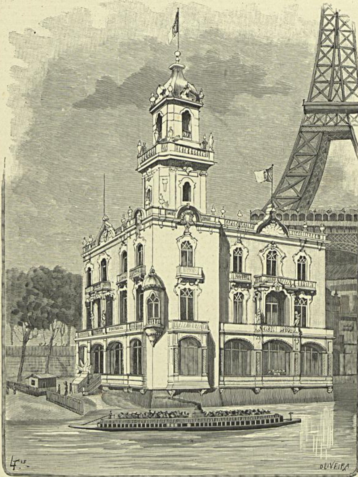
O PAVILHÃO PORTUGUEZ NO CAES DE ORSAY - Vid. artigo Exposição Universal de Paris de 1889, pag. 202