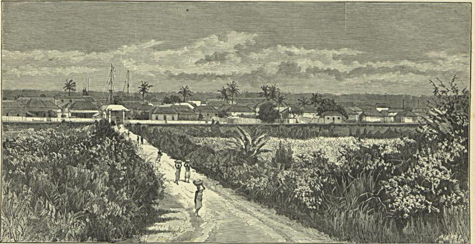
UMA VISTA DE LOURENÇO MARQUES — PLANTAÇÕES (Segundo photographia)