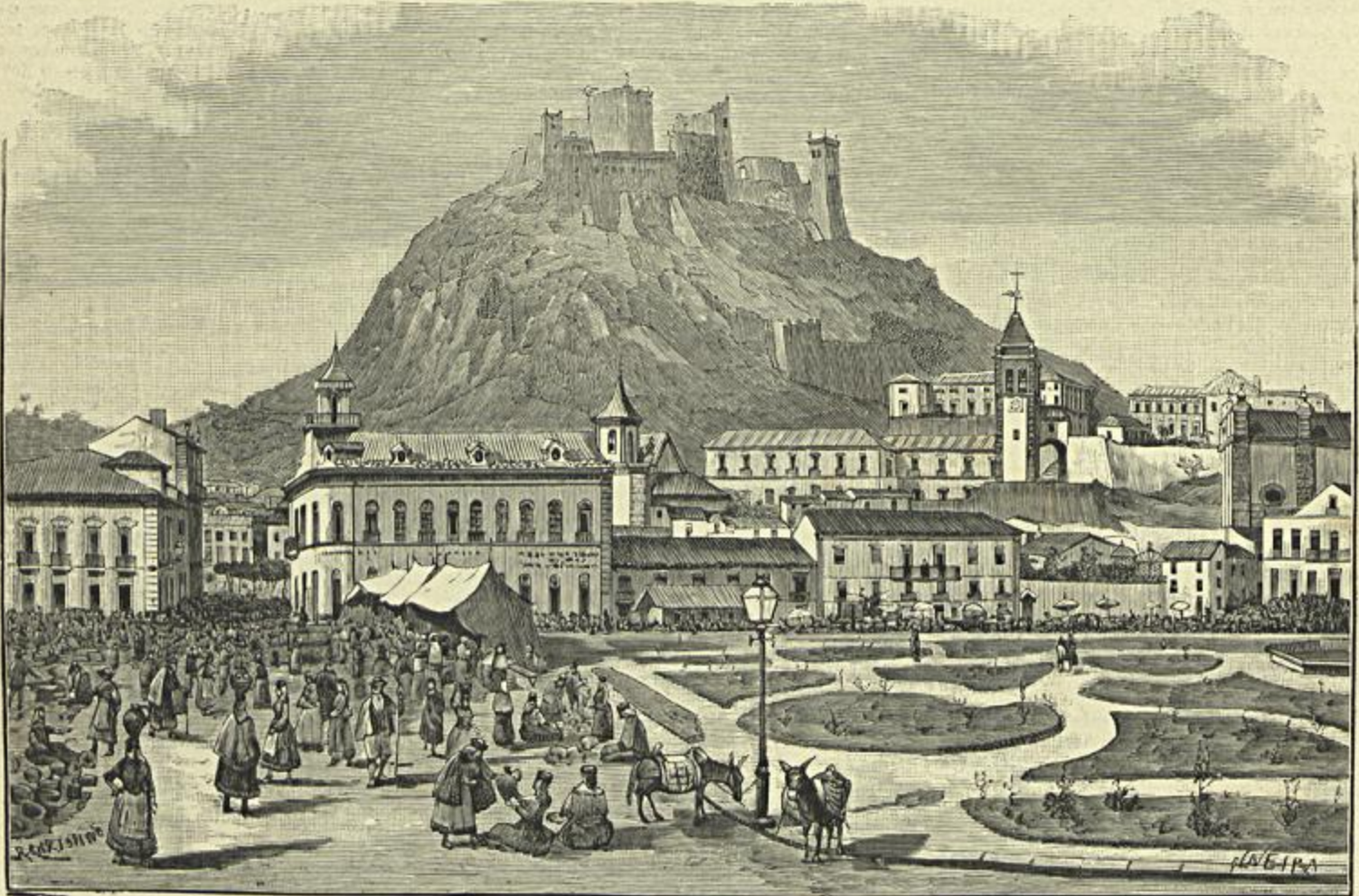
UMA VISTA DE LEIRIA — O MERCADO NO CAMPO DE D. LUIZ I