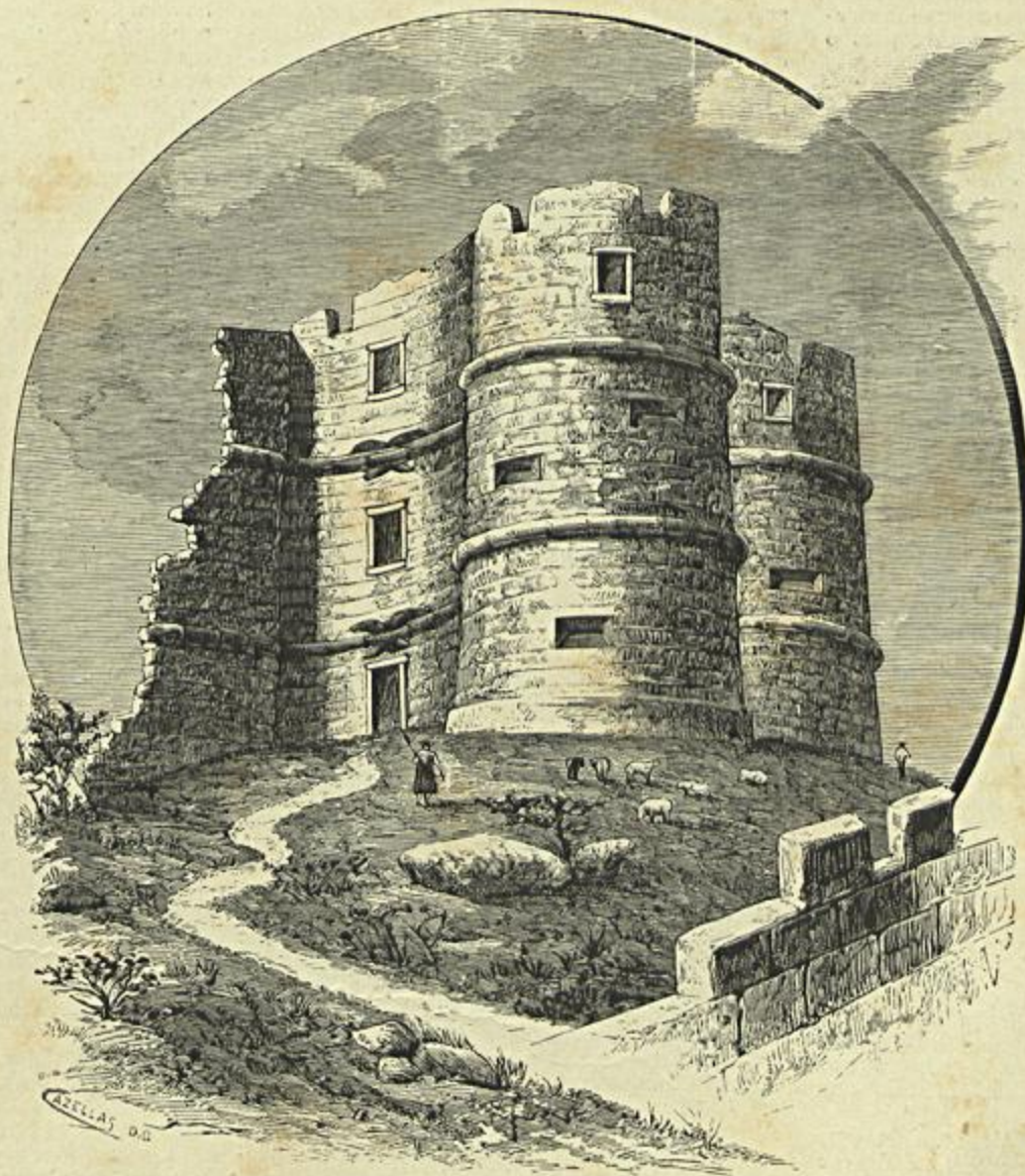
O CASTELLO DE EVORA-MONTE

O Gato Preto está longe de ser uma boa magica: o seu enredo é calcado sobre os enredos velhos e estafados das magicas antigas: dos seus personagens não ha um sequer que tenha novidade ou origina-