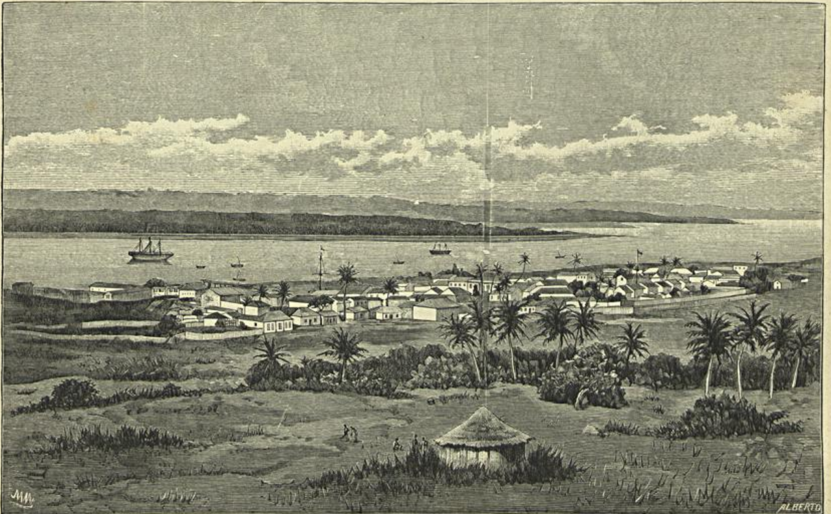
A BAHIA DE LOURENÇO MARQUES (Segundo photographia)