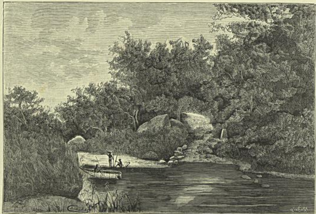
UMA PAISAGEM NO VALLE DE BIBALLA