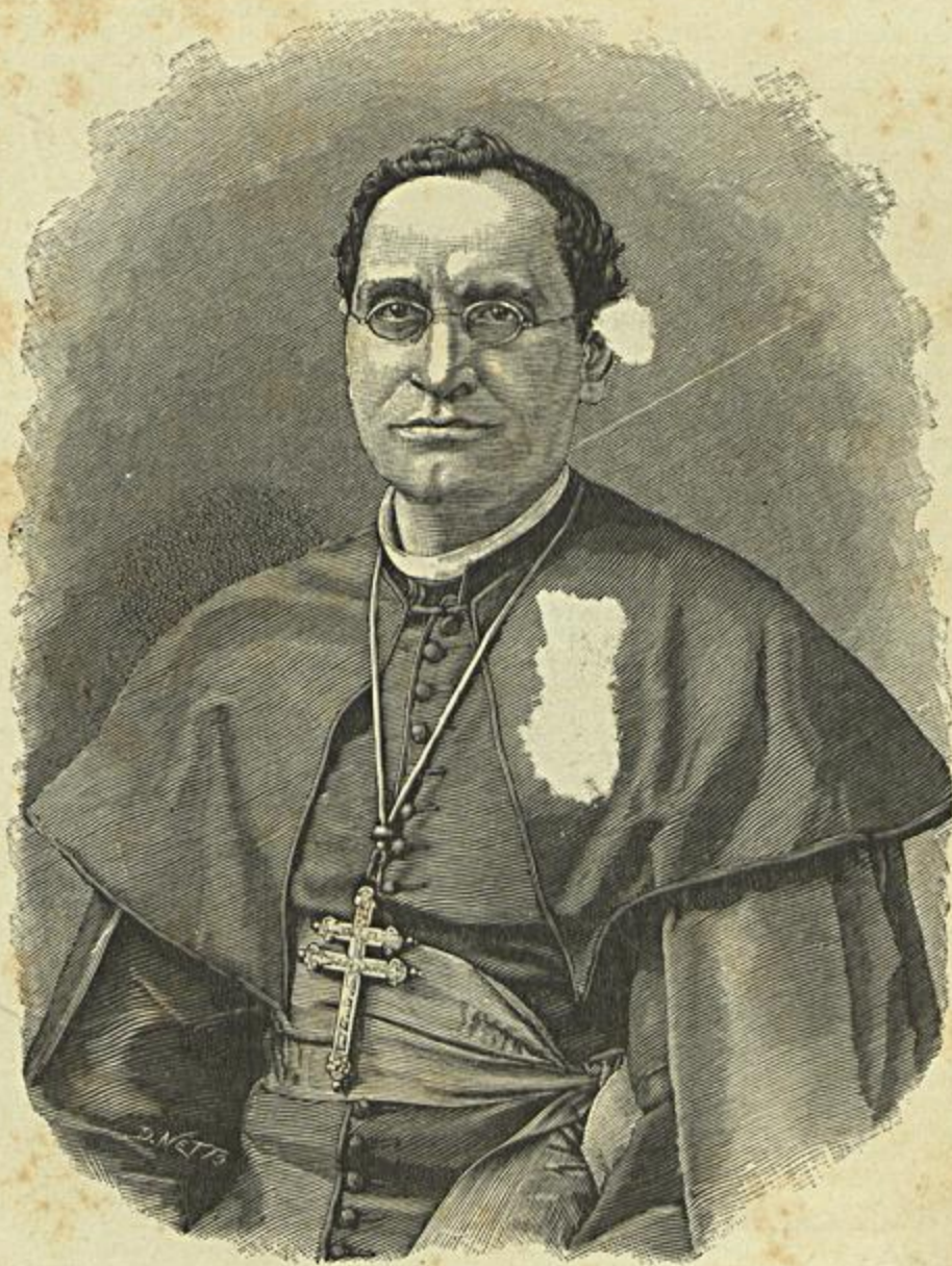
SUA EMINENCIA O CARDEAL PATRIARCHA DE LISBOA D. JOSÉ III

Querem ter o direito de festejar publicamente os seus heroes, mas querem que os outros festejem os seus á porta fe-