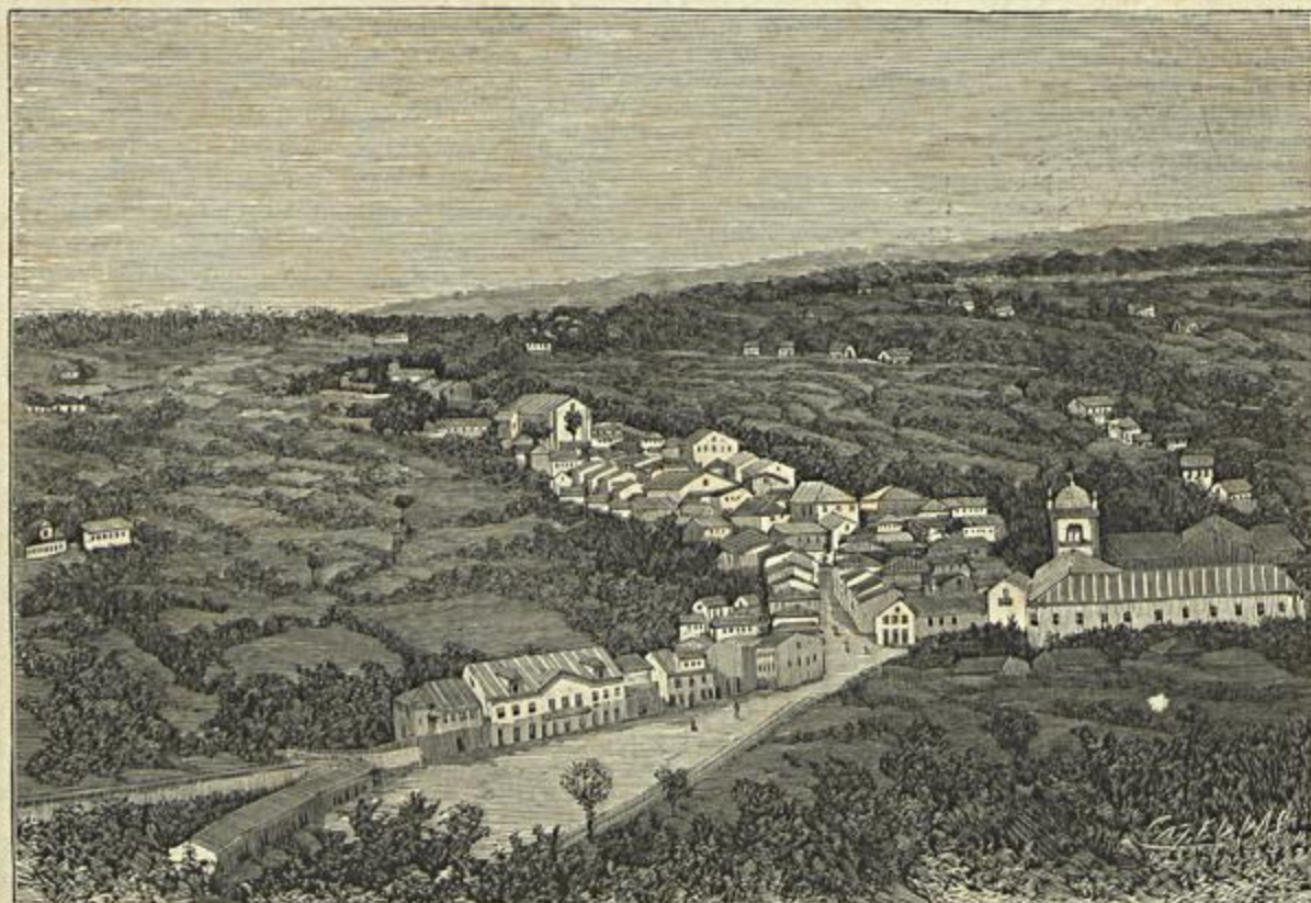
VILLA DA FEIRA

Almanach Illustrado das Horas Romanticas. David Corazzi, editor, Lisboa. Decimo sexto anno de publicação d'este interessante livrinho já muito conhecido do nosso publico para que seja preciso recommendal-o.