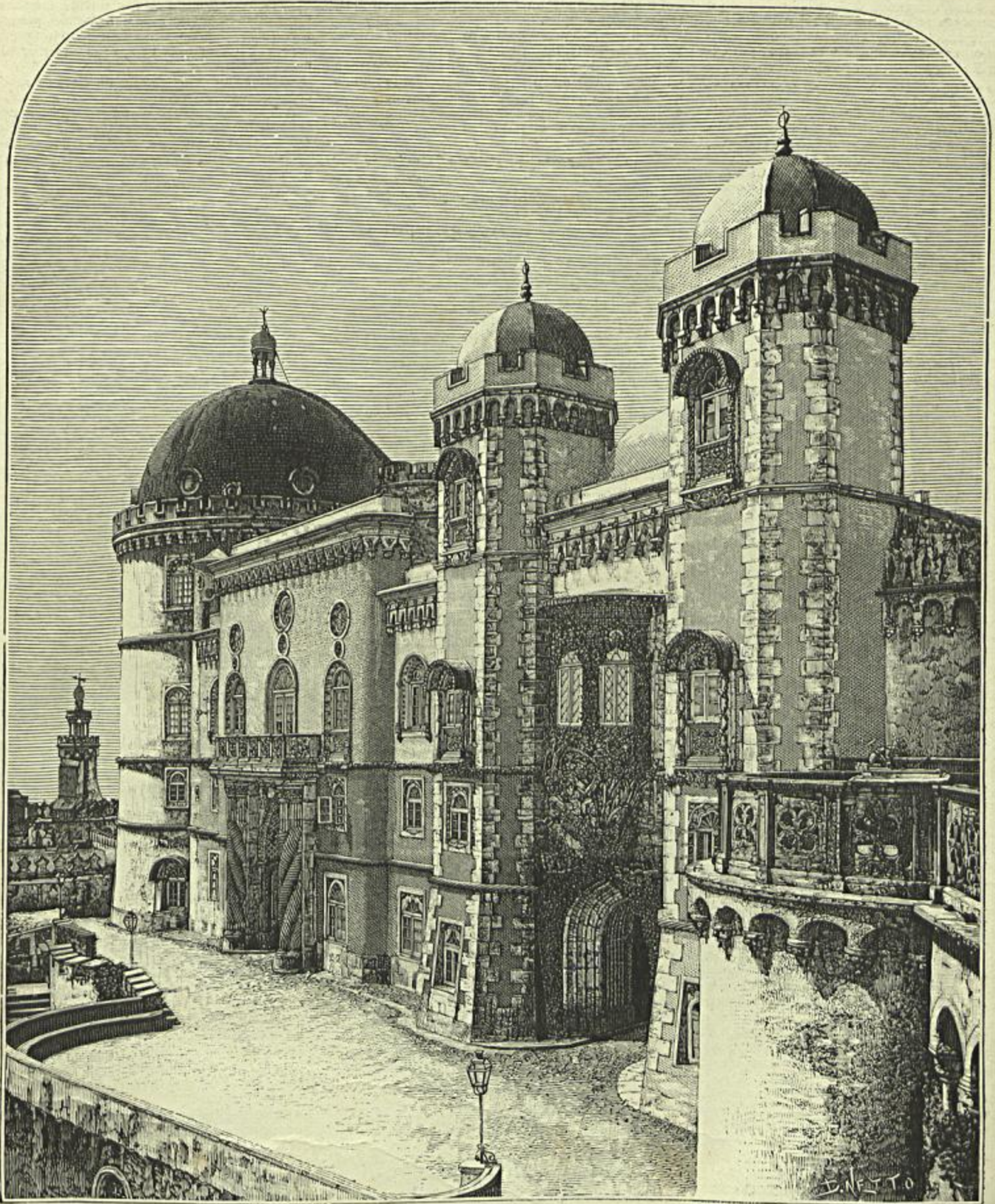
PALACIO DA PENA, EM CINTRA

(Segundo uma photographia do photographo amator sr. Carlos Relvas)