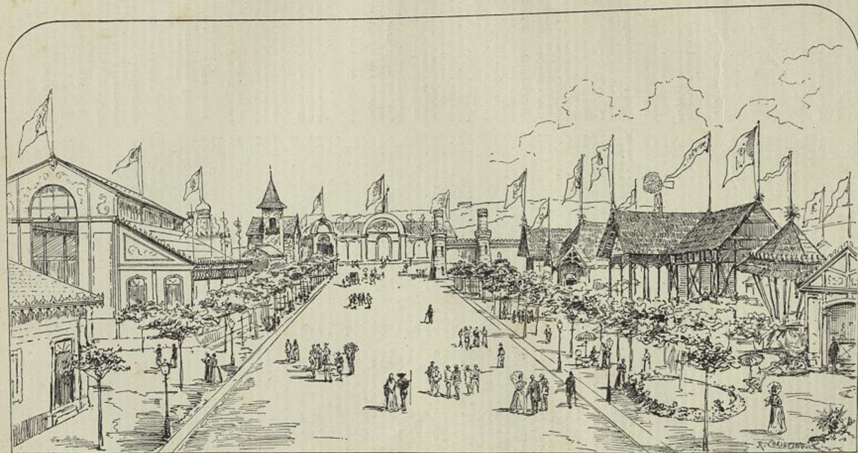
VISTA GERAL DOS ANNEXOS OU INSTALAÇÕES PARTICULARES DA EXPOSIÇÃO

(Desenho do natural por J. R. Christino)