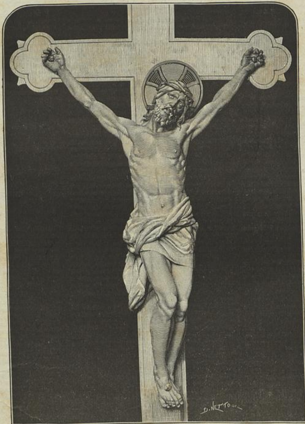
CHRISTO CRUCIFICADO QUE SE ERGUE NO ALTAR DA CAPELLA TUMULAR DE ALEXANDRE HERCULANO ESCULPTURA DE SIMÕES D'ALMEIDA (Segundo photographia)