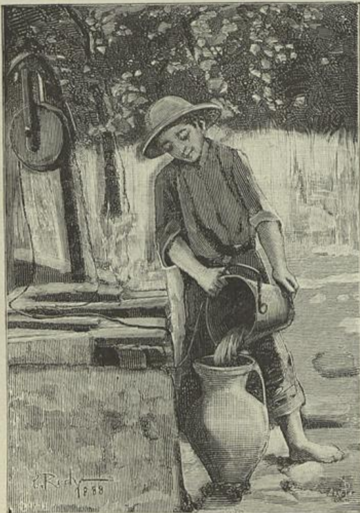
FAINA DO CAMPO—QUADRO DE CUSTODIO ROCHA