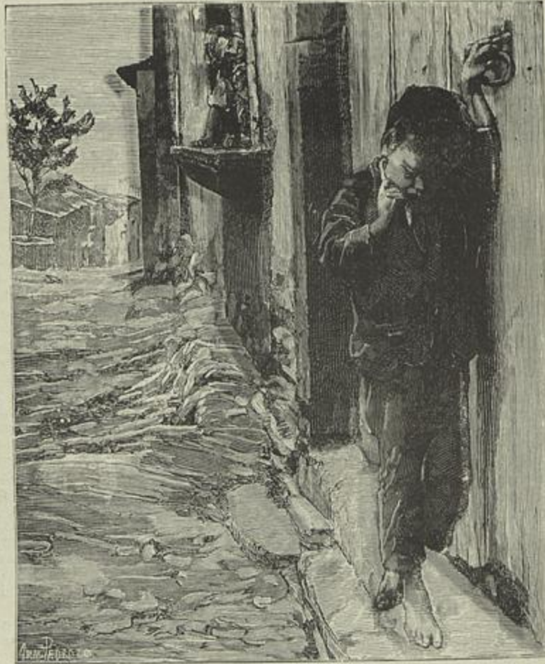
CHEGADO TARDE—QUADRO DE SOUSA PINTO