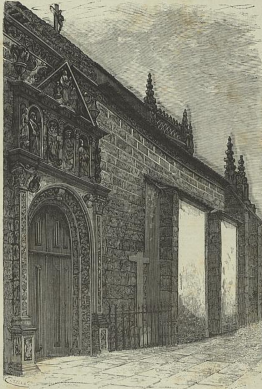
EGREJA MATRIZ DE CAMINHA—PORTA LATERAL

principaes engenheiros portuguezes. Director, L. de Mendonça e Costa, Lisboa, n.º 6 do 1.º anno d'esta publicação, unica no seu genero que vê a luz em Portugal, o que importa encarecer a sua utilidade, que a tem incontestavel. O summario d'este numero é o seguinte: Exploração dos caminhos de ferro pelo Estado e pelas companhias, por João Candido de Moraes; O congresso agricola e as tarifas dos caminhos de ferro; Parecer da commissão nomeada para examinar a ponte sobre o Tejo; Tarifas dos caminhos de ferro; Linha urbana de Lisboa; Caminhos de ferro de Traz-os-Montes; Caminhos de ferro asiaticos; Companhia dos caminhos de ferro portuguezes da Beira Alta; Relatorio apresentado pelo conselho de administração á assemblea geral ordinaria em Lisboa, 21 de abril de 1888, etc.