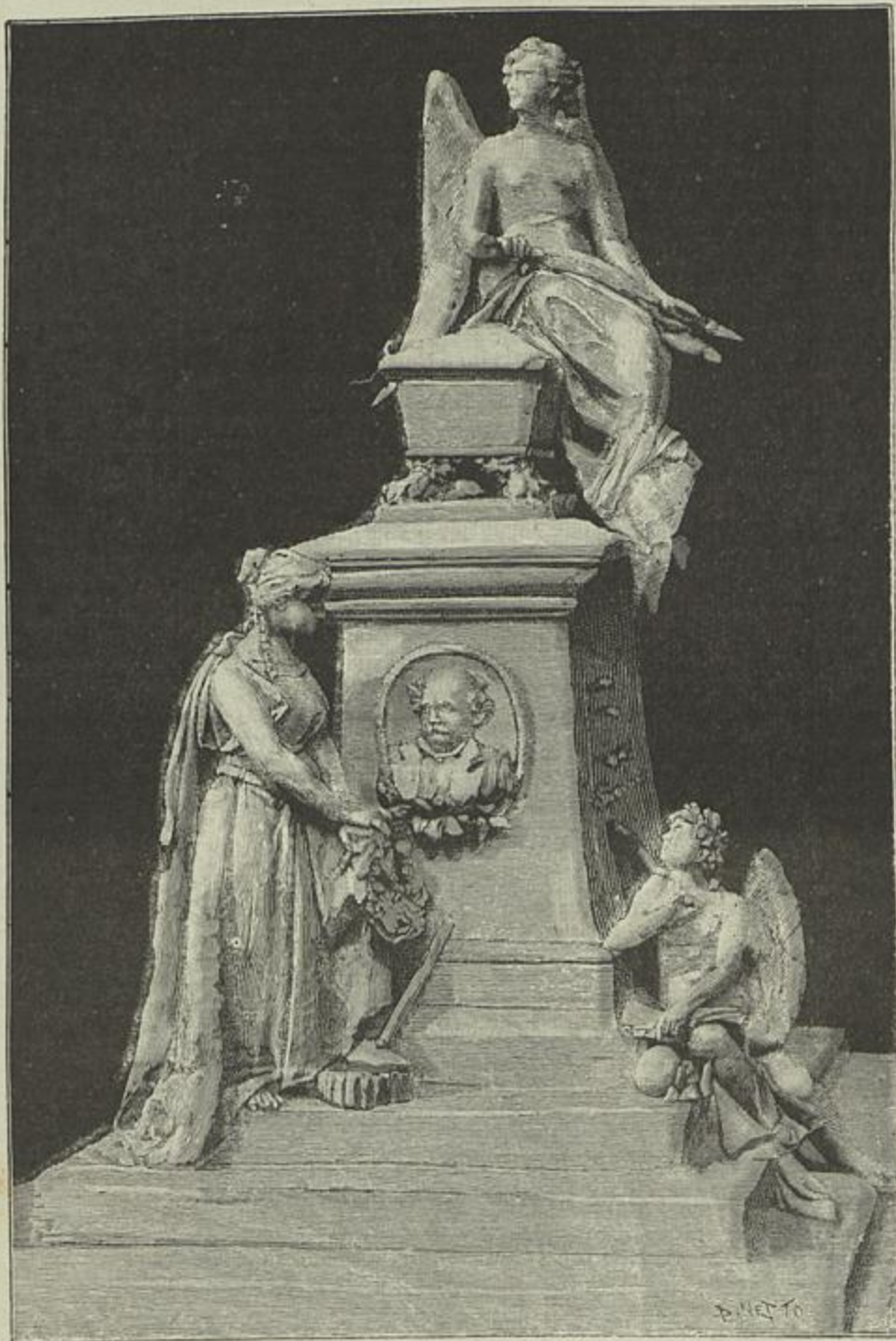
PROJECTO DE MONUMENTO FUNERARIO A ANTONIO AUGUSTO DE AGUIAR