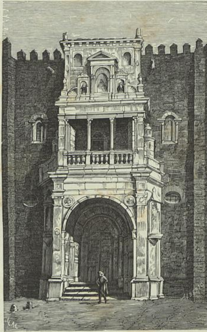
A SÉ VELHA DE COIMBRA (Segundo uma photographia)