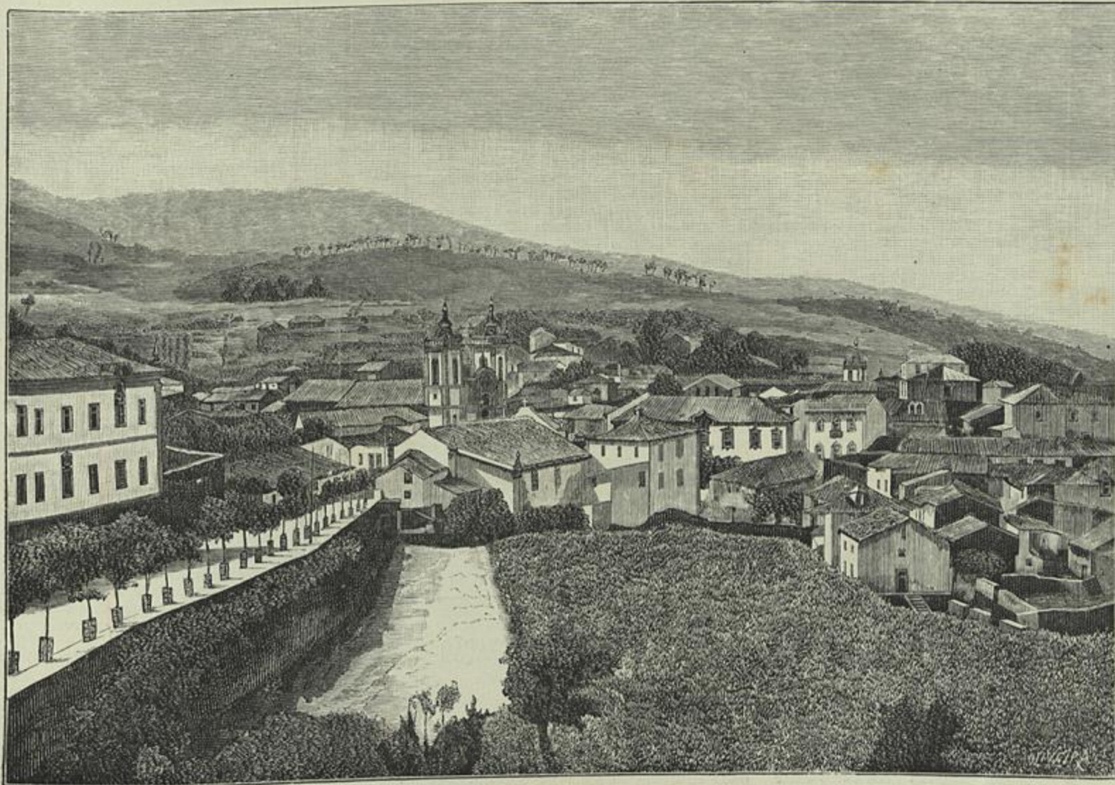
UMA VISTA DE GOUVEIA (Segundo uma photographia de Rocha)

A situação em que entrava no poder no dia 13 de setembro de 1871 o ministerio presidido por Fontes Pereira de Mello era verdadeiramente difficil e tormentosa. O ministerio Avila apresen-