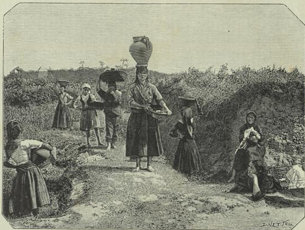
EM ESPINHO—COSTUMES