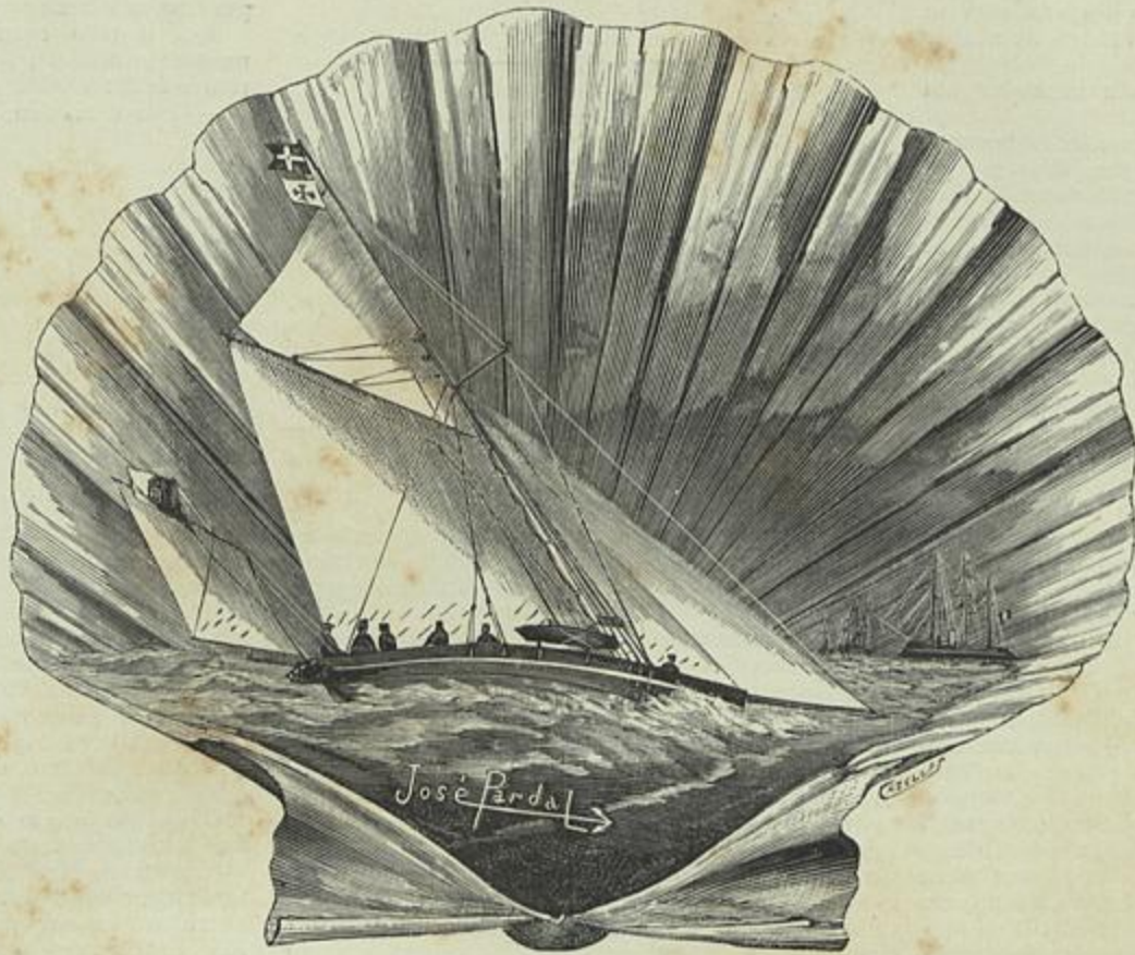
O YACHT DE RECREIO «AURA» PERTENCENTE A S. A. O SR. INFANTE D. AFFONSO