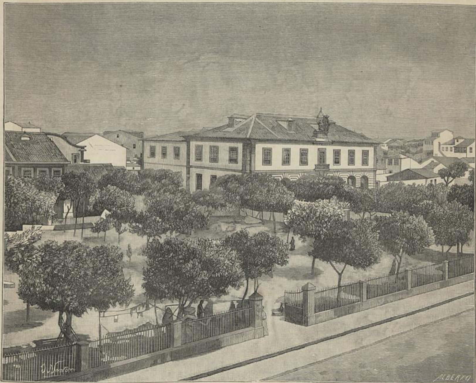
POVOA DE VARZIM — PRAÇA DO ALMADA E PAÇOS DO CONCELHO — (Segundo uma photographia de Fritz)

Tem vinte e quatro teclas com dezeseis de sustentidos, comprehendendo perto de tres oitavas e meia do mi grave a sol sobre agudo, se nos bem recordamos.