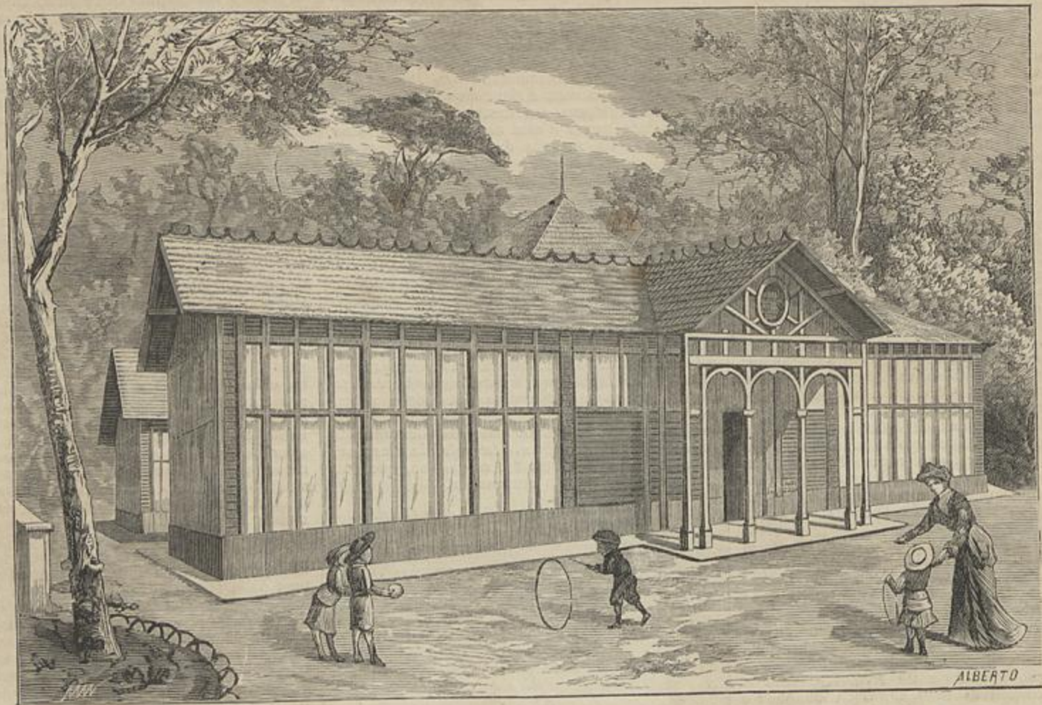
JARDIM D'INFANCIA, NO PASSEIO DA ESTRELLA EM LISBOA — INAUGURADO NO DIA 4 DE DEZEMBRO DE 1882