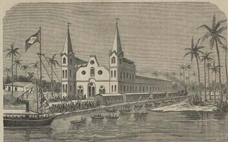
ESTAÇÃO DA ESTRADA DE FERRO BAHIA E MINAS, EM CARAVELLAS