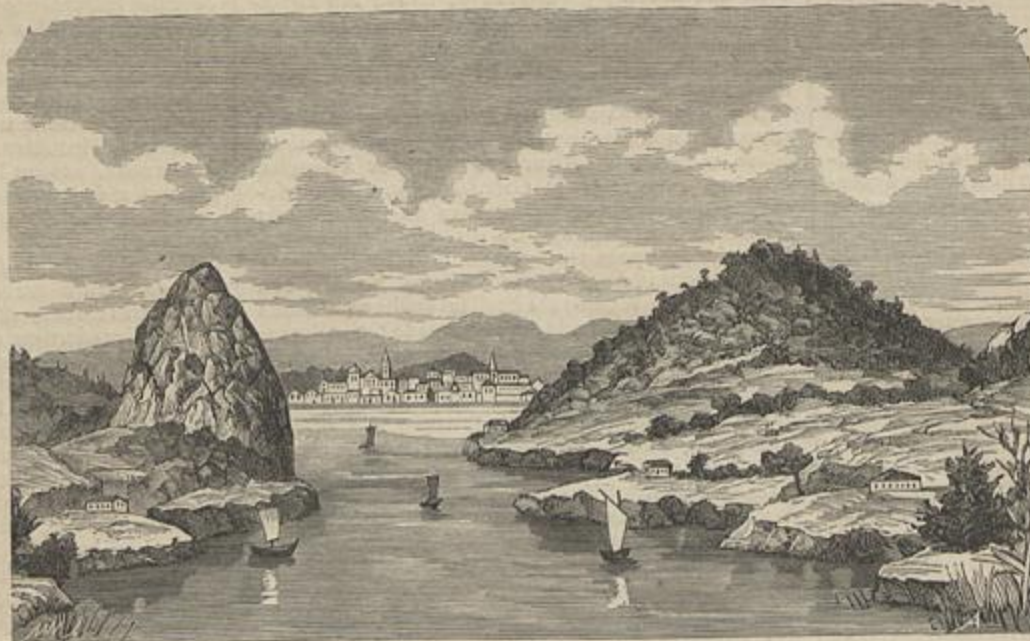
BRAZIL — CIDADE DA VICTORIA — Vid. artigo Carta de Antonio Lopes Mendes, etc. (Segundo desenho de Lopes Mendes)

1882, LALLEMANT FRÈRES, TYP. LISBOA 6, Rua do Thezouro Velho, 6