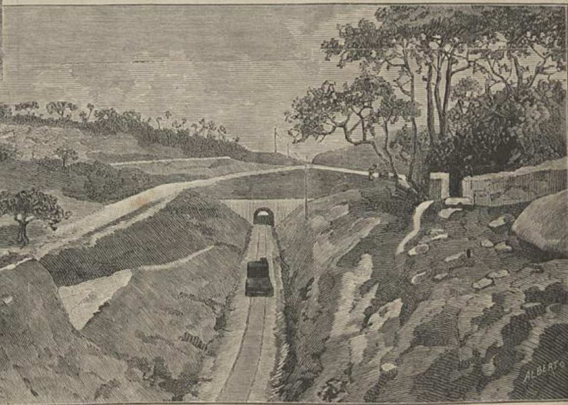
CAMINHOS DE FERRO PORTUGUEZES — TUNNEL DA ABRUNHOSA — ESTAÇÃO DE CELORICO — TUNNEL DE MOURILLO, NO CAMINHO DE FERRO DA BEIRA ALTA

(Segundo photographias de Biel) — Vid. artigo Caminho de Ferro da Beira no vol. v