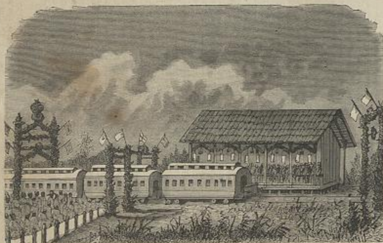
ESTAÇÃO DE PERUIPE