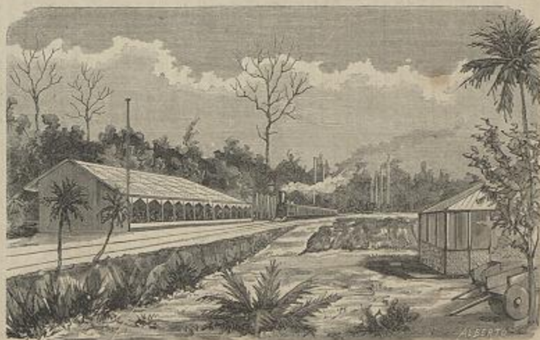
ESTAÇÃO PROVISÓRIA DOS AYMORÉS

BRAZIL.—INAUGURAÇÃO DA ESTRADA DE FERRO BAHIA E MINAS.—Vide artigo, Carta de Antonio Lopes Mendes, etc. — (Segundo desenhos de Lopes Mendes)