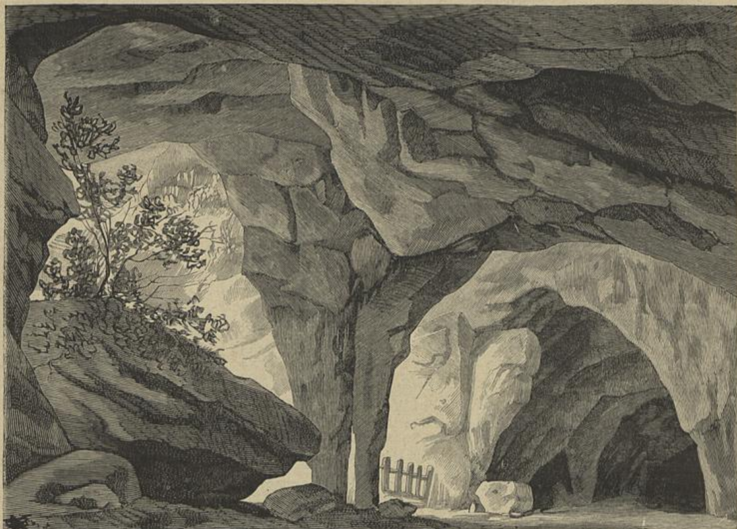
UM PROJECTO DE SCENA DE THEATRO POR JOSÉ CINATTI — Segundo uma aguarela do mesmo auctor.