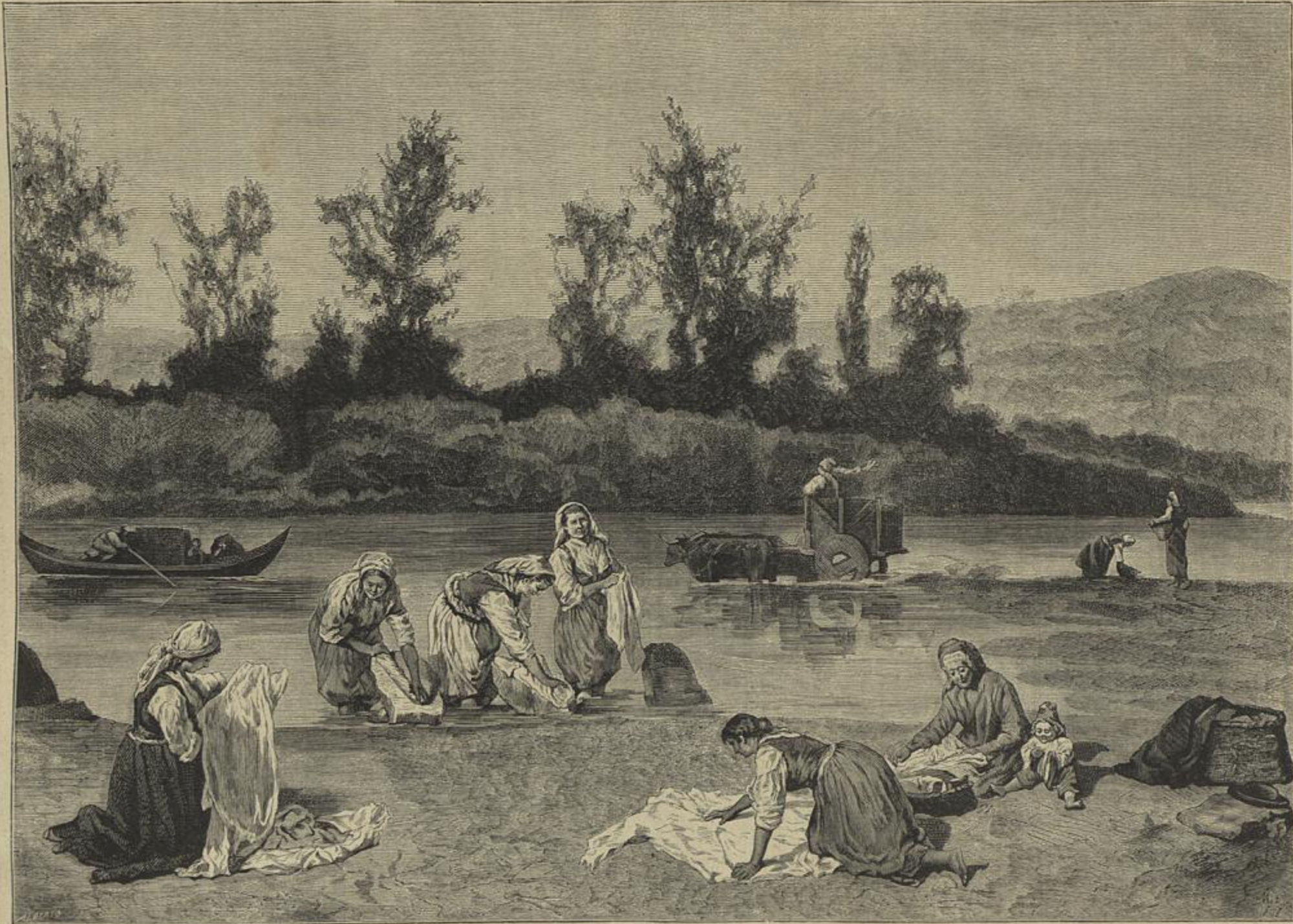
LAVADEIRAS NO MONDEGO, Quadro de Lupi professor da Academia de Bellas-Artes de Lisboa, premiado e vendido na Exposição Universal de Paris em 1873