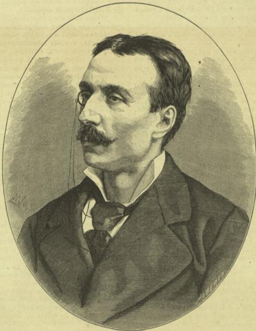
EÇA DE QUEIROZ (Auctor do novo romance — O primo Basilio) (Segundo uma photographia)

A sala dos cisnes, de que hoje publicamos a gravura, se não tem