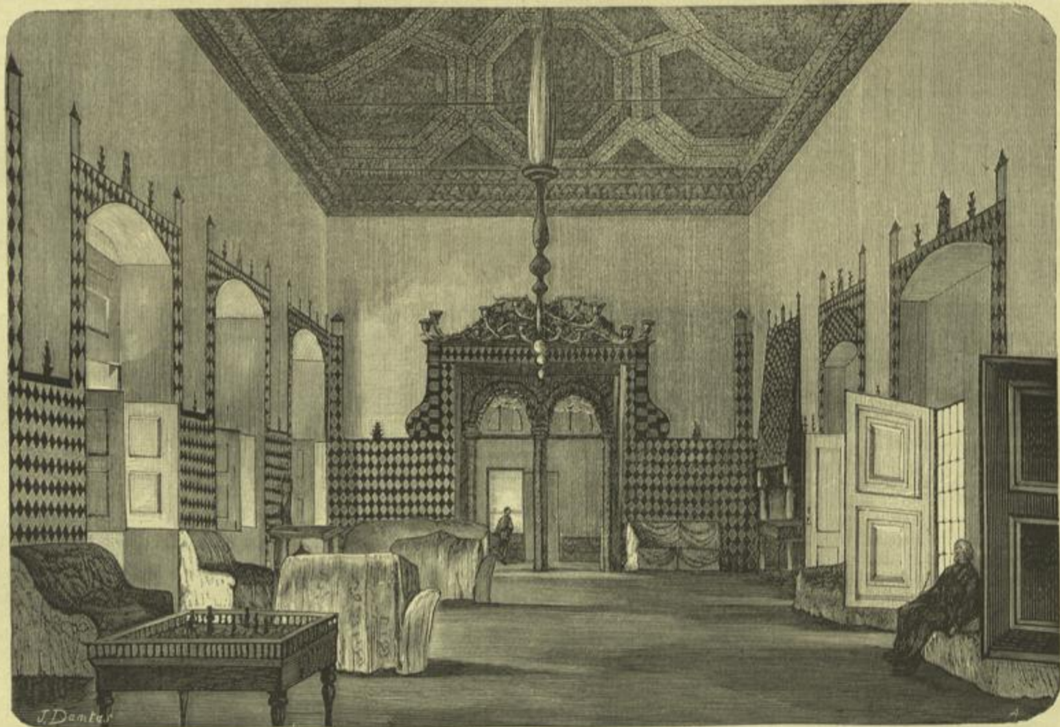
SALA DOS CISNES NO PALACIO REAL DE CINTRA (Desenho do sr. J. Dantas, segundo uma photographia do sr. Marrão)

O palacio de Cintra, quanto se resinta da influencia do arabe em virtude da sua edificação ser amoldada ás ruinas sobre que foi levantado, é ainda assim um dos raros typos de construcção civil do periodo ogival, existentes no nosso paiz, se attendermos a que de ordinario o gothico predomina quasi sempre nos monumentos religiosos levantados pela piedade dos reis,