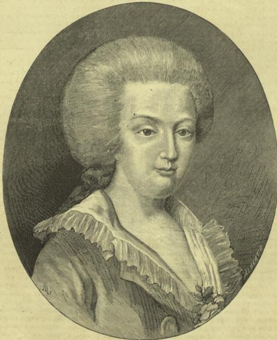
A PRINCEZA D. MARIA FRANCISCA BENEDICTA