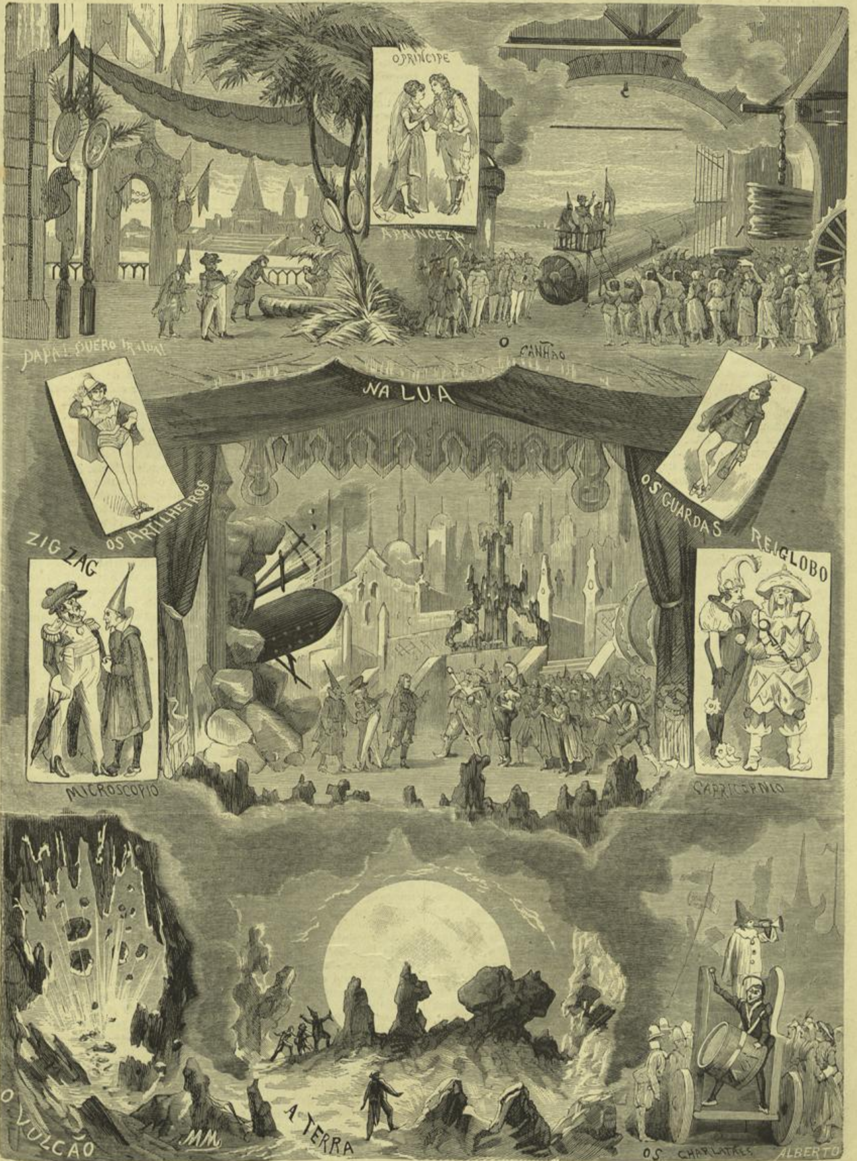
A VIAGEM À LUA, OPERETA PHANTASTICA — Tradução de Eduardo Garrido — Musica de Offenbach (Desenho de M. de Macedo)