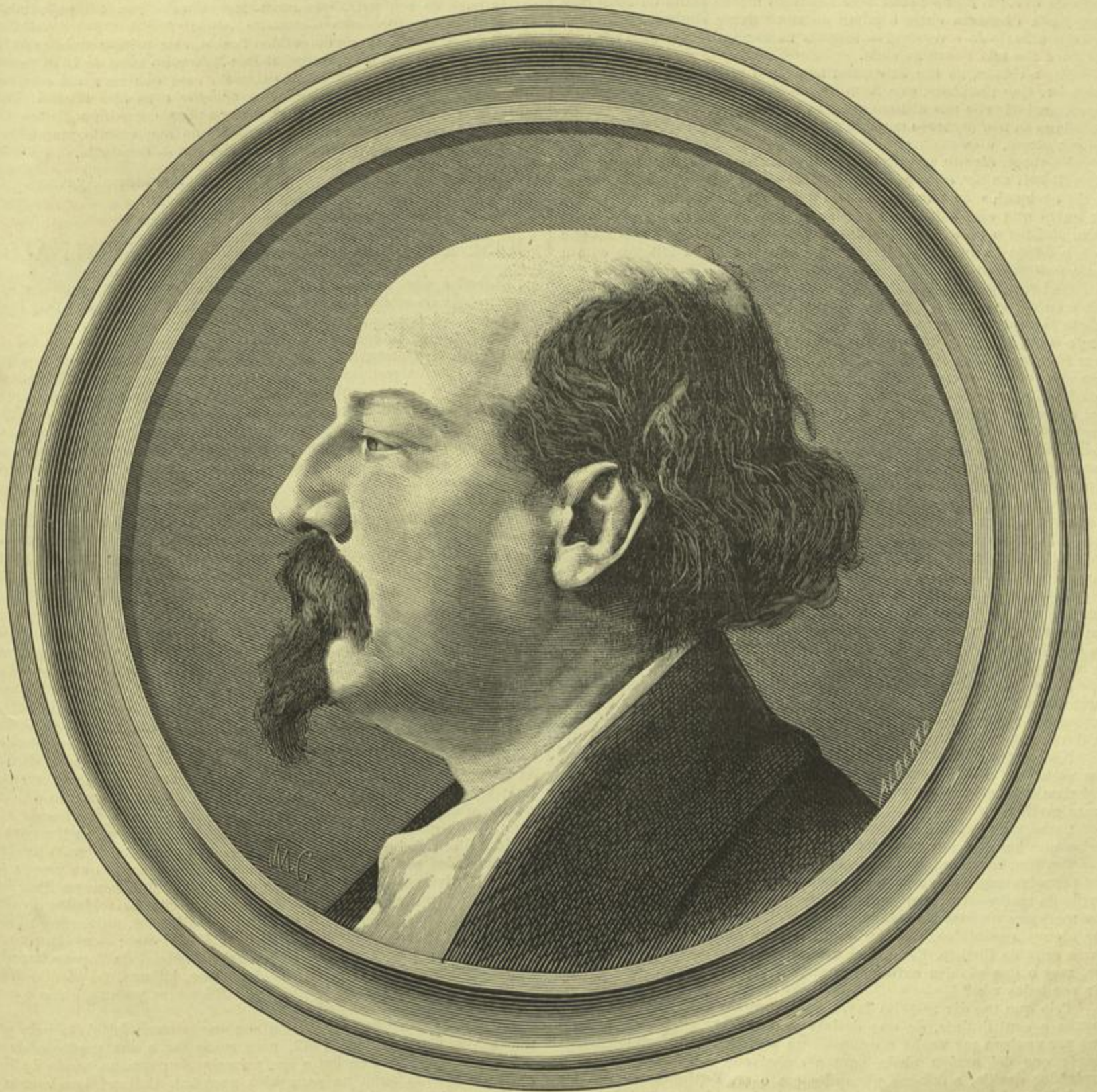
JOSÉ ESTEVÃO COELHO DE MAGALHÃES (Segundo uma photographia)