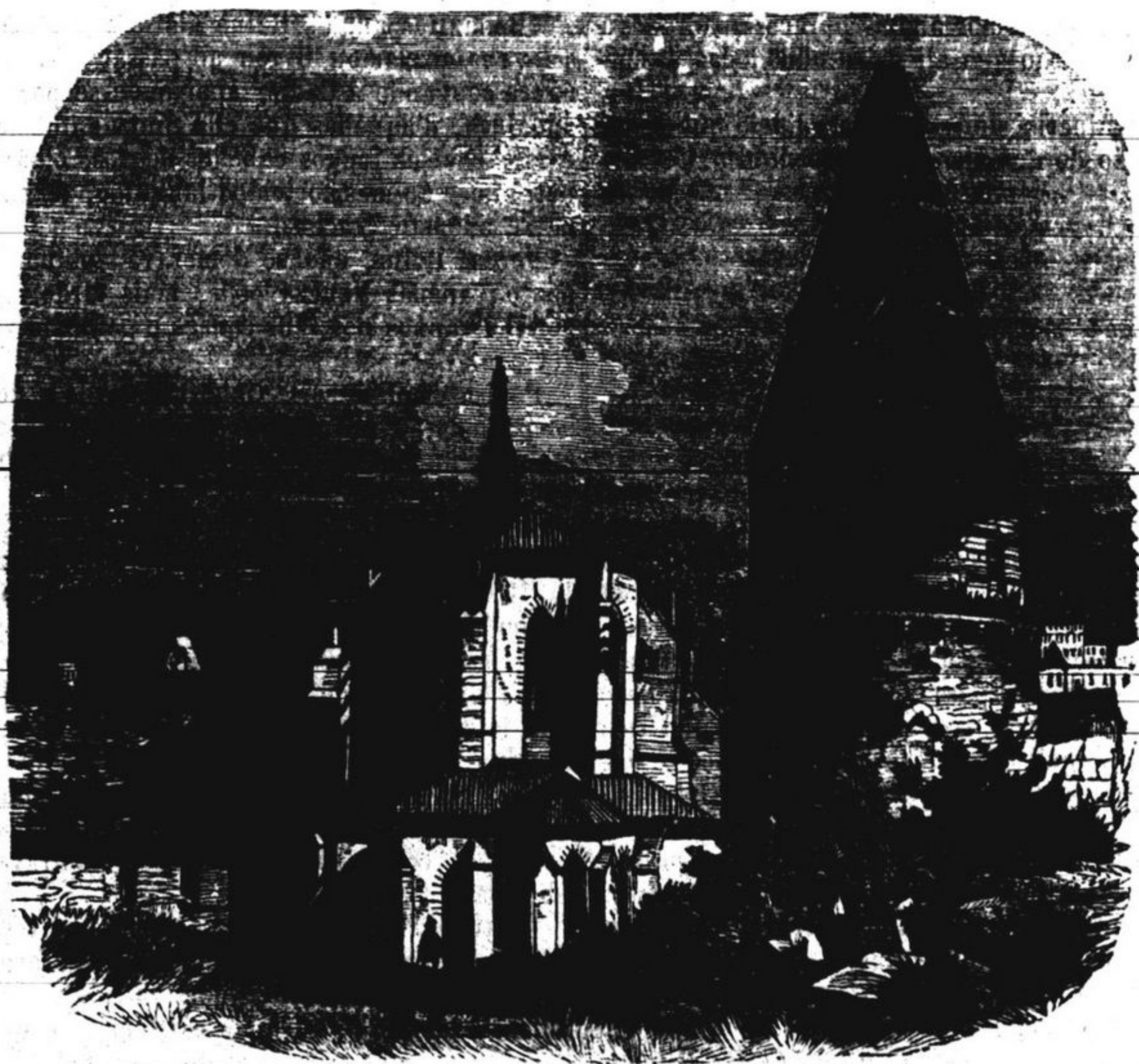
SARLAT — LANTERNA DOS MORTOS.

No departamento de Dordogne, está Sarlat, cidade pequena e cabeça de uma comarca que por muitos é chamada o Perigord negro, formando parte do departamento o antigo Perigord. É situada n'um valle sombrio e fundo, rodeado de montanhas cobertas de castanheiros; deve a sua fundação a uma antiga abbadia de beneditinos que o papa João XXII erigiu em bispado, hoje transferido para Perigueux, capital de toda a provincia. Talvez que esta circumstancia de ser sé episcopal fosse a causa de não a abandonarem os seus antigos habitantes, visto ser exposta a frequentes inundações e estar muito distante das estradas reaes e outras mais importantes vias de communição. Actualmente o commercio que n'ella se faz, e achar-se elevada a cabeça de cantão, conservam-lhe ainda sufficiente actividade. É triste, e as ruas tortuosas são todavia guarnecidas, pela maior parte, de elegantes casas do estylo, e sobretudo do tempo da chamada renascença; sendo as mais agradaveis as que pertencem á epoca dos reis Francisco I e Henrique II.