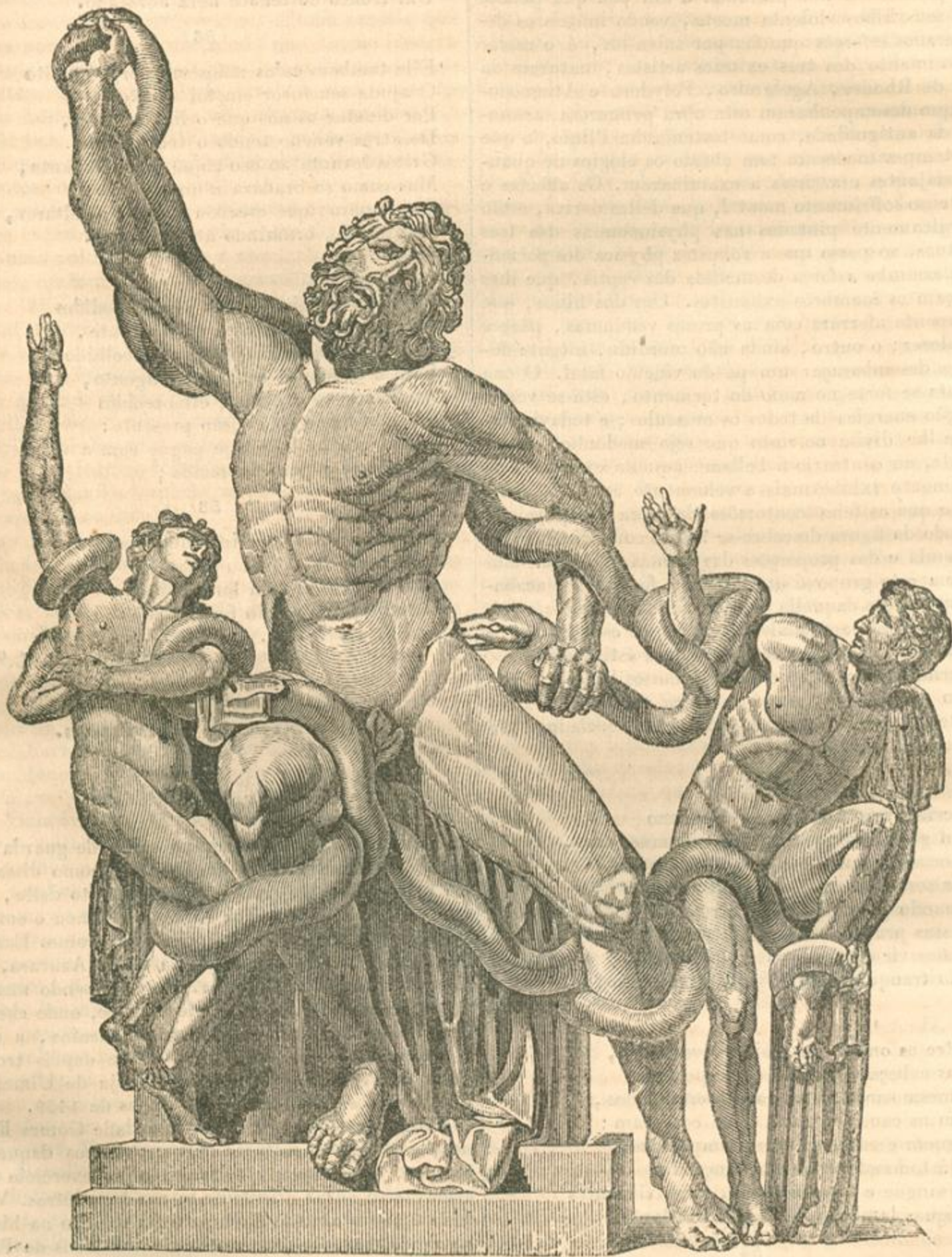
O GRUPO DE LAOCOONTE E SEUS FILHOS.

PUBLICADO TODOS OS SABBADOS. (AGOSTO 10, 1839)