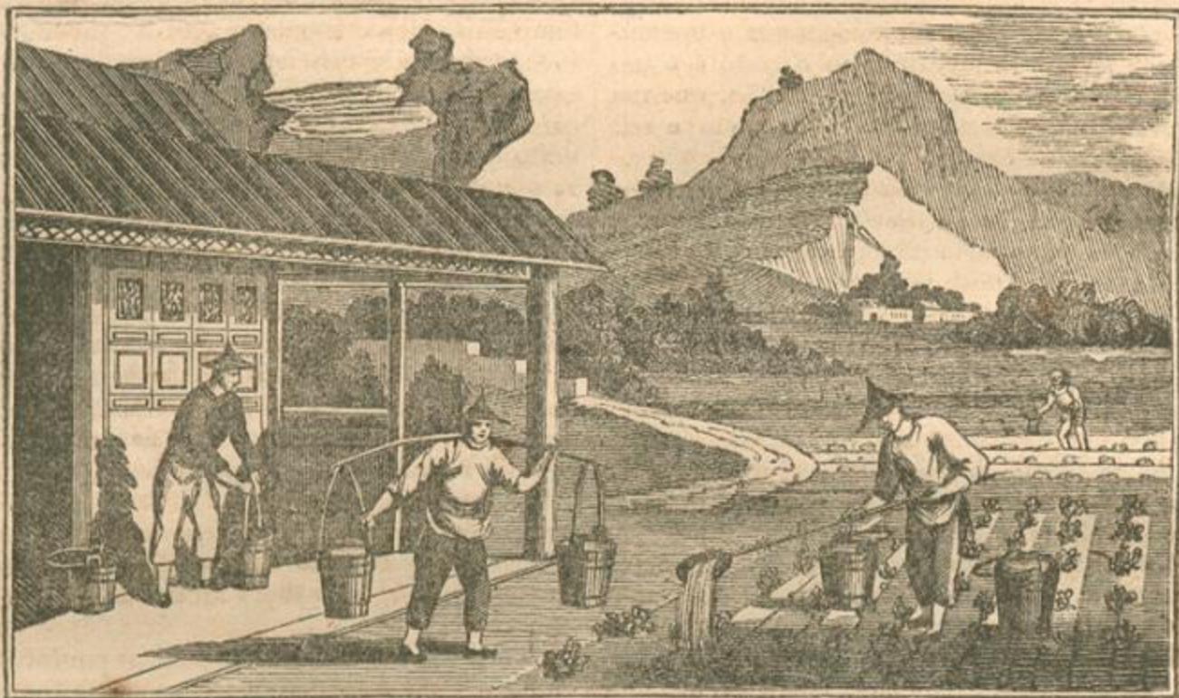
CULTURÁ DO CHA'.

50) PUBLICADO TODOS OS SABBADOS. (ABRIL 14, 1838