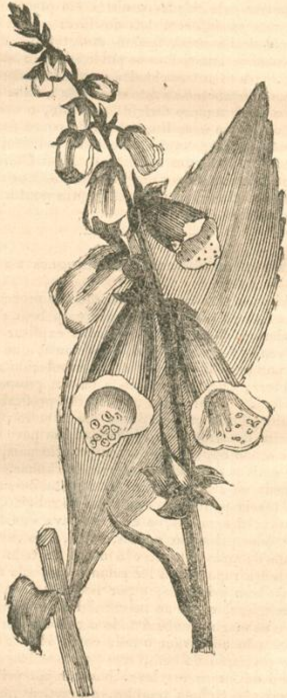
A DEDALEIRA, OU DIGITAL.

vez do propheta Daniel, ou de outro qualquer judeu captivo em Babylonia, ou em Suza. Os parsios da India nestes ultimos tempos patentearam consideravel empenho em adquirirem informações concernentes ás practicas, e noções religiosas de seus antepassados; a fim de os obter, colligindo livros, tradições, e outros documentos, mandaram á Persia, por vezes, pessoas intelligentes. Por este meio alcançaram, alguns annos ha, uma cópia do "Desatir", que foi impressa, junctamente com uma versão ingleza, em Bombaim, sob a protecção britannica. Este livro é summamente interessante; e apezar da remota antiguidade, que lhe attribuem, encerra em seu contexto evidentes próvas de ter sido escripto muito posteriormente á conquista da Persia pelos arabes.