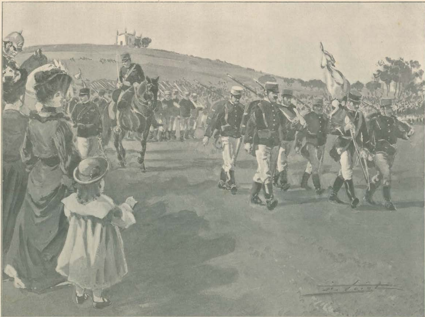
O EXERCÍCIO DA 2.ª BRIGADA DE INFANTARIA NO HIPPIDROMO—A PASSAGEM DA BANDEIRA LO REGIMENTO DE INFANTARIA 16