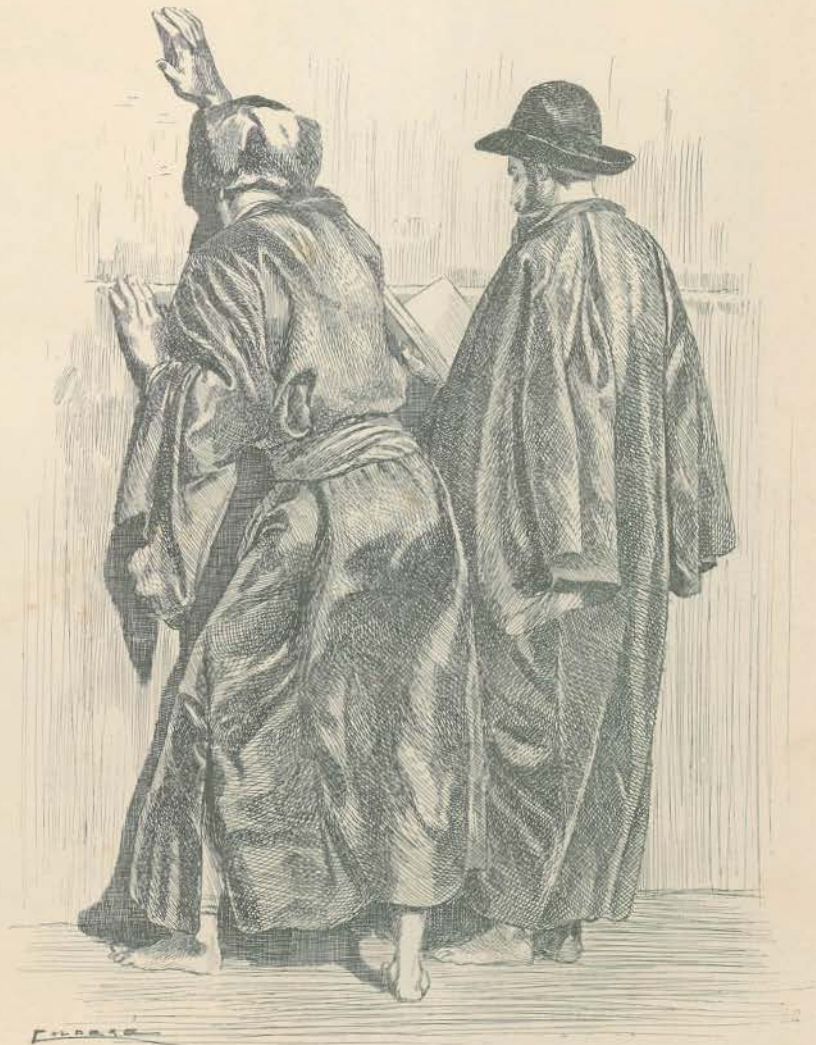
JUDEU EM ORAÇÃO