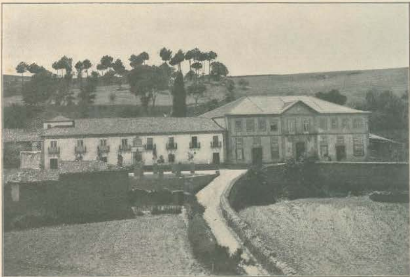
AVENIDA MARQUEZ DE SOVERAL, VISTA DO LADO DO NORTE A VIAGEM DO SR. MARQUEZ DE SOVERAL A S. JOÃO DA PESQUEIRA

A memoria d'aquelle prestigioso marinheiro que se chamou Ferreira d'Almeida e morreu em Livorno recebe agora uma homenagem que os filhos do Faro prestam aquelle que foi parlamentar distinto e official valoroso. Na casa onde nasceu em Faro, n'essa sua terra algarvia, de luz e de calor, vai ser collocada uma lapide que perpetuará a recordação do illustre official. Um grupo de amigos, com a sancção geral do povo da cidade, levou a cabo esse trabalho, essa homenagem justissima que ficará a lembrar o marinheiro cuja memoria foi e é venerada.