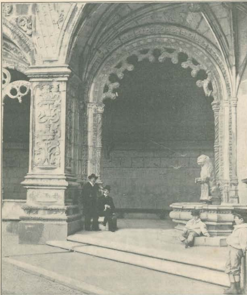
REAL CASA PIA DE LISBOA—UM TRECHO DO CLAUSTRO

mo uma mola de relógio que, ao voltar, se quebra, estala, parte.