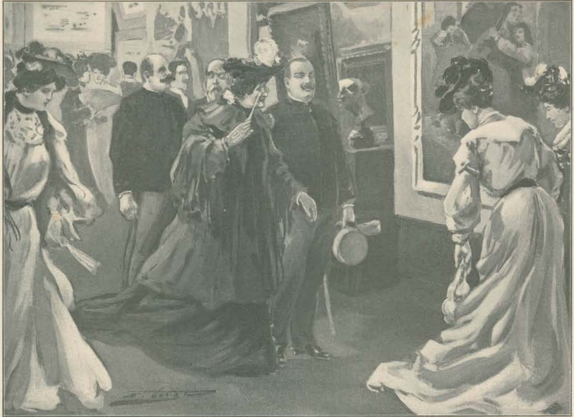
A ABERTURA DA EXPOSIÇÃO DAS BELLAS ARTES EM 10 DE MAIO—S. M. EL-REI SENHOR D. CARLOS E S. M. A RAINHA SENHORA D. MARIA PIA VISITANDO AS SALAS

Abria a exposição com alguns trabalhos dos nossos mais distintos pintores e d'alguns novos que appareceram. A Lisboa elegante e artistica encheu as salas da Academia das Bellas Artes e durante algumas horas passou em revista os trabalhos artisticos. S. M. el-rei foi, como soberano, inspecor e a exposição, para onde, como artista, enviou o seu bello quadro— Um arabe . Na luz suave da tarde os visitantes criticavam a mais vez, havia um rumor de vozes e um frum-frum de saias de ves-