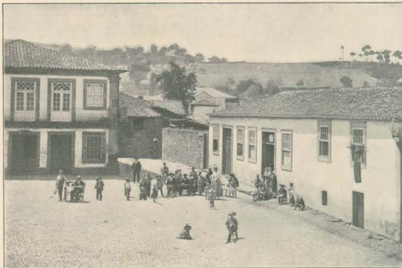
A PRAÇA DE SANTA MARIA