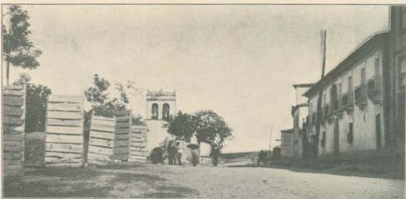
AVENIDA DO MARQUEZ DE SOVERAL, VISTA DO LADO DO NASCENTE