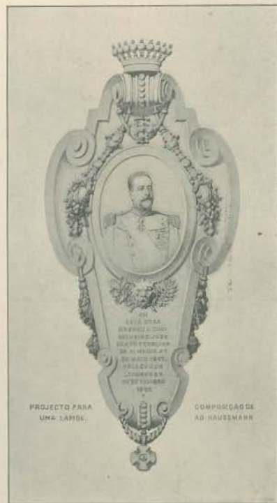
PROJECTO PARA UMA LAPIDE.