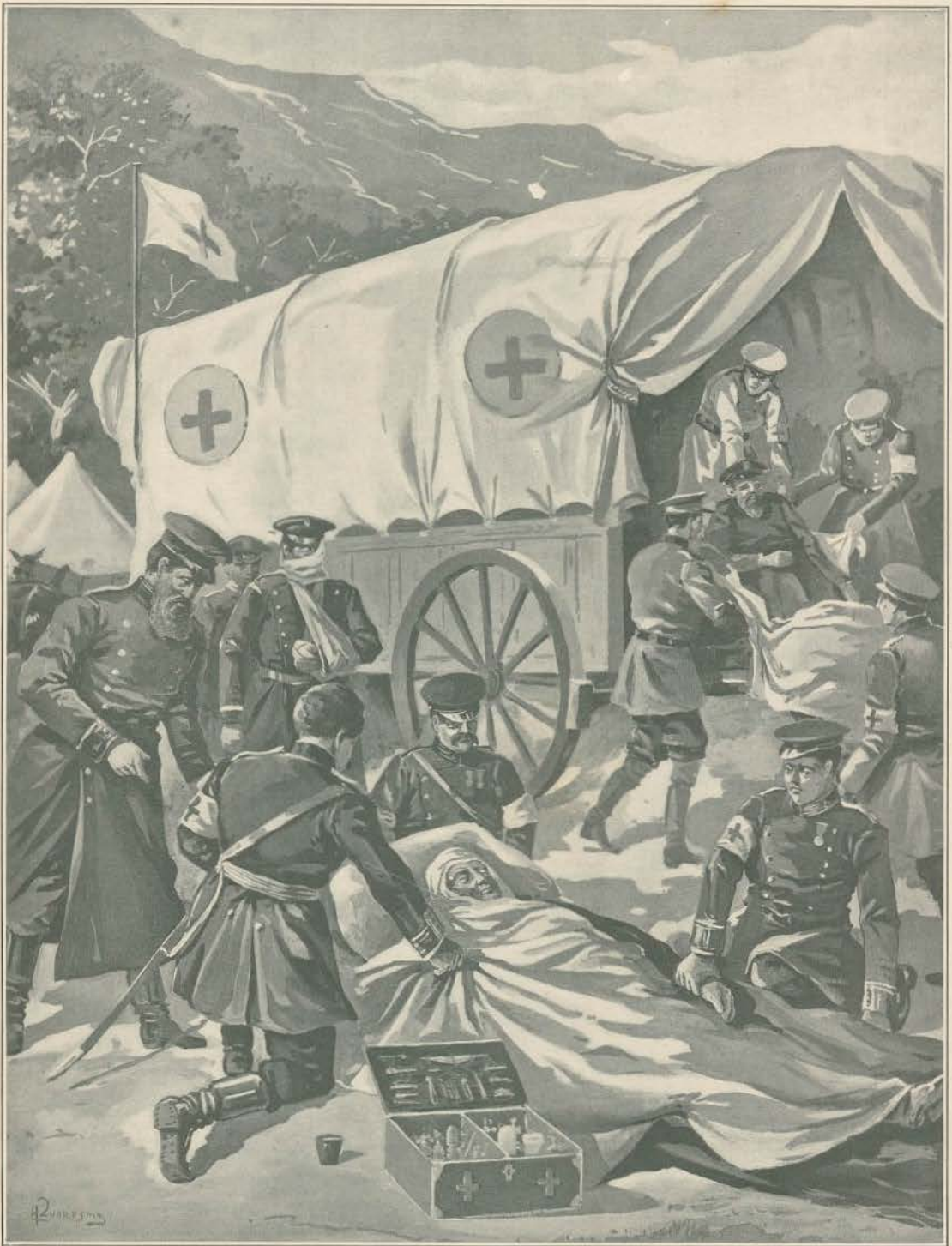
A GUERRA RUSSO-JAPONESA—UM POSTO DA CRUZ VERMELHA EM SEUL

A Cruz Vermelha é uma das mais belas instituições, toda de alívio e caridade, que tem suscitado e adepto pelo mundo inteiro. Dispõe de grande e quantias vitais de subsistência, de apólos a particulares, a magnífica obra tem prestado relevantes serviços nas guerras dos últimos tempos, coberto com a sua bandeira, insignia de piedade, aqueles que sofrem após os combates e que, mercê d'essa instituição, encontram mãos caridosas de boas enfermeiras, irmãs de caridade, irmãs e vigilantes que os cuidam e os socorros médicos precisos para as suas feridas, para os seus membros mutilados pelas balas inimigas.