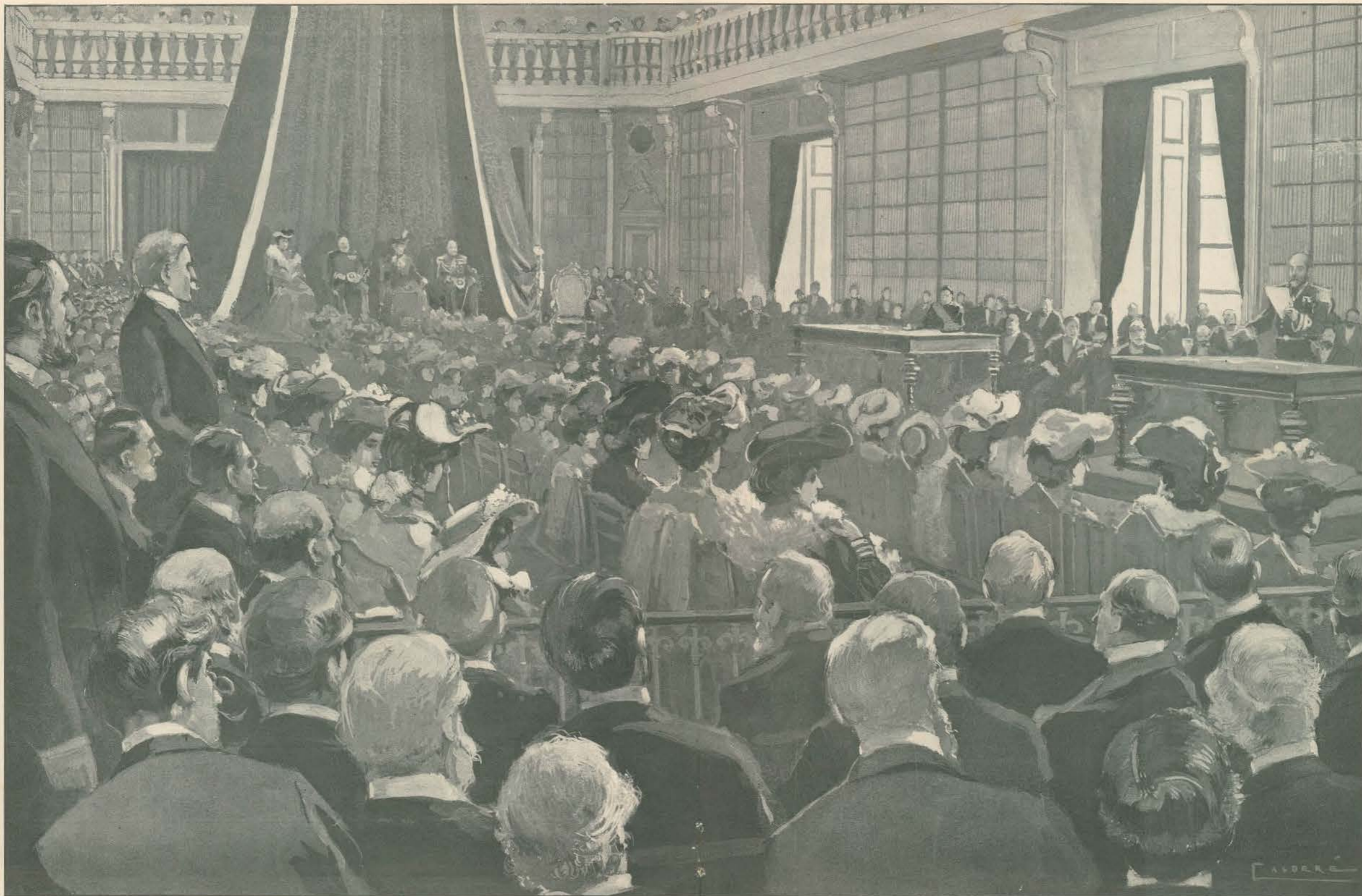
O ELOGIO HISTÓRICO DE PINHEIRO CHAGAS NA ACADEMIA REAL DAS SCIÊNCIAS, EM 8 DE ABRIL.

Com a assistência de SS. MM. o rei e das rainhas D. Amélia e D. Maria Pia e de S. A. o senhor infante D. Afonso, o sr. Henrique Lopes de Mendonça fez o elogio histórico do grande escriptor, que foi secretario da Academia.