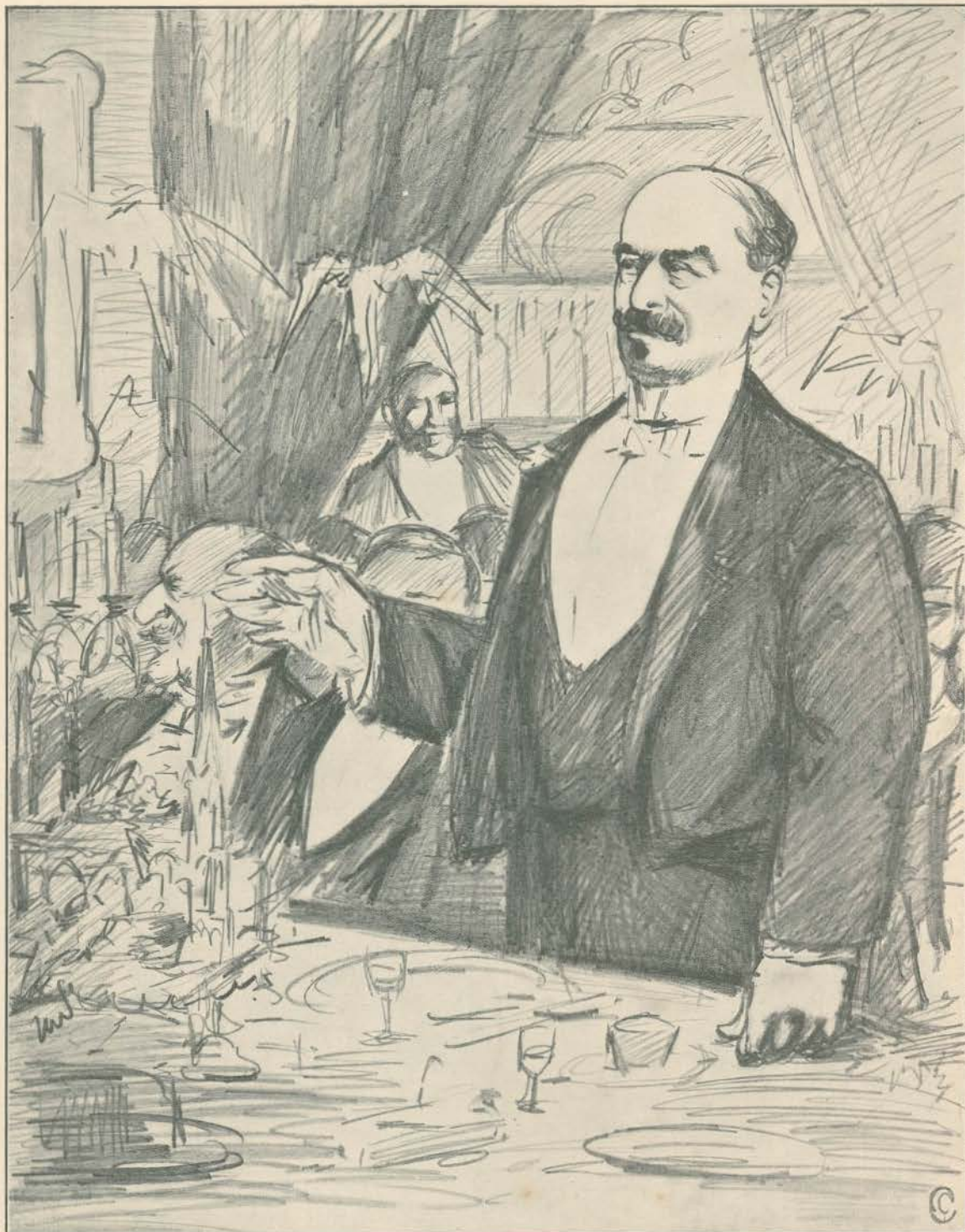
O BANQUETE OFFERECIDO AO SR. MARQUEZ DE SOVERAL PELOS VITICULTORES DA REGIÃO DURIENSE—O SR. MARQUEZ FAZENDO O SEU BRINDE (Segundo um croquis do nosso correspondente especial no Porto)