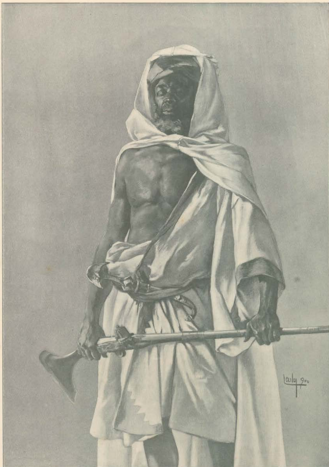
A EXPOSIÇÃO DE BELLAS ARTES—QUADRO DE S. M. EL-REH

O quadro de S. M. é uma figura simples, verdadeira e cômica de esboço, masculina e d'albornoz: um árabe que segura a sua carabina. Tem vida e tem verdade o quadro, tem mesmo alguma coisa de expressivo que marca desde logo o artista.