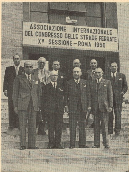
DELEGADOS PORTUGUESES AO C. I. C. F.