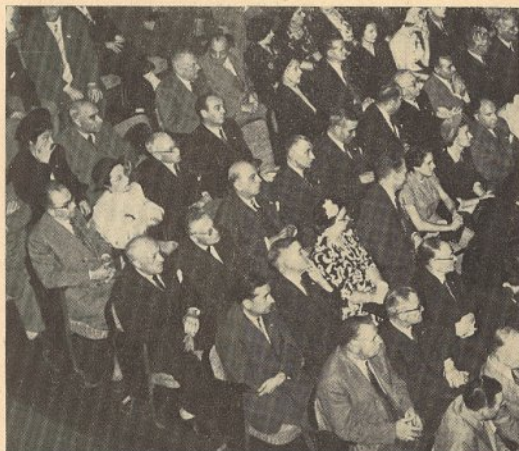
Neste bloco estão presentes alguns dos delegados portugueses na sessão solene de abertura