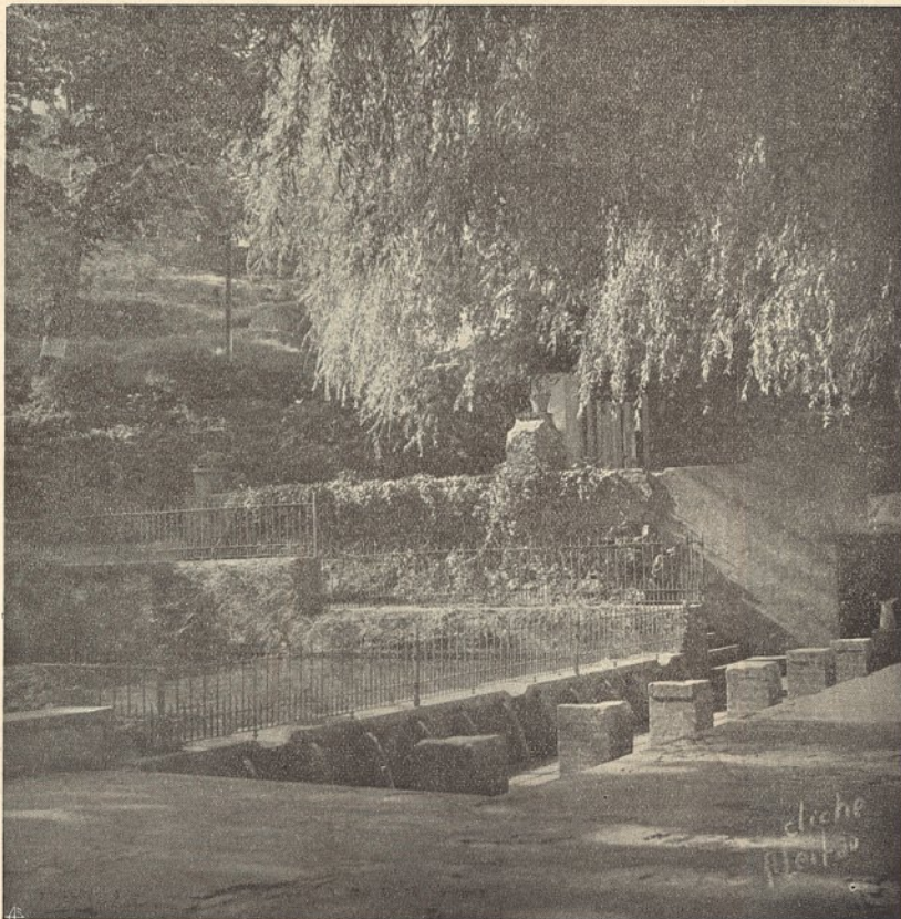
A formosa Fonte de S. João, no LUSO

Rua da Horta Sêca, 7, 1.º Telefone P B X 2 0158—LISBOA