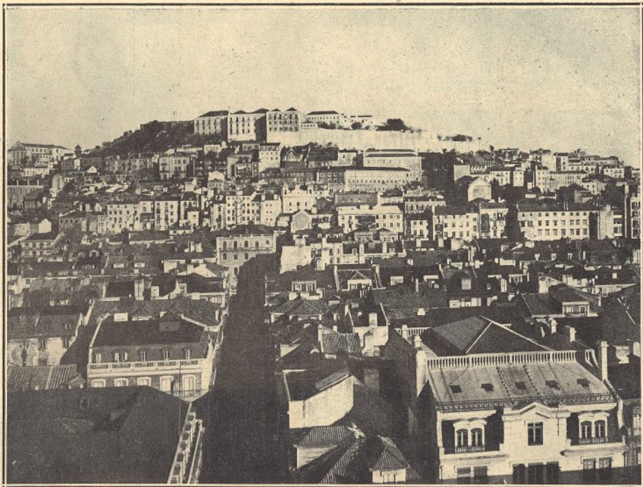
VISTA PARCIAL DE LISBOA — No alto o antigo Castelo de S. Jorge