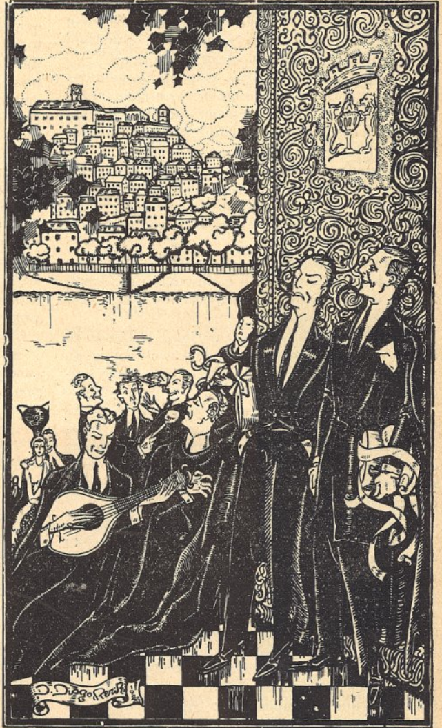
ESTUDANTÉS DE COIMBRA