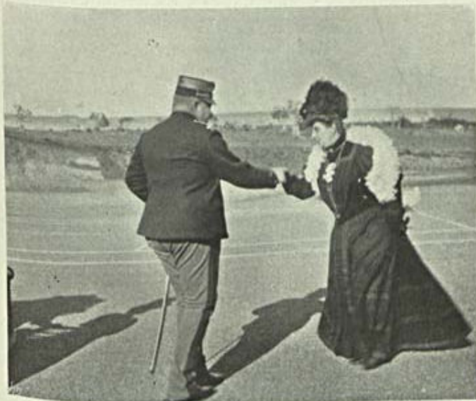
Notas de Sport — Tennis na Tapada