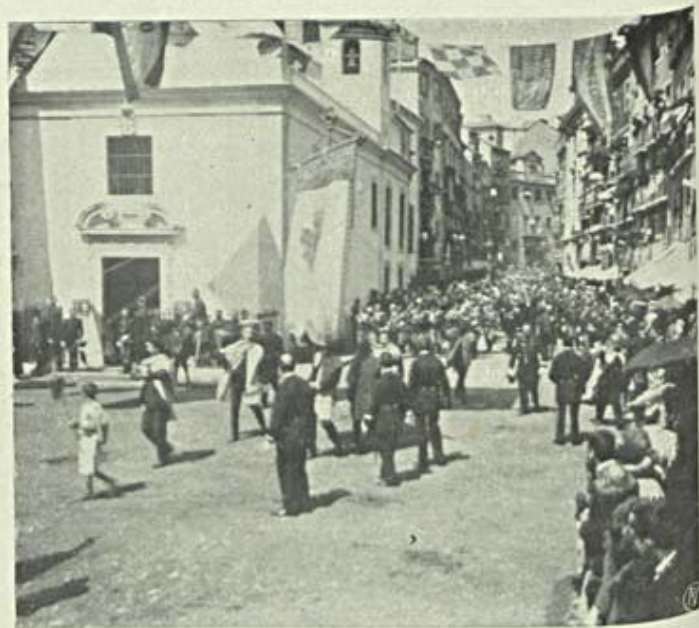
Procissão da Saude. — Aspecto geral

A Fleury e o Saint-Léon, o muito celebre auctor do Saltarello , das Flores animadas , da Estatua encantada , tiveram um beneficio brilhante. A orchestra offereceu-lhe uma bengala de unicornio e castão de ouro, e o habito de Christo cravejado de pedras. O Marquez