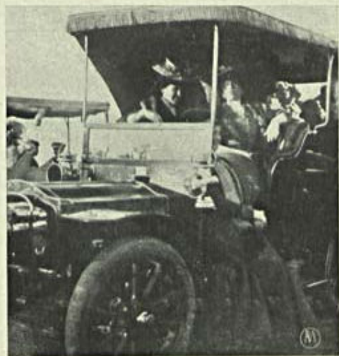
Notas de Sport — No hippodromo — Corridas

Quando o decrescimo de consumo de vinhos no mercado inglez é evidente e quando a Gran-Bretanha é, com enorme differença dos