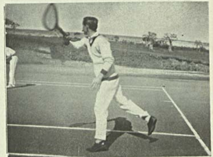
Notas de Sport — Tennis na Tapada

Não quero enredar-me em definições da crise vinicola. Prefiro classificar a como nos "Dragões de El-Rei", definem "mysterio". "E' uma coisa..." "E' uma coisa, um mal estar, de que soffre fundamentalmente toda a agricultura portugueza — toda a agricultura europeia, ia eu dizer — mas que avulta mais na vinicultura por ser esse um dos seus ramos de exploração mais importantes. Mas a crise é tanto vinicola como cerealifera, como corticeira, como pecuaria,