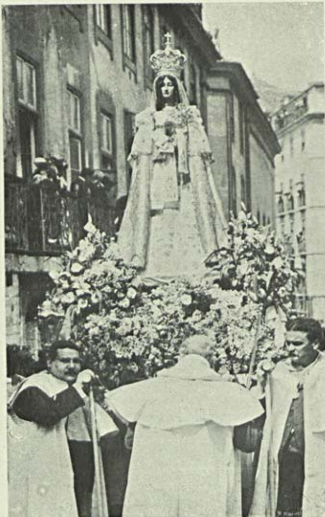
Procissão da Saude. — Andor da Senhora da Saude