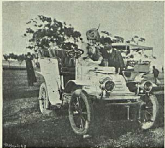
Notas de Sport — No hippodromo — Corridas

E com elle, consegue-se, porventura, abrir caminho facil ao commercio dos vinhos mais fortemente alcoolisados, barateando-os ,