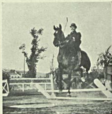
Notas de Sport Saltos nos terrenos do conde de Font'Alva Marquez de Bellas