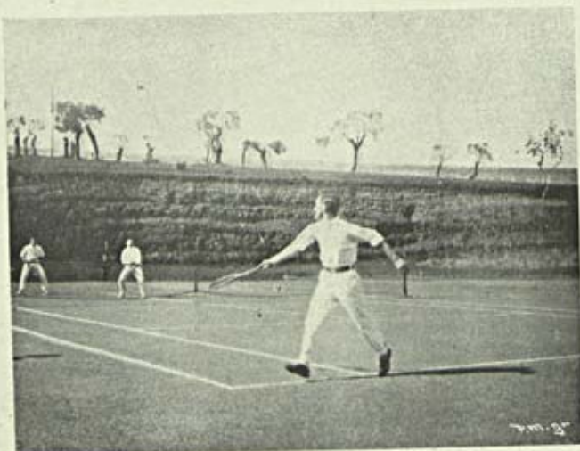
Notas de Sport — Tennis na Tapada Um aspecto do jogo

A actividade politica da Inglaterra não se limitou á entrevista de Gaeta. A Hespanha, apesar da sua decadencia, ainda é hoje factor importante para a solução da questão marroquina, além de outras vantagens que a sua amizade póde proporcionar na eventualidade de um conflicto europeu. Não admira, pois, que para esta nação tivessem convergido as attentões da Grã-Bretanha, e que