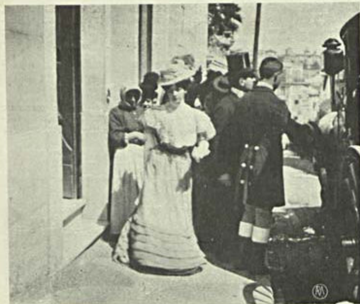
Vida elegante — Um casamento

Em Santos, em Alcantara, até na Mouraria já ha Pathés. E todos elles, pelo visto, ganham dinheiro, o que nos leva a crer que ha muitos amadores dos Pathés. Talvez os patetas, que são em numero