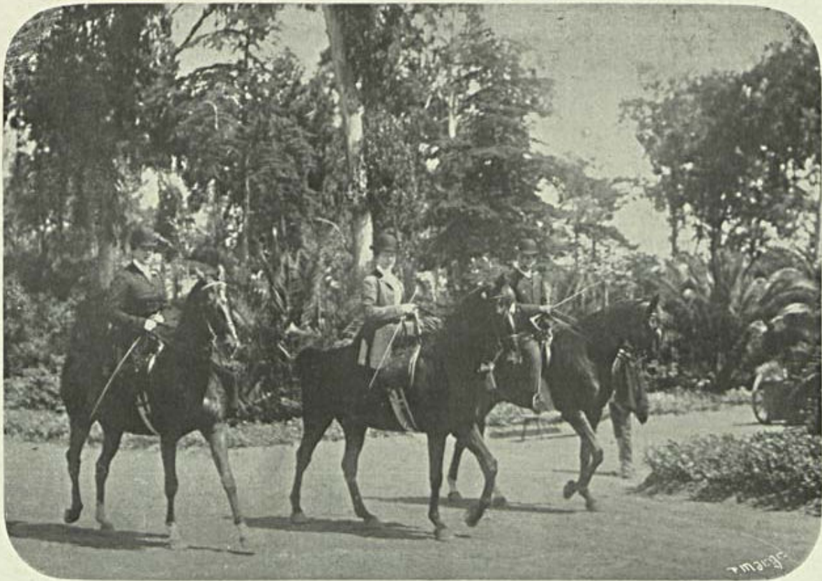
S. M. a Rainha e a Princesa Waldemar