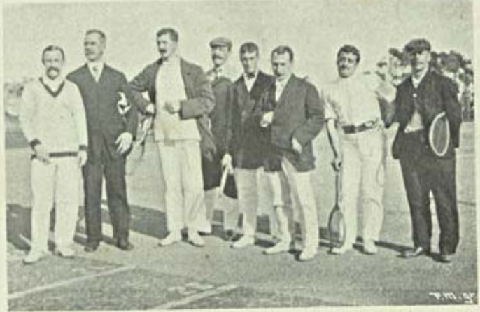
Notas de Sport — Tennis na Tapada

E' preciso ataca-la pela divulgaçãõ do ensino agricola, em primeira linha, pela fundação e alargamento do credito, pela remodelaçãõ do regimen tributario, pela justiceira incidencia do imposto,