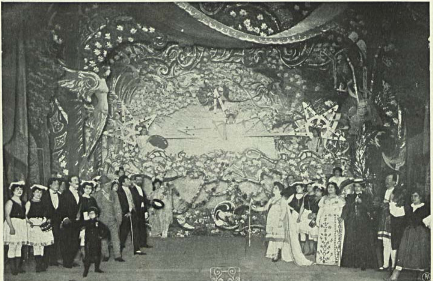
Ultima scena do 3.º acto