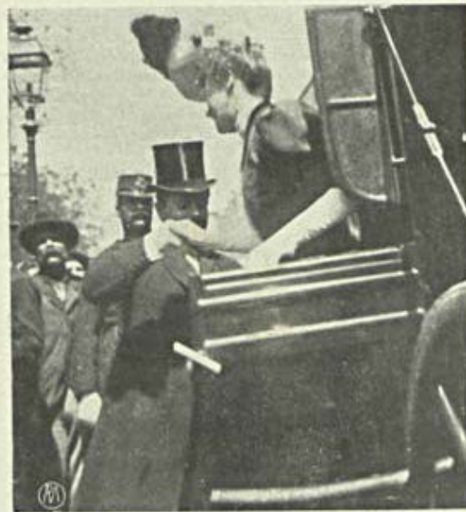
Vida elegante — Um casamento

Podia-se ter dispensado, o meu correspondente, do dispendio de tantas palavras. Para me agravar, — que não agravava tal! — basta-