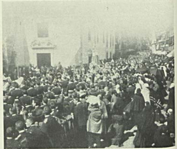
Procissão da Saude. — A procissão