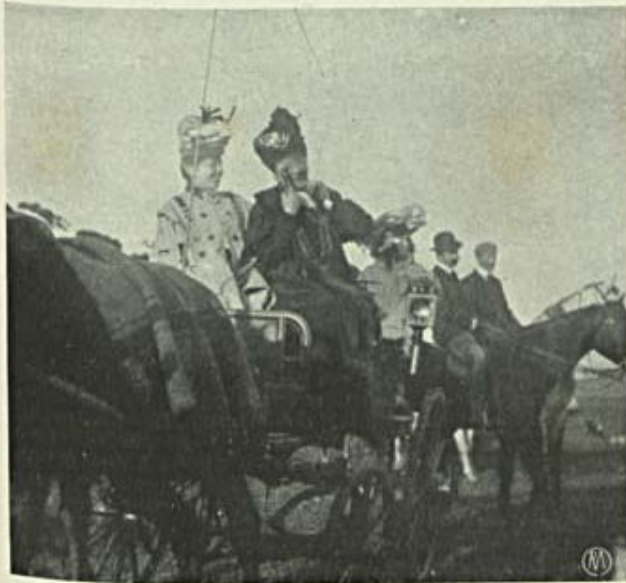
Notas de Sport — No hippodromo — Corridas

No commercio d'estes vinhos alcoolisados até 17 graus, Portu-