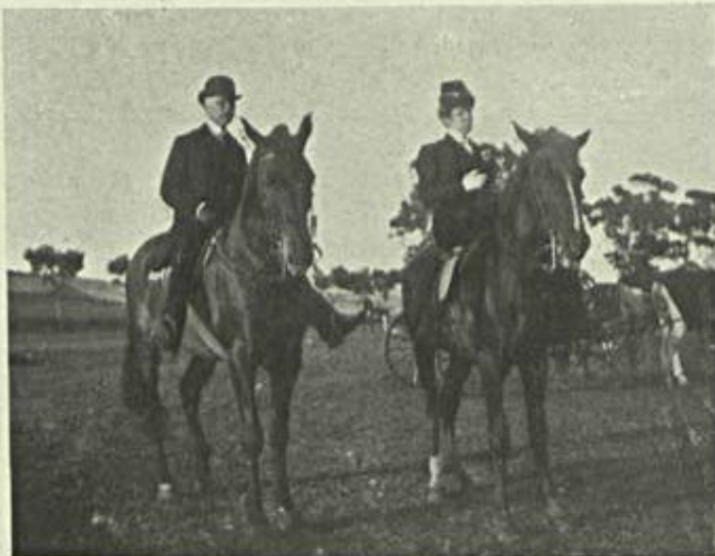
Notas de Sport — No hippodromo — Corridas Assistindo ás corridas

Não se quiz ou não se soube vêr que a solução proteccionista legislativa para resultar perduravel e efficaz era preciso ser acompanhada de providencias technicas agronomicas que assegurassem