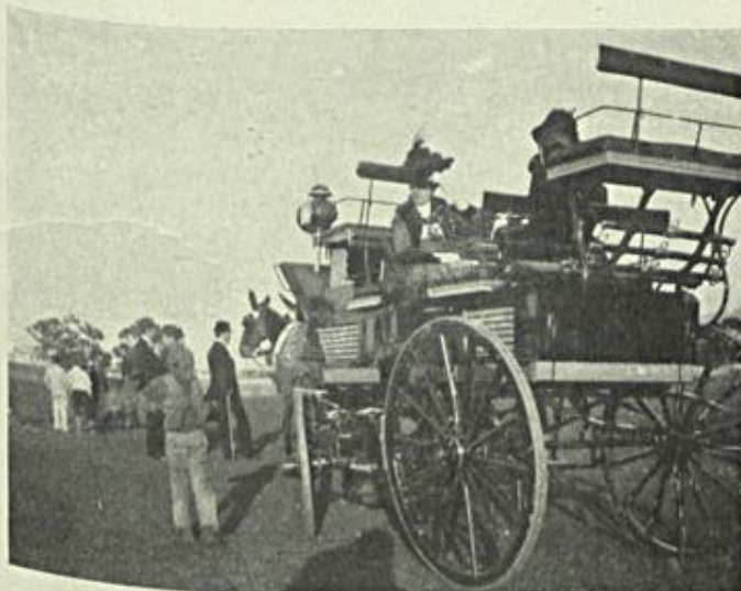
Notas de Sport — No hippodromo — Corridas,

E aqui está o caso: em contraposição com aquelle auspicioso avanço, perdemos em cinco annos, na exportação para Inglaterra, nos vinhos mais alcoolisados de 17 a 23 graus centigrados, perto de 8.500 pipas, ou seja 27,6 por 100.