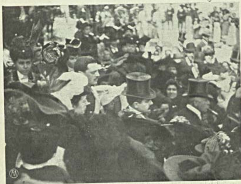
Vida elegante — Um casamento

Porque a verdade é que nenhum de nós, habitantes de Lisboa, se preocupa com taes coisas. Mais: irritam-nos. Se desdobramos um jornal e se nos depara com o celebre artigo pela setima vez fervido, como o chá do Tolentino. «Um anno de fome!», logo franzimos as sobrancelhas e temos um encolher de hombros que traduz perfectamente esta phrase, que nem nos damos ao trabalho de pronunciar: «Que terei eu com isso!» Se no nosso Club, n'um estabelecimento, em qualquer parte, um agricultor solta seu