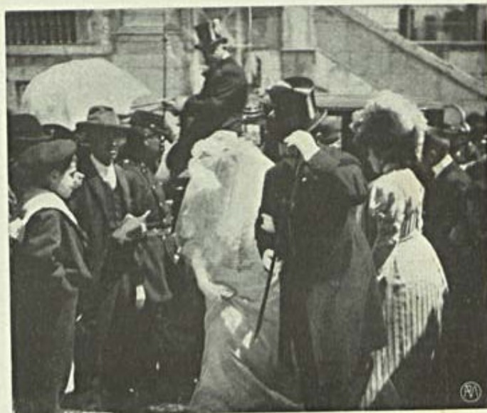
Vida elegante — Um casamento

Mas se a Providencia não attende em absoluto ás supplicas dos que lhe pedem chuva ou sol de rachar a bem da terra e esta não pro-