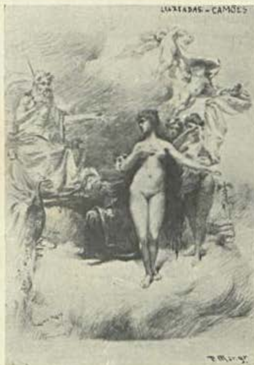
Album offerecido a Loubet Pagina de Carlos Reis

enorme concorrência de gente, e ninguém sabe ainda hoje quem era e o que era, o pobre russo.