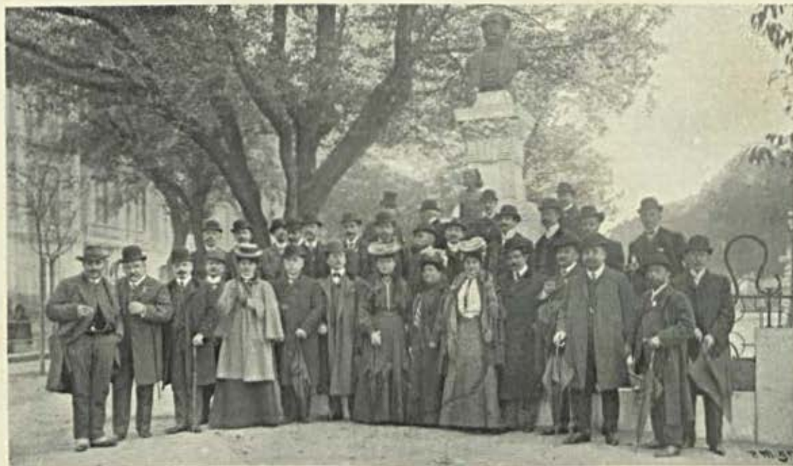
Grupo de jornalistas francezes e portuguezes, tirado em S. Pedro de Alcantara em 30-10-905

A virtude mais rara nas luctas do pensamento, é a moderação.