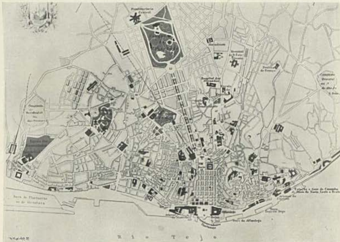
Planta da cidade de Lisboa e das installações maritimas na margem direita do Tejo