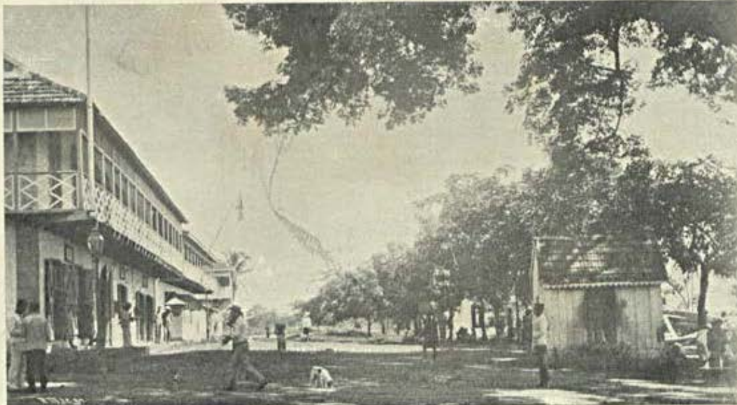
Bolama. — Rua marginal

Não viram decerto, nunca leram que em Monte-Carlo houvesse desordens, cabeças partidas, roubos, suicidios? Pois todas essas scenas, todos esses crimes que constituem entre nós o cadastro da policia, e que fariam a delicia dos informadores dos nossos diarios, tudo isso, ha em Monte Carlo, todos os dias e a toda a hora. Os jornaes nunca o dizem porque o seu silencio — todos lá o sabem, — fi-