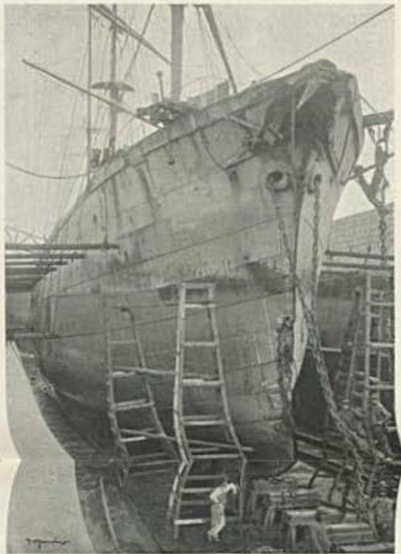
Doca de reparação — Transatlantico hespanhol Afonso XIII, em limpeza de fundo