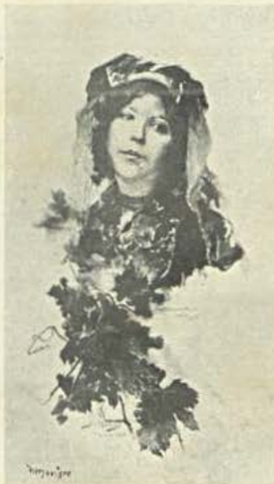
Album offerecido a Loubet Pagina de José Malhóia

D epois de ter saído de Lisboa o Presidente da Republica Fran- ceza prolongaram-se as festas, não as do paço, ou as nacionaes, como lhe queiram chamar, mas as dos jornalistas. Graças a um esforço colectivo e a um geral accôrdo de boas vontades, puderam os jornalistas estrangeiros que nos visitaram reconhecer não só que Portugal era um paiz hospitaleiro por excellencia, mas tambem que estamos menos longe da civilisação