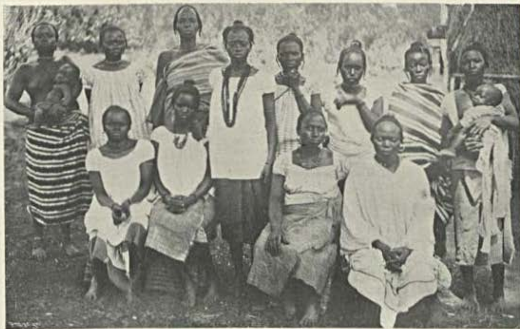
Mulheres do Oio (mandingas)

Espera-se sempre demasiado do futuro: só os pessimistas tem surpresas felizes.