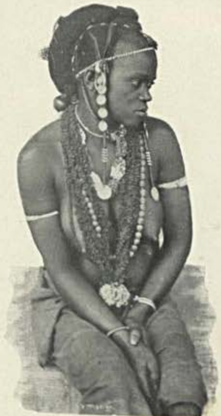
Mulher da raça fulla-forro Circumscrição de Geba