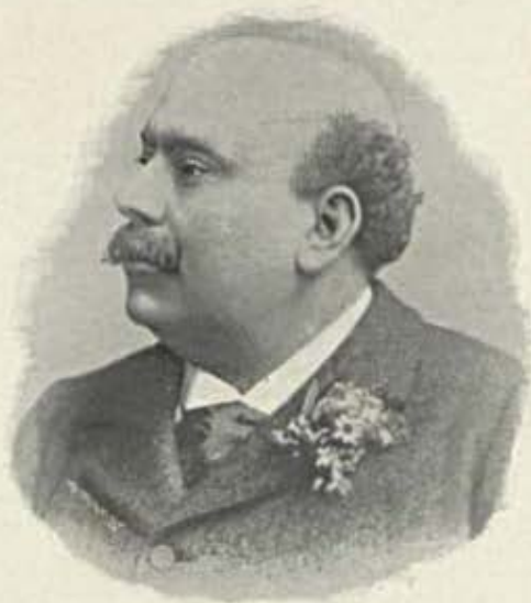
Visconde de S. Luiz Braga