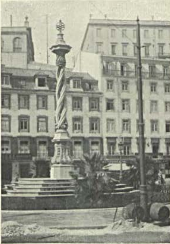
O Pelourinho do largo do Município