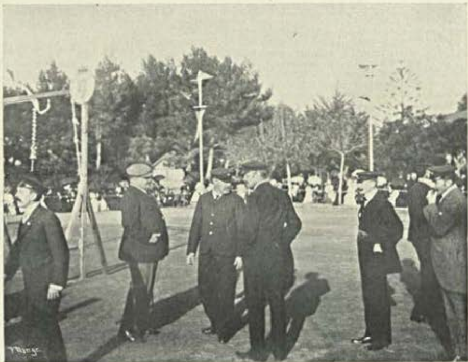
El-Rei e Infante D. Affonso