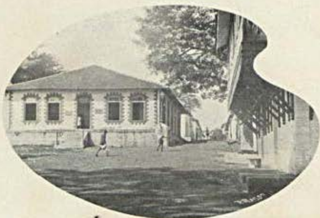
Repertição de fazenda em Bolama