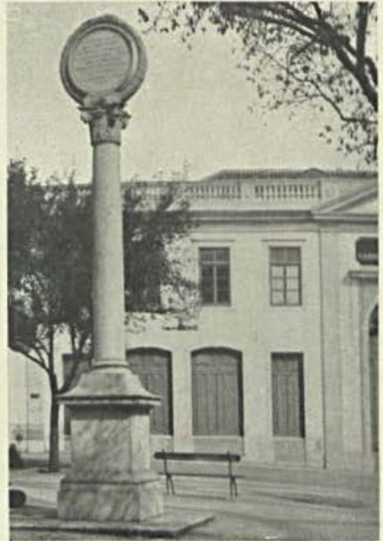
A Palmatoria do largo de S. Roque