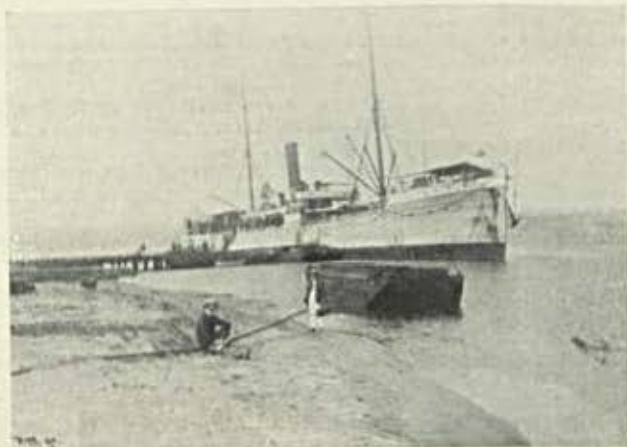
O vapor «Ambaca» atracado á ponte na bahia do Lobito