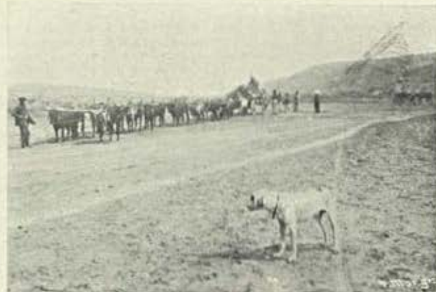
Expedição mineira da companhia do caminho de ferro de Benguelia ao Lobito