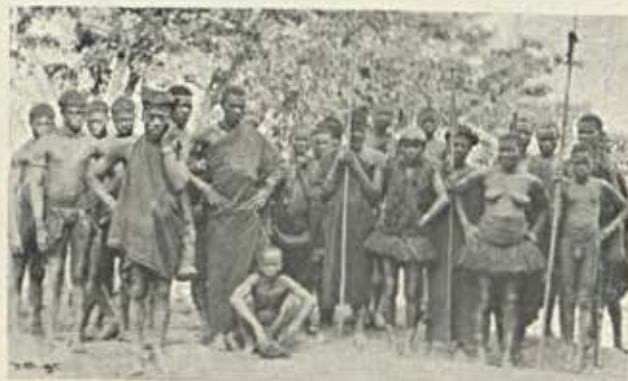
Grupo de Bijagós

preendeu em absoluto. Mais cedo ou mais tarde havia de vir, e com esse facto e com as consequencias d'elle derivadas, todos mais ou menos contavam.