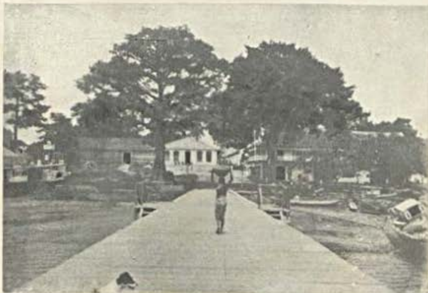
Ponte de Bolama

russo-alemã fracassou, nada mais resta ao tsar do que congraçar-se com a sua antiga rival, tanto mais que os interesses em jogo, em vez de fundamentalmente oppostos, são de todo o ponto conciliáveis. Grande será o erro commettido pela Russia, se ella não aproveita esta occasião unica, que se lhe offerece, para regularisar a sua tão compromettida situação internacional.