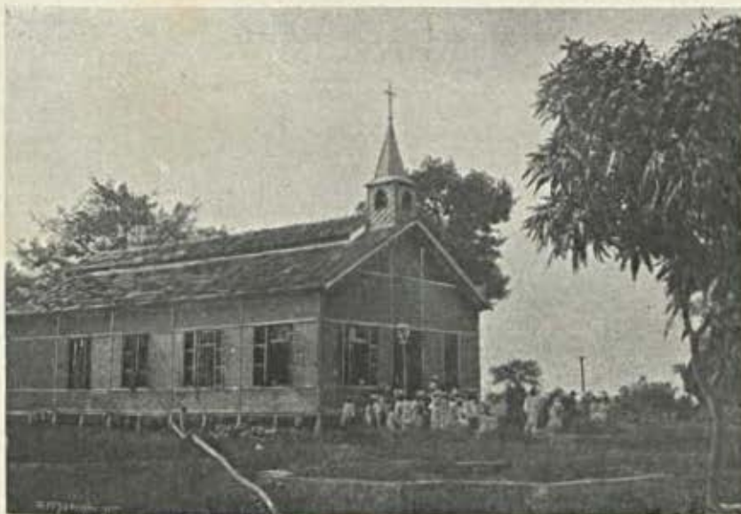
Bolama. — Igreja matriz

Alguns mesmo, os que conhecem o Casino como os seus dedos