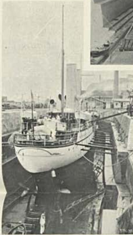
O yacht -R. Amelia- na doca