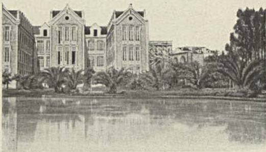
Novo hospital das Caldas da Rainha

Na elegante marquise do seu palacio da Lapa o visconde pergunta á viscondessa: