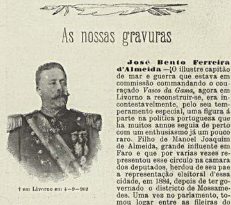
† seu Livro em 4-9-902