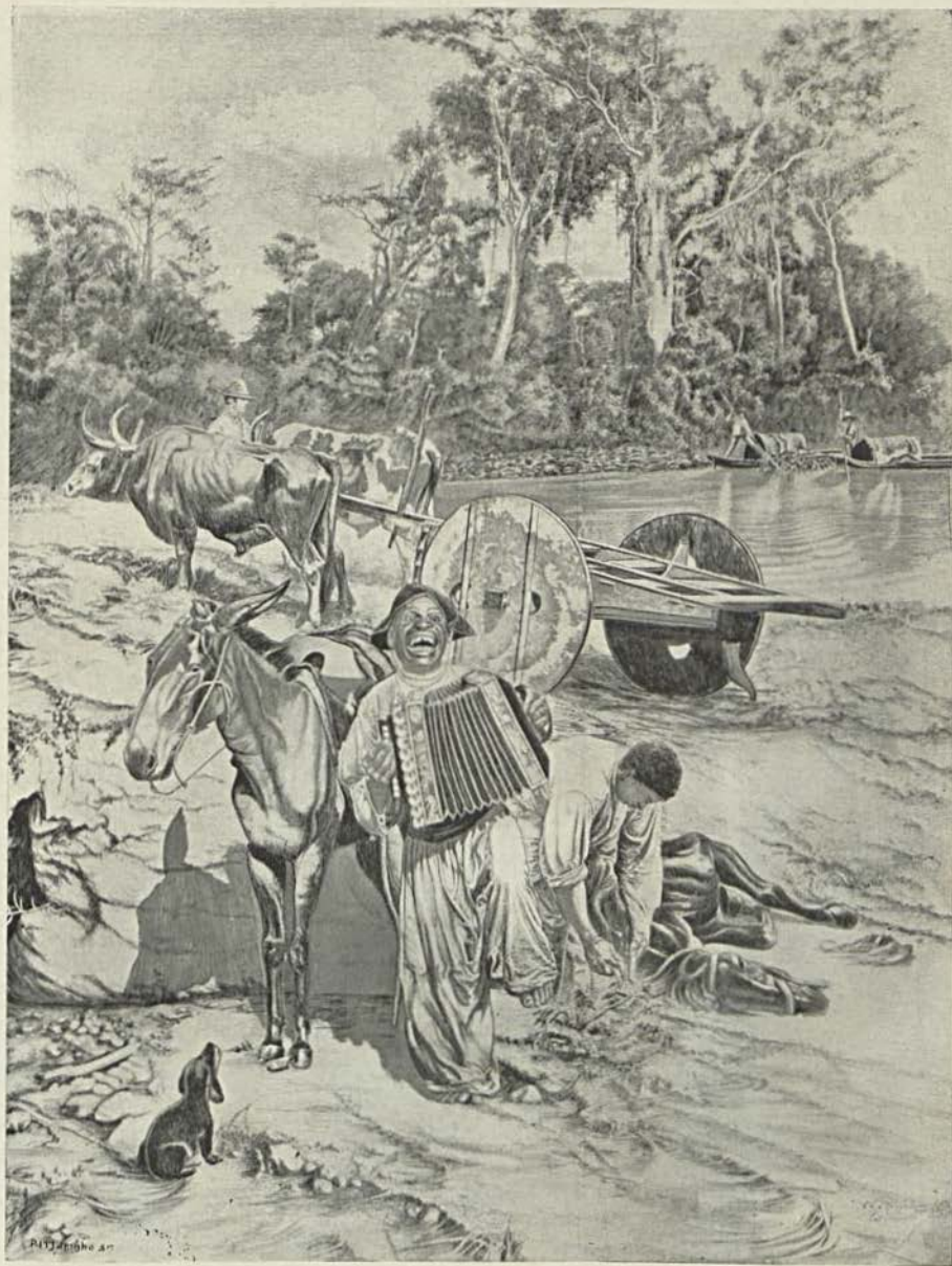
CANTOR DESAFINADO — Quadro de WILLI REICHART