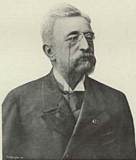
DR. AFFONSO CELSO ASSIS DE FIGUEIREDO

Figura proeminente do Brasil, especialmente durante o regimen imperial, o visconde de Ouro Preto foi o ultimo presidente do conselho de ministros nomeado pelo Imperador. Já muitas vezes tivera logar nos conselhos da corôa, prestara valiosos servicos ao paiz, e com o seu talento de estadista, o seu conhecimento dos homens e das coisas, e sciencia do fóro que levava sempre para a vida politica, é justo dizer-se, agora sobretudo que já vai longe o periodo aureo da existencia do visconde de Ouro Preto, que elle foi entre os grandes estadistas do Brasil um dos mais honestos, dos mais uteis e dos mais leaes.