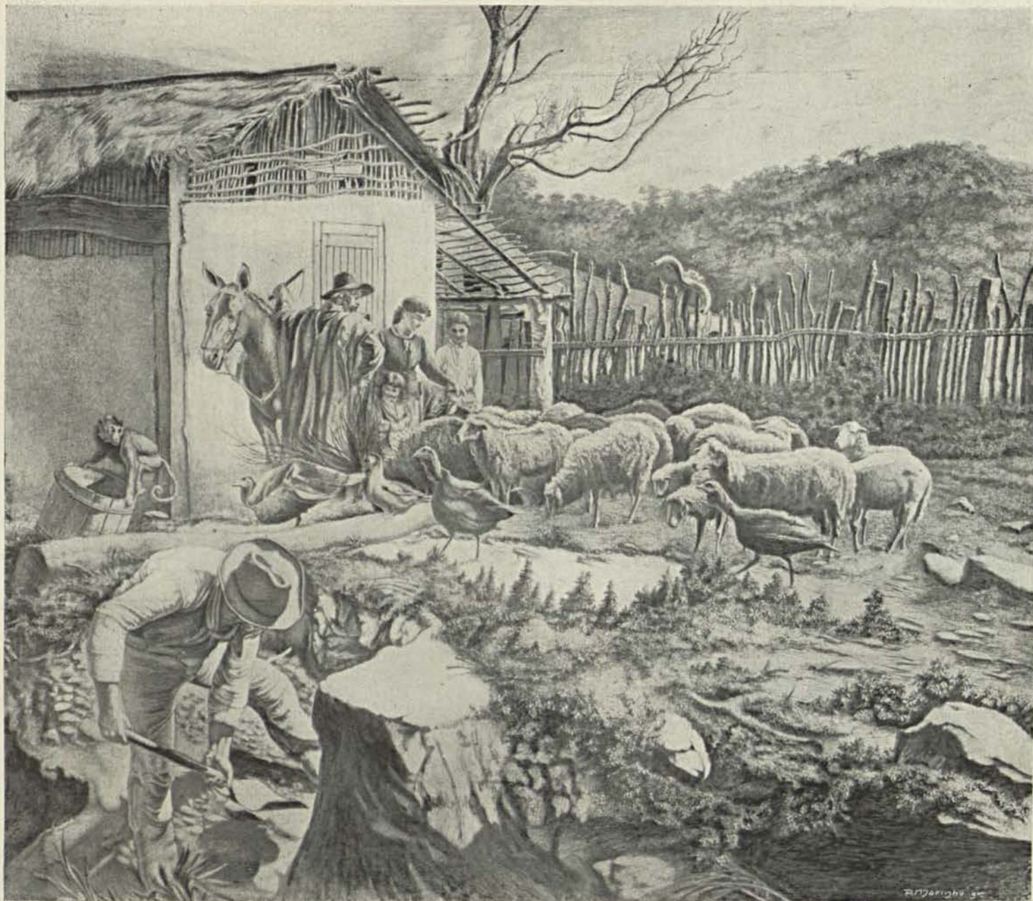
SCENAS CAMPESTRES — Quadro de WILLI REICHART