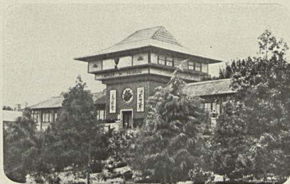
A fabrica de faianças de Raphael Bordallo Pinheiro

E lá longe, transpondo a Matta de discretas sombras, e de occultos