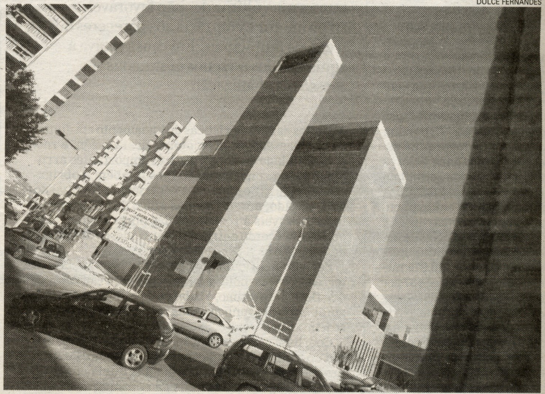
O complexo conta com 284 lugares de estacionamento subterrâneos