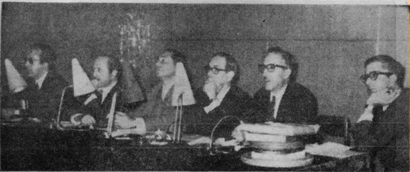
Prossegue, no Casino Estoril, o festival de Cinema de Amadores que antontem principiou, conforme noticiámos. Até á próxima sexta-feira serão exibidos, todas as noites, em sessões publicas, os filmes concorrentes e, no sábado, serão proclamados os vencedores. Na foto vêem-se alguns dos componentes do júri, durante uma das sessões de projecção