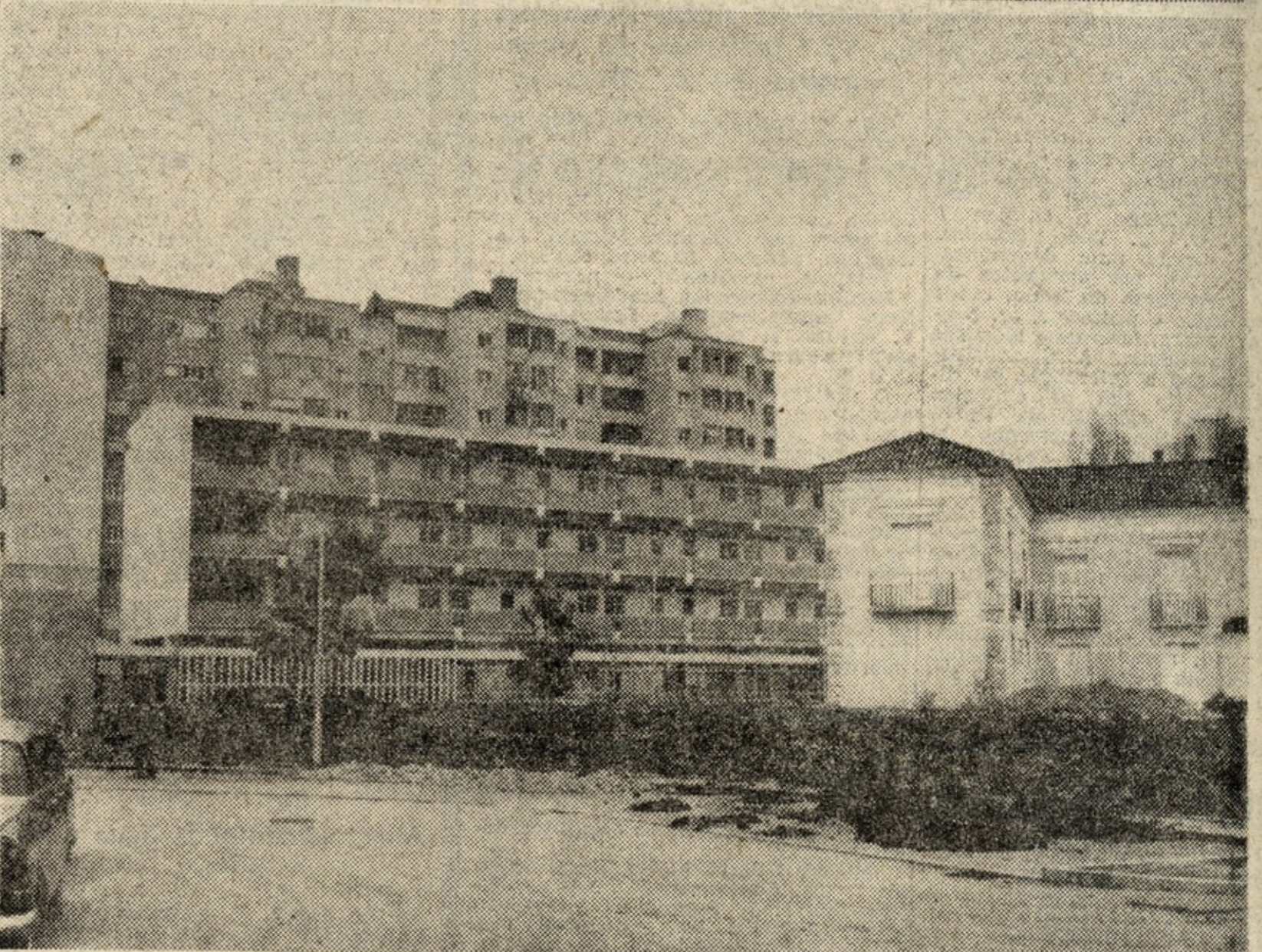
O antigo «palácio» dos Coruchéus, que vai funcionar como centro de cultura, serve de charneira aos dois modernos edifícios para «atelier» dos artistas