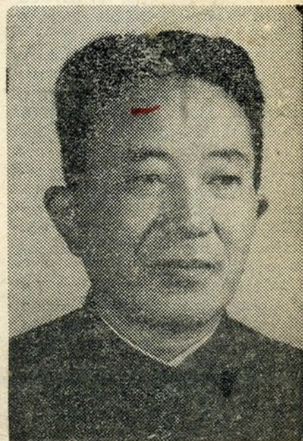
O general Lo Jui Ching, chefe do estado-maior do exército chinês e vice-primeiro ministro da China, foi substituído pelo general Yang Chen Wu

A PÓS vários meses, confirma-se que a vida política chinesa tem vindo a ser perturbada por um conflito cujo objectivo é a sucessão de Mao Tsé Tung. O Ocidente só se apercebeu deste conflito quando algum ou um grupo dos interessados foi eliminado da corrida para o Poder. Foi o que se passou há dias, quando Pequim anunciava a evicção do chefe do estado-maior do Exército e a sua substituição por um jovem coronel (ou ex-coronel, pois as patentes já não existem no exército chinês).