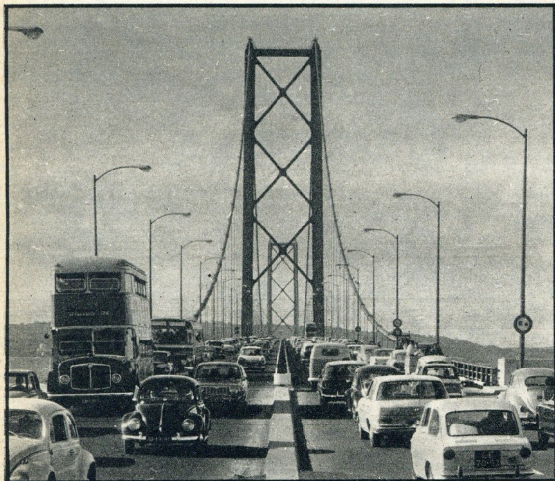
LOGO QUE SE TORNOU POSSÍVEL, DEZENAS DE MILHARES DE CONDUTORES APROVEITARAM A OCASIÃO PARA CRUZAREM A MAGNÍFICA OBRA DE ENGENHARIA