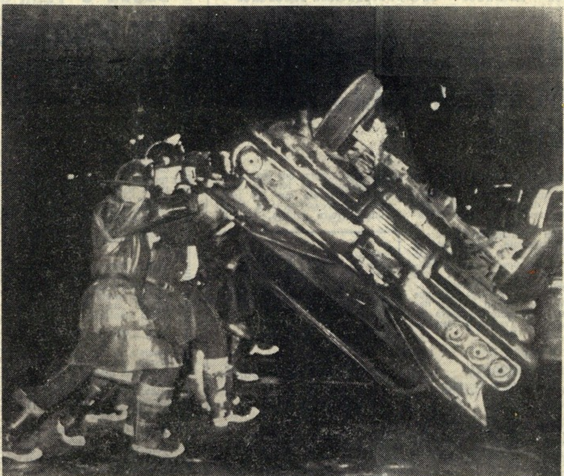
Continuam em Chicago, bem como em outras cidades, as violências raciais. A fotografia mostra um grupo de bombeiros daquela cidade quando tentava pôr na posição normal um dos vários carros que tinham sido voltados e incendiados

e dirigente de uma campanha para a inscrição dos homens de cor nas listas eleitorais.—(F. P.).