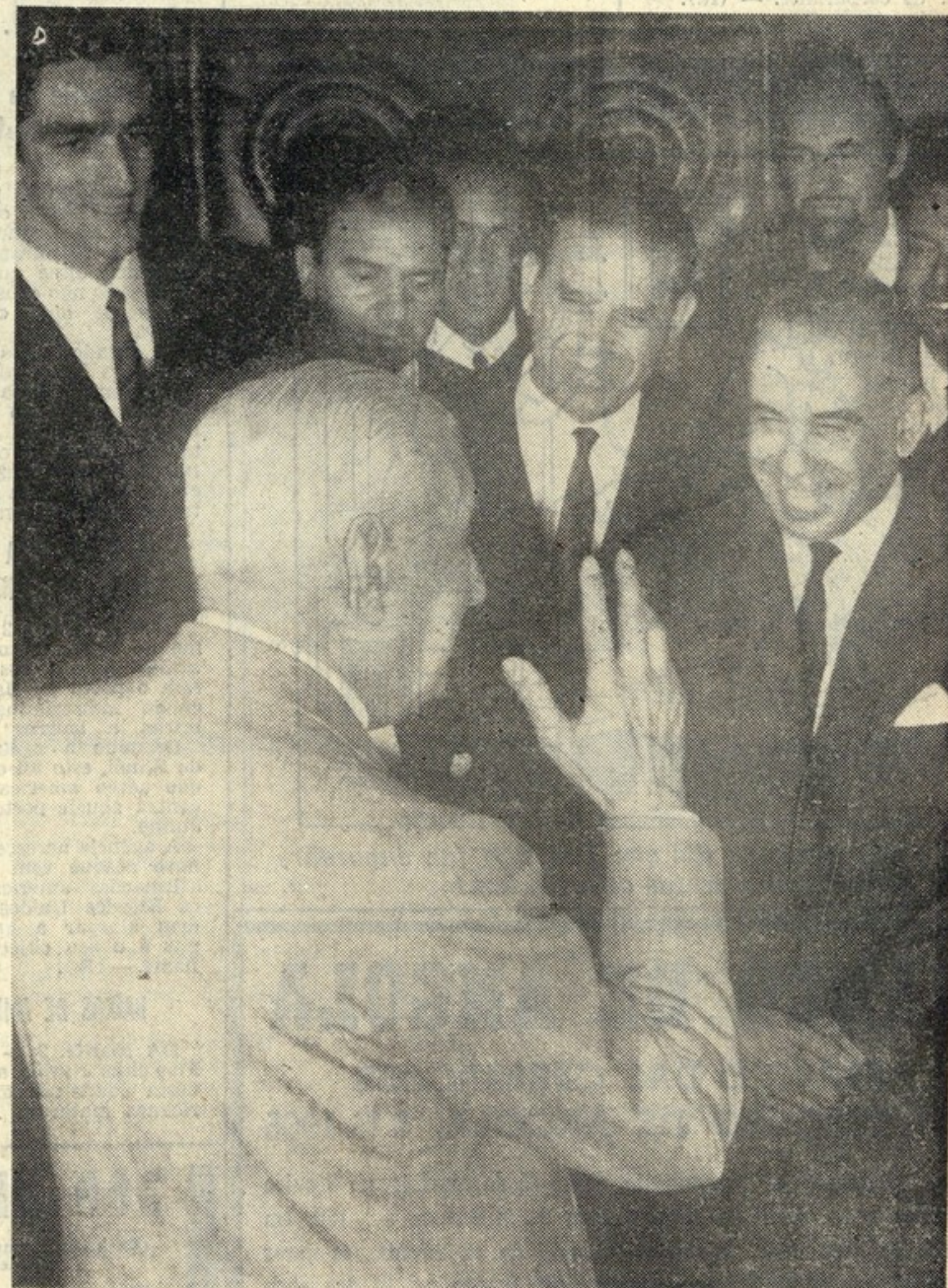
O sr. Presidente do Conselho dialogando com os membros da delegação portuguesa ao Campeonato Mundial de Futebol