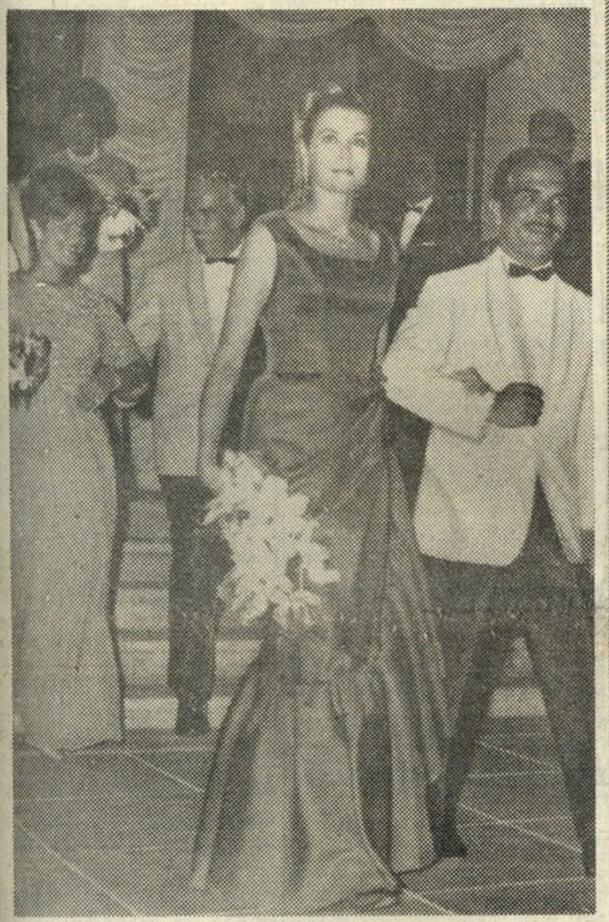
A princesa Grace e o rei Hussein da Jordânia, seguidos pelo príncipe Rainier, à entrada para uma festa de beneficência a favor da Cruz Vermelha do Monaco

QUEM FOI QUE BATEU? Dois goeses queixam-se do ministro e este dos dois goeses