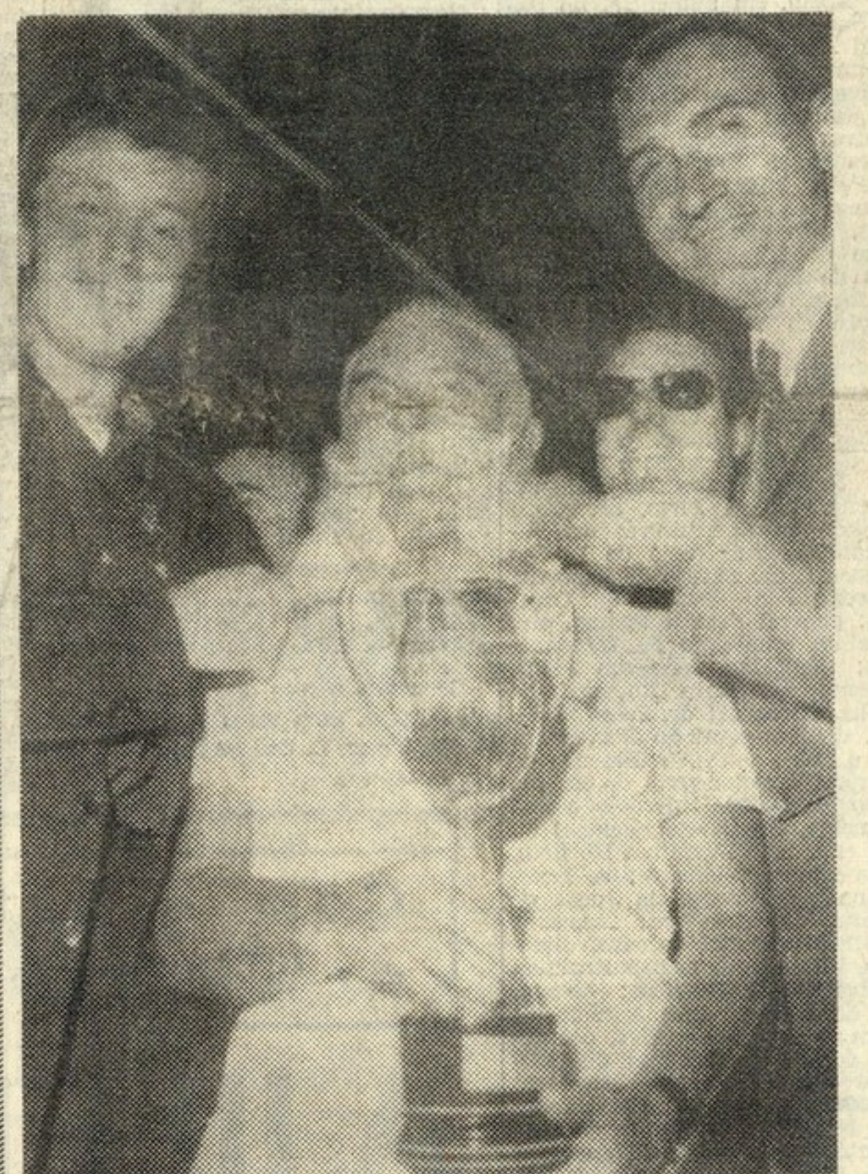
O major reformado do Exército Italiano, Giovanni Bianchi, que vemos na gravura sob os olhares admirativos do cantor Bobby Solo (à esquerda) e do mestre de cerimónias Pippo Baudo, ganhou o título de «Superbigode» de 1966, num invulgar concurso antecedido realizado em Taranto