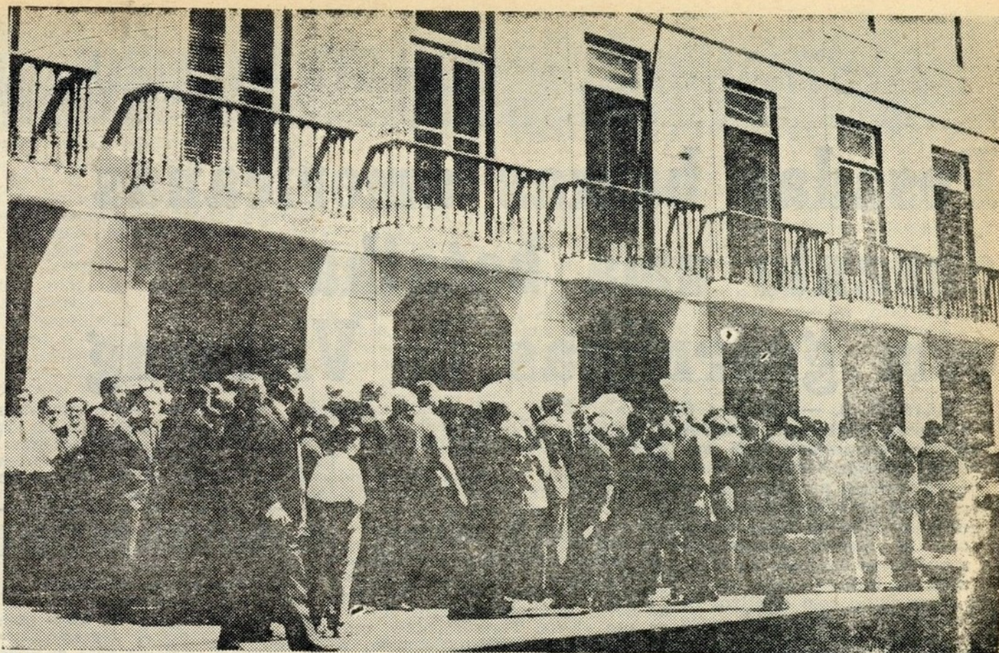
Junto ao edifício do Banco de Portugal, na Rua do Comércio, formou-se uma extensa bicha

Nada menos do que 10 empregados do Banco, em Lisboa, procederam á troca de moedas, numa actividade dinamica e ininterrupta. O Banco de Portugal decidiu trocar apenas um máximo de 5 moedas a cada pessoa. Não foi possível, até ao encerramento dos serviços para o almoço dos funcionários, organizar «bichas» dos interessados, como seria conveniente á boa ordem das operações de troca. Em consequência os lugares, ao longo do passeio de entrada no estabelecimento, disputavam-se a soco e empurrões, entre constantes apertos. No passeio fronteiro os mais prudentes aguardavam a sua oportu-