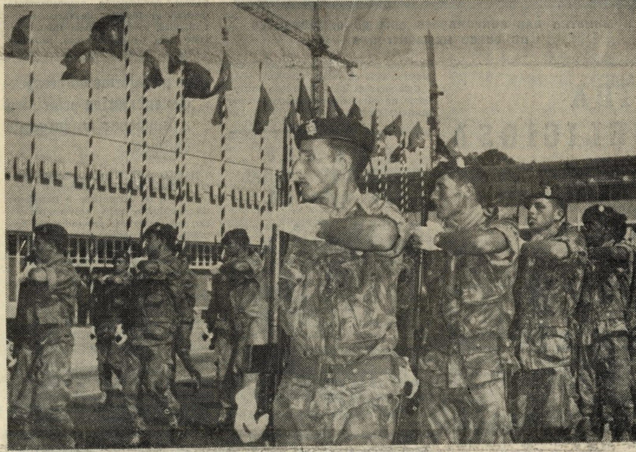
O DESFILE DOS PARA-QUEDISTAS