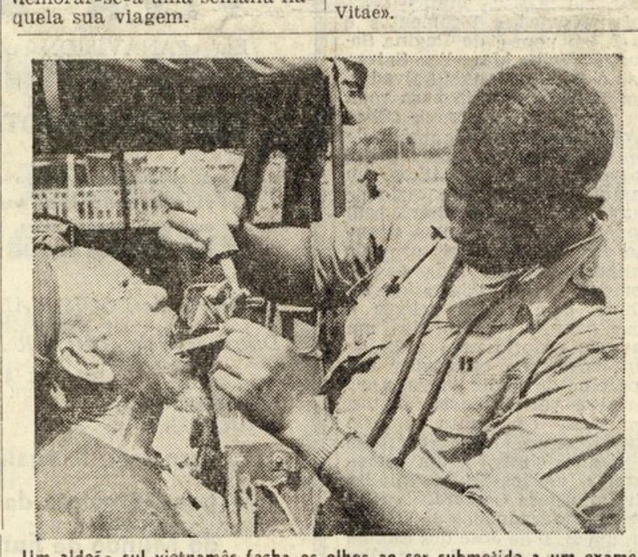
Um aldeão sul-vietnamês fecha os olhos ao ser submetido a um exame à garganta por um membro do corpo médico do exército americano.

Os Estados Unidos facilitam a assistência médica no xico sul-vietnamês, segundo um programa para melhorar a saúde do mesmo