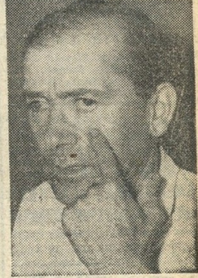
«Quando comecei a ver nem acreditava que fosse possível!»